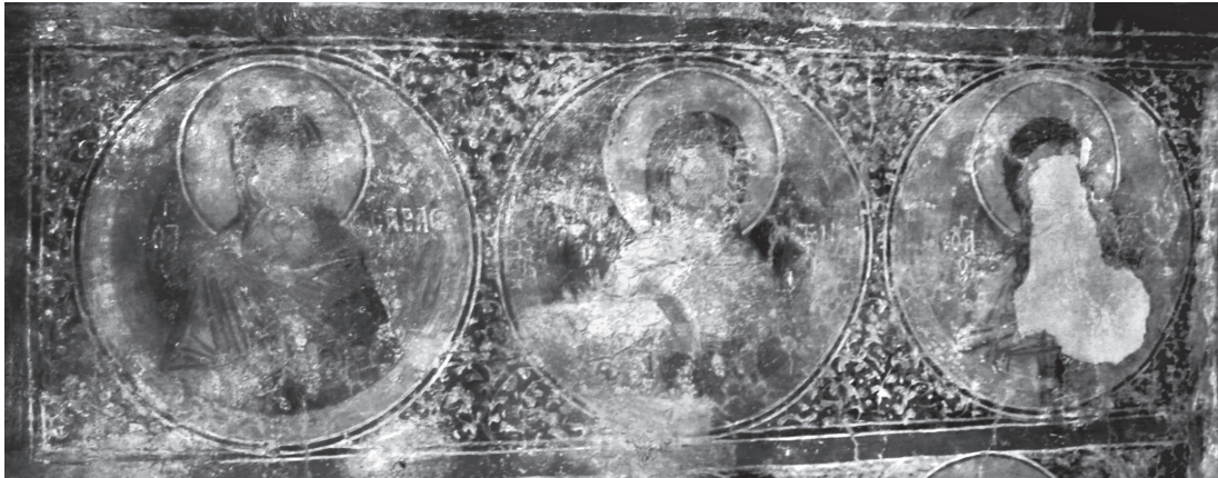
Εικ. 4. Μαριτσά, Άγιος Νικόλαος. Βόρειος τοίχος, στηθάκια. Οι άγιοι Σάββας, Αντώνιος και Ιωάννης ο Πρόδρομος.

Ο ΕΝΜΑ/ΝΟΥΗΛ 30 . Η ύπαρξη του μεγάλου προσκυνήματος στο Θάρι 31 , το προσωνύμιο του οποίου φέρει η μορφή στον Άγιο Νικόλαο, συνέτεινε στην απεικόνιση του στο ναό. Κάτι ανάλογο πιστεύουμε ότι συμβαίνει και με τον στηθαίο άγιο Σάββα (Εικ. 4), καθώς οι σχέσεις ανάμεσα στα βενετοκρατούμενα νησιά του ελλαδικού χώρου και την ομώνυμη αγιοταφιτική μονή δεν είχαν διακοπεί καθ' όλο τον 15ο αιώνα 32 , αλλά και με τον άγιο Γεώργιο με το προσωνύμιο Διασορίτης 33 , το οποίο