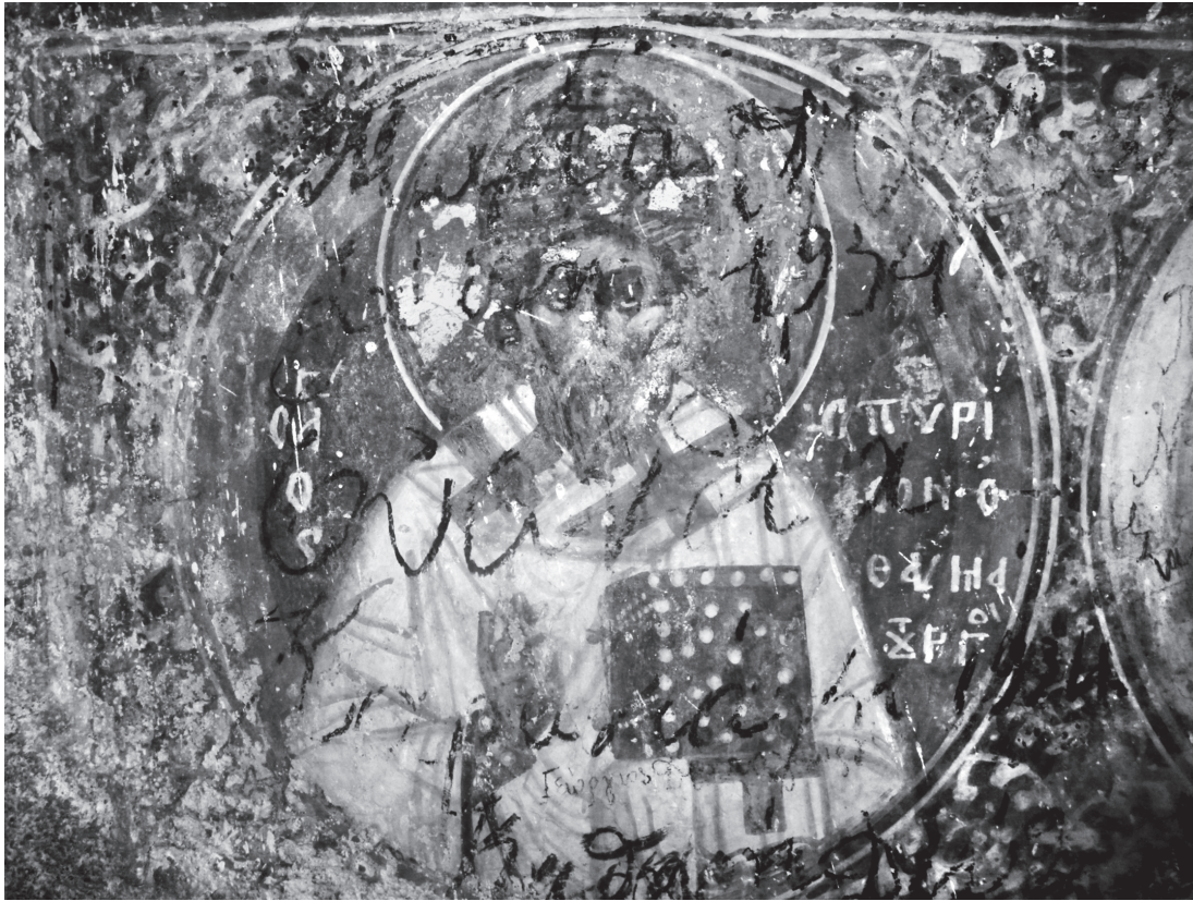
Εικ. 8. Μονόλιθος, Αγία Αναστασία. Νότιος τοίχος, στηθάρια. Ο άγιος Σπυρίδων.

γηθεί στις αρχές ή στις πρώτες δεκαετίες του 15ου αιώνα, καθώς στις μορφές που αποδίδονται στον πρώτο ζωγράφο, ανιχνεύονται διακριτά στοιχεία του ύστερου 14ου αιώνα. Τα λεπτά, γραμμικά φωτισμάτα, οι καλοσχεδιασμένες μορφές, τα προσεγμένα, ανεπαίσθητα περιγράμματα, προσιδιάζουν σε εποχή κατά την οποία η τέχνη δεν έχει αποκρυσταλλωθεί σε συγκεκριμένες τυπολογίες, αντίθετα εξελίσσεται και αποδίδει καλλιτεχνικά. Δεν θα ήταν λοιπόν απίθανο, σύμφωνα με τα υπάρχοντα στοιχεία, να θεωρηθεί ότι ο ναός της Μονολίθου τοιχογραφήθηκε κατά την περίοδο που ο Αλέξιος μαθήτευε πλάι σε έναν ικανό δάσκαλο και τα διαφορετικά χέρια που διακρίνονται στο έργο να ανήκουν στα δύο αυτά πρόσωπα. Ωστόσο, η προγραμματισμένη συντήρηση του διακόσμου αναμένεται να δώσει περαιτέρω στοιχεία σχετικά με το χαρακτήρα της ζωγραφικής του.