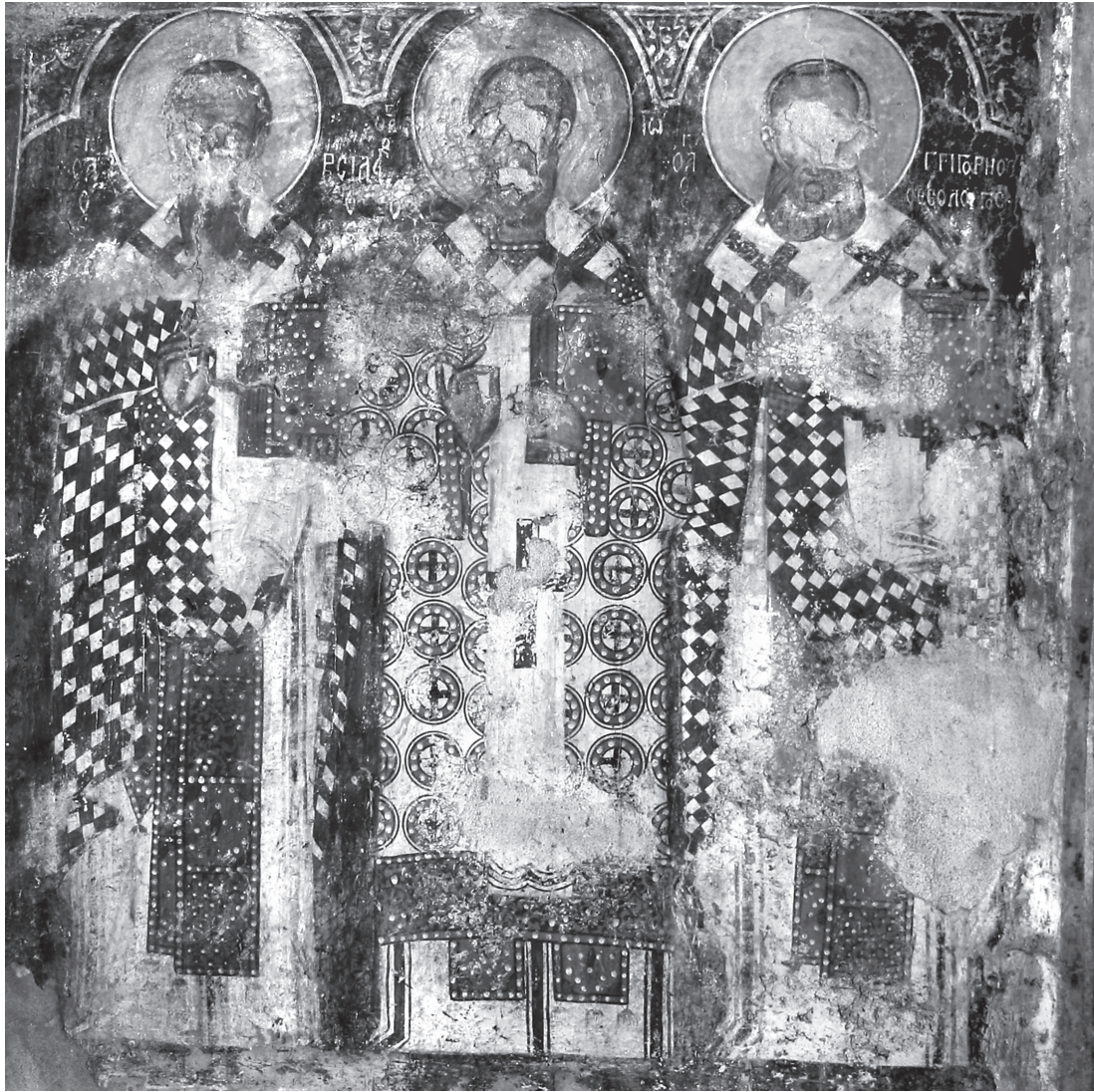
Εικ. 5. Μαριτσά, Άγιος Νικόλαος. Βόρειος τοίχος, κάτω ζώνη. Οι Τρεις Ιεράρχες.

Περαιτέρω, η τιμητική θέση που λαμβάνουν οι δύο απόστολοι Πέτρος και Παύλος εκατέρωθεν της εισόδου, θέμα γνωστό και από αλλού στη Ρόδο 46 , δεν θα ήταν άτοπο να σχετισθεί, θεωρούμε, με πιθανούς συμβολισμούς