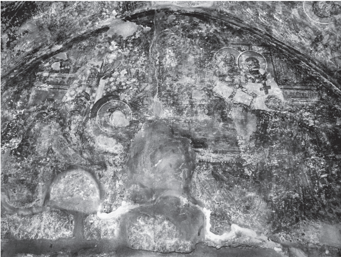
Εικ. 6. Μαριτσά, Άγιος Νικόλαος. Τύμπανο δυτικού τοίχου. Η Κοίμηση της Θεοτόκου.

που θα αποσκοπούσε σε μια σταδιακή εξομάλυνση των διαφορών με τους λατίνους. Έτσι, η απεικόνιση των δύο αποστόλων, σε συνδυασμό με αυτή των ιεραρχών, θα ήταν δυνατόν να ερμηνευθεί ως έκφραση του ροδιακού ποιμνίου για την «καθολική» ειρήνη.