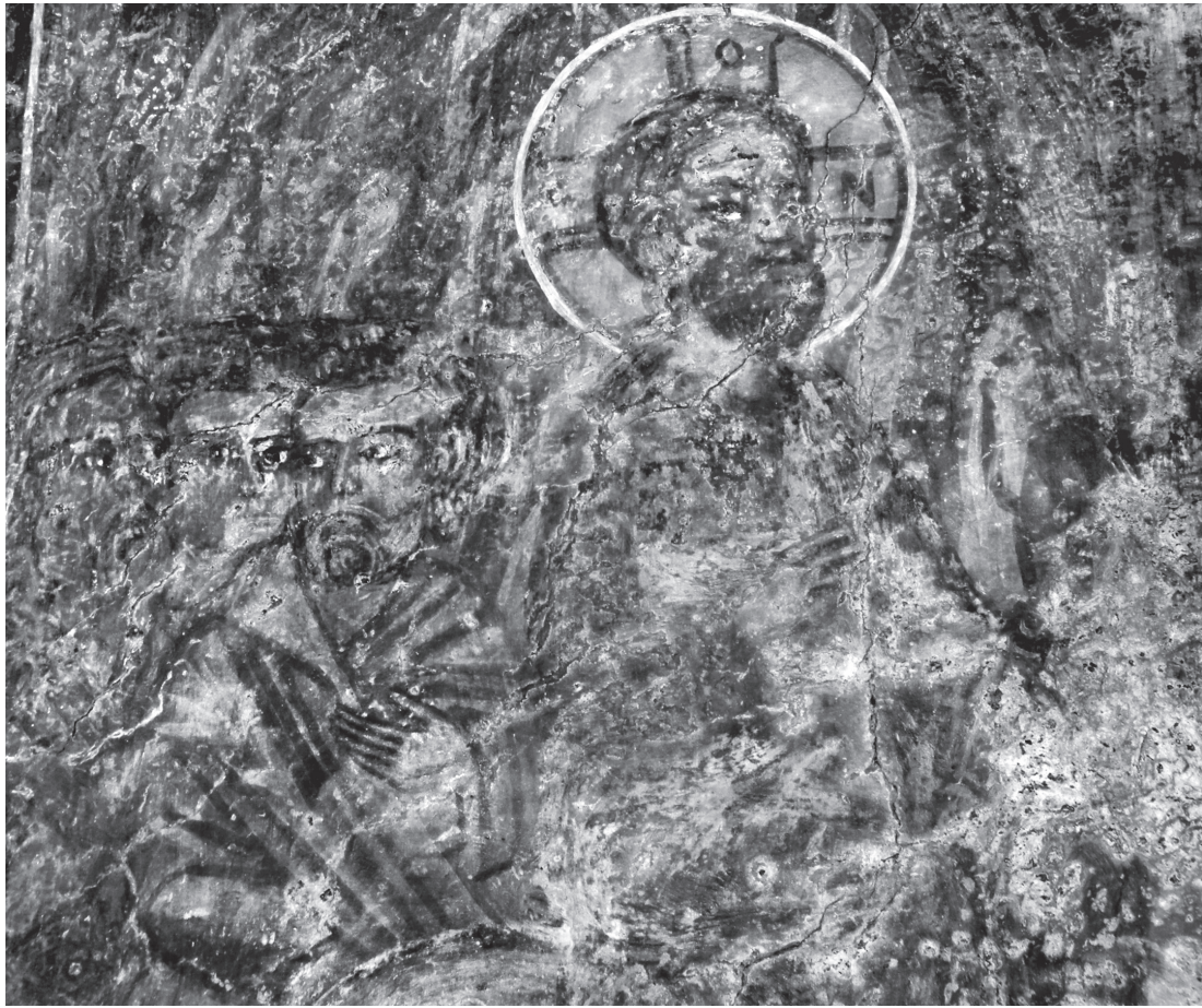
Εικ. 7. Μαριτσά, Άγιος Νικόλαος. Καμάρα. Η Βαΐοφόρος. Λεπτομέρεια.

το εύρος των φωτεινών επιπέδων να αναδεικνύεται, σε αντίθεση με τις λεπτές, σκουρόχρωμες πτυχώσεις. Το ίδιο συμβαίνει και με τον γονατιστό Αβραάμ από τη σκηνή της Θυσίας (Εικ. 2). Και στις δύο μορφές, όπως και στους σωζόμενους αποστόλους και ιεράρχες από την Κοίμηση, διακρίνονται τα κοινά υστεροπαλαιολόγια χαρακτηριστικά του όγκου, γνωστά και από άλλα μνημεία της Ρόδου, όπως η Αγία Αικατερίνη (Ίλκ Μιχράμπ) στη μεσαιωνική πόλη 49 ή η Παναγία Κυρά στο Κεραμί Σιαννών (τέλη 14ου αιώνα) 50 .