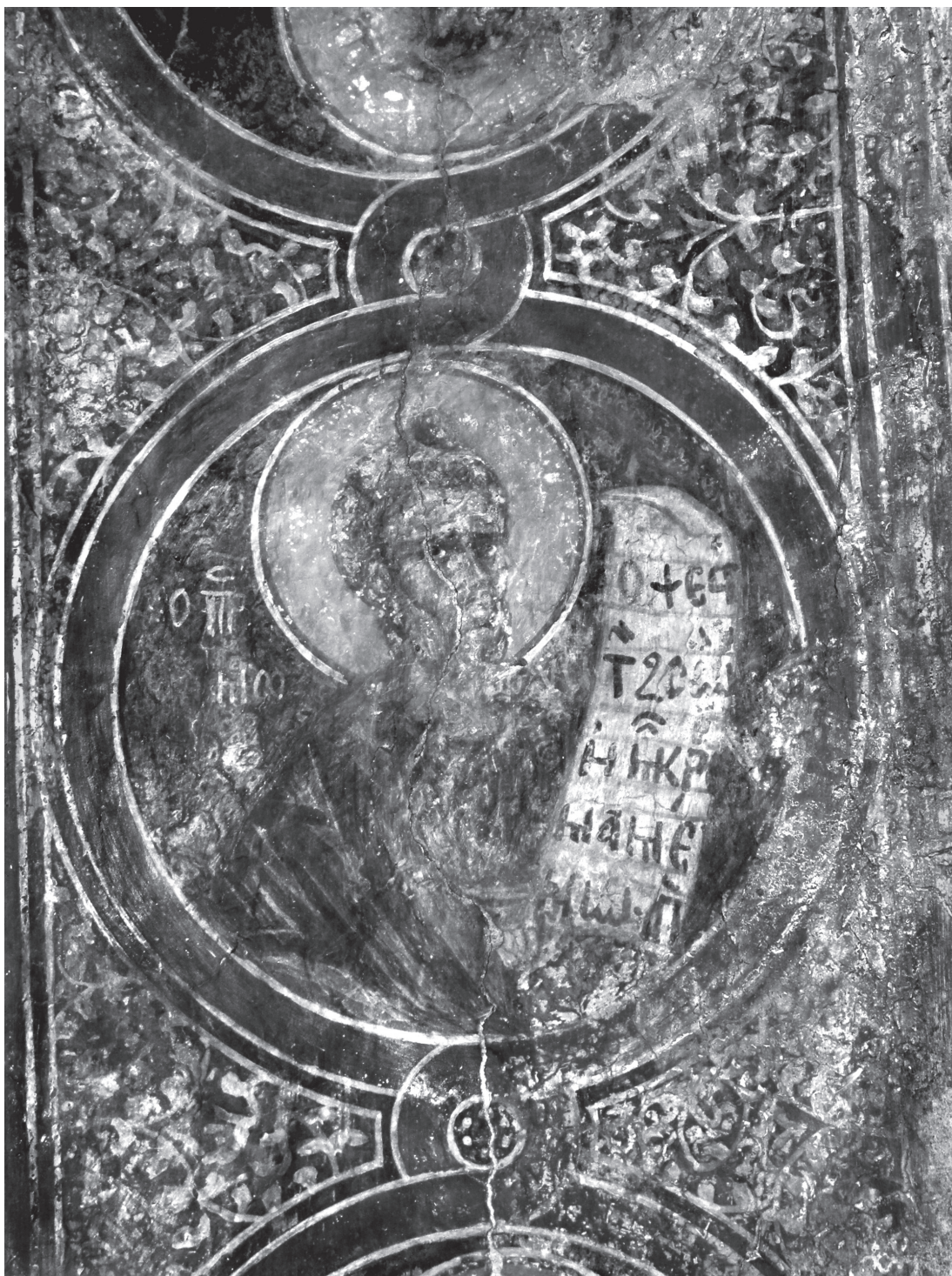
Εικ. 3. Μαριτσά, Άγιος Νικόλαος. Καμάρα, κλειδί. Ο προφήτης Μωυσής.