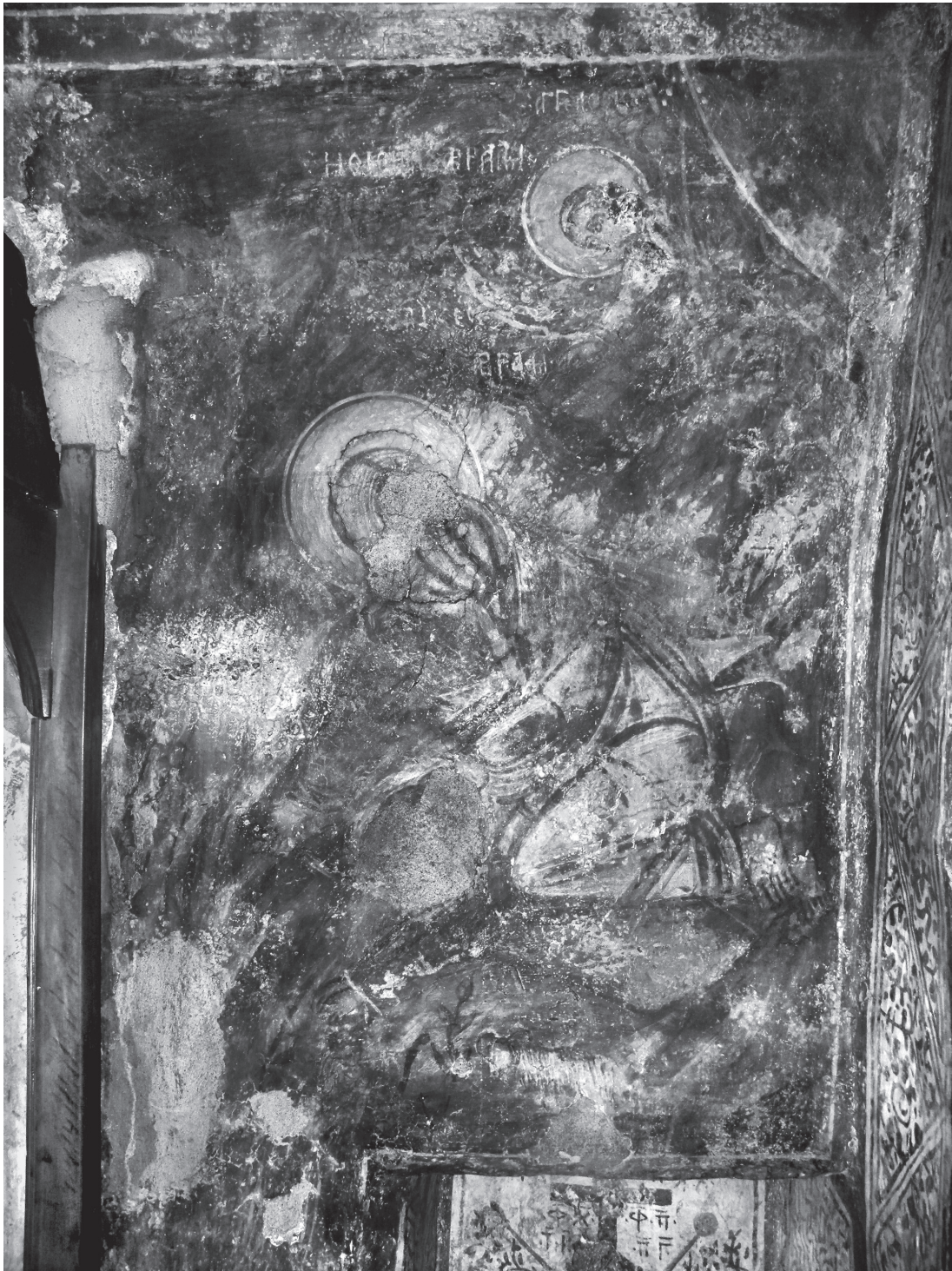
Εικ. 2. Μαριτσά, Άγιος Νικόλαος. Ιερό, βόρειος τοίχος. Η θυσία του Αβραάμ.