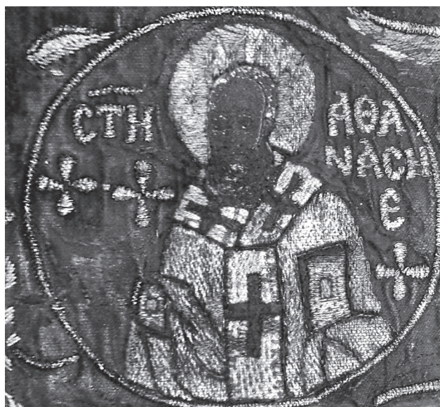
Εικ. 7. Ο άγιος Αθανάσιος σε μετάλλιο.

τώρα γνωστές πηγές θα προσπαθήσουμε να προσεγγίσουμε το θέμα της προέλευσης του επιταφίου. Σύμφωνα λοιπόν με την πρώτη υπόθεσή μας, ο μητροπολίτης Ισίδωρος θα μπορούσε να είχε αφιερώσει ο ίδιος το άμφιο στην αθωνική μονή. Παρότι δεν διαθέτουμε οποιοδήποτε ιστορικό τεκμήριο που θα επιβεβαίωνε την απευθείας δωρεά, η εύνοια που γνωρίζει αυτή την περίοδο η μονή Αγίου Παύλου μετά τις καταστροφές του 14ου αιώνα, θα μπορούσε να ενισχύουν την παραπάνω θέση. Στις αρχές λοιπόν του 14ου αιώνα, γνωρίζουμε ότι η μονή Αγίου Παύλου καταστράφηκε πιθανώς από επιδρομή Καταλανών 32 και περιέπεσε στην κατάσταση ενός κελιού εξαρτώμενου από την μονή Ξηροποτάμου 33 . Το καθεστώς αλλάζει οριστικά το 1383-1384 όταν το κελί παραχωρήθηκε στους σέρβους μοναχούς Γεράσιμο Ραδόνια (Radonja) 34 και Αντώνιο Παγάση (Bagaš) 35 , γόνους ευγενών οικογενειών με υψηλές διασυνδέσεις, και χάρη στις αδιάκοπες φροντίδες τους πήρε οριστικά πια τη θέση της ανάμεσα στα αθωνικά μοναστήρια 36 . Ο 15ος αιώνας ειδικότερα υπήρξε πολύ σημαντικός για τη μονή Αγίου Παύλου. Η εύνοια των σέρβων ηγεμόνων και ευγενών και οι ευεργετικές παρεμβάσεις των βυζαντινών αυτοκρατόρων προς αυτήν συνεχίστηκαν. Στις αρχές του 15ου αιώνα τη μονή ενίσχυσαν ο σέρβος ευγε-