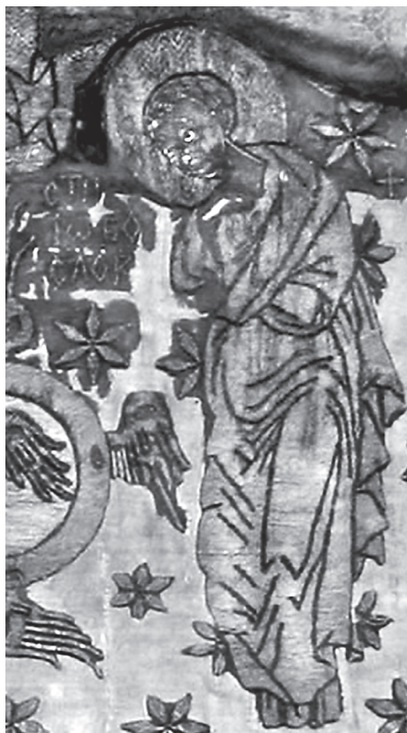
Εικ. 5. Ο άγιος Ιωάννης ο Θεολόγος.

Στην εκτέλεση των παραστάσεων και των διακοσμητικών σχεδίων κυριαρχεί το χρυσόνημα, που καλύπτει τους φωτοστέφανους, τα κοσμήματα και το μεγαλύτερο τμήμα των ενδυμάτων. Τα μεταλλικά νήματα στερεώνονται πάνω στο ολομέταξο ύφασμα με δεξιοτεχνία και απλότητα, χωρίς ιδιαίτερη ποικιλία διακοσμητικών ριζών. Από τις βελονιές κυριαρχούν οι καμάρες, που διακοσμούν, στο μεγαλύτερο τμήμα τους, τα ενδύματα, τα σύμβολα των ευαγγελιστών και ορισμένους φωτοστέφανους. Χρησιμοποιούνται οι συνδυασμοί των περισσότερων γνωστών βελονιών (ορθή και πλάγια ρίζα, καβαλίκι, ίσια-σπασμένη, κοτσάκια, καμάρες, μπακλαδωτά), που