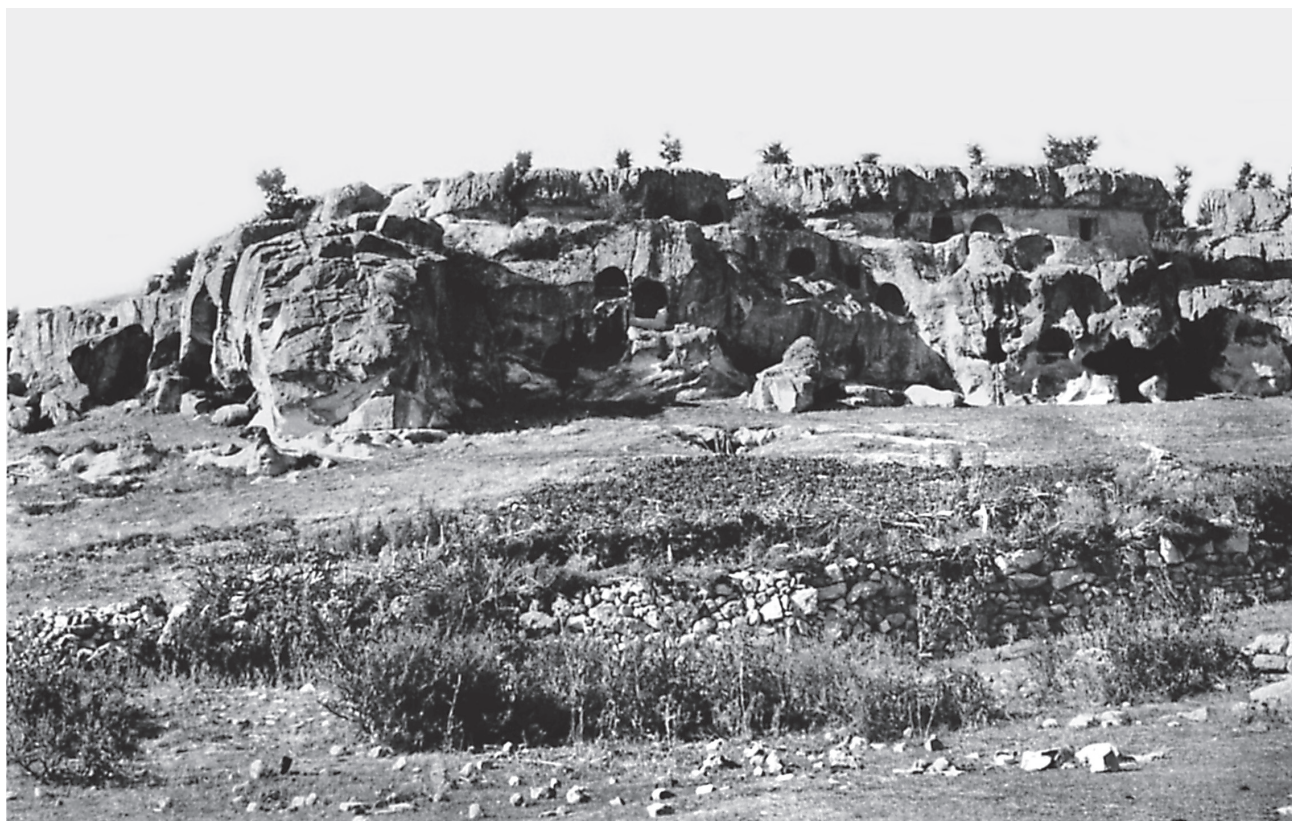
Fig. 3. Inlice, vue de la nécropole (d'après E. Haspels).

4. ΚΥΡΙΕ ΒΟΗΘΕΙ ΤΩ ΣΩ ΔΟΥΛΩ ΧΟСΝΙC CΠAΘA-POKANΔIΔATOC KAI BACIΛIKOC TAPCOY 15 , daté de la première moitié du XI e siècle.