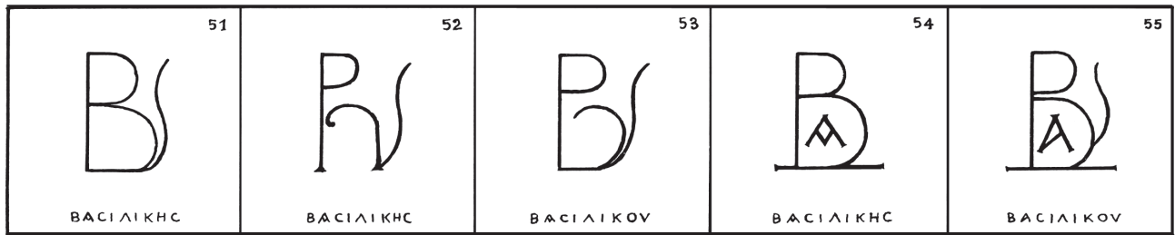
Fig. 4. Abréviations de basilikos (d'après G. Zacos et A. Veglery).

ficial of the provinces who is sometimes related to imperial kouratoreiai ».