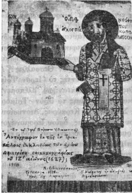
Ὁ Ἁρχιεπίσκοπος Λαρίσης Ἅγιος Νεόφυτος, ἀντιπὸς τοῦ Βησσαρίωνος

Βησσαρίωνος, ληφθεῖσα ἐκ τοιχογραφίας τοῦ ἱεροῦ Βήματος τοῦ ἐν Τρικκάλους ναοῦ τοῦ Ἁγ. Δημητρίου. Ἐν τῇ τοιχογραφίᾳ ταύτῃ, ἥτις ἀνάγεται εἰς τὸν ΙΖ' αἰῶνα, ὁ Νεόφυτος παρίσταται ὡς ἅγιος,