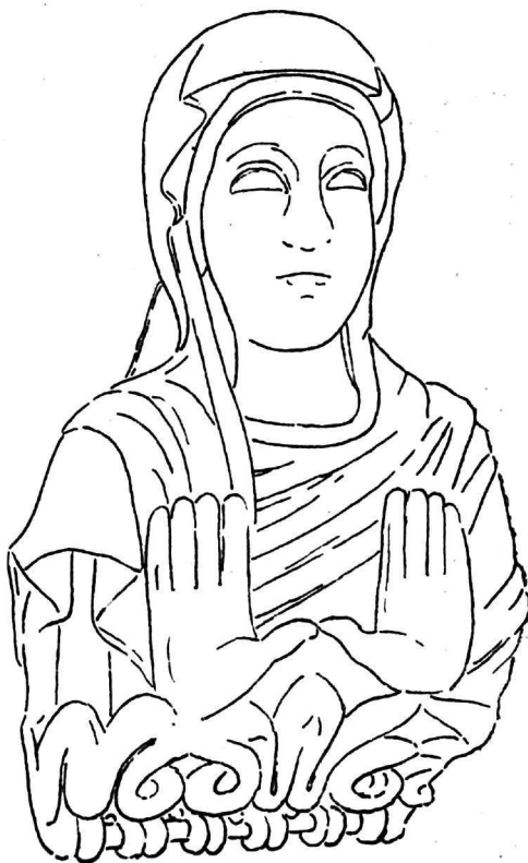
Εἰκ. 1. Ἀνάγλυφον τῆς Θεοτόκου ἐν Ἁγ. Παρασκευῇ Χαλκίδος.

Ἐπίσης ὅτι «τὸ μέγεθος τοῦ ἀναγλύφου (0,39) ἀποδεικνύει, ὅτι τοῦτο ἦτο τοποθετημένον εἰς τοι-