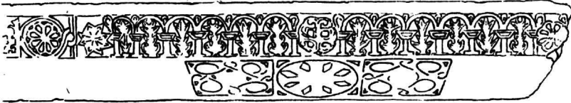
Εἰκ. 4. Ἐπιστύλιον τέμπλου ἐν Ἀγ. Παρασκευῇ Χαλκίδος.

Τὸ ἐν λόγῳ έπιστύλιον, προερχόμενον ἀσφαλῶς ἐκ τέμπλου, ὡς δεικνύει ἡ διακόσμησις τῆς κάτω πλευρᾶς αὐτοῦ, 2) φέρει ἐπὶ τῆς κυρίας