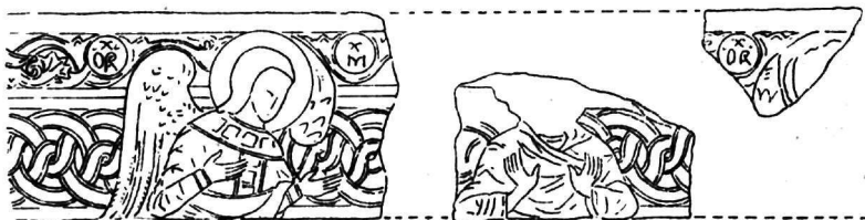
Εἰκ. 3. Τμήματα ἐκ τοῦ τέμπλου τοῦ Καθολικοῦ τῆς Μονῆς Βλαχερνῶν παρὰ τὴν Ἄρταν.

Ὅτι τοιαυτὴ διακόσμησις δὲν ἦτο ἀσυνήθης τοῦλάχιστον κατὰ τοὺς