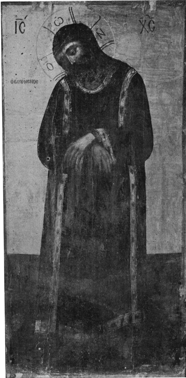
Ἡ ἐν τῷ Μητροπολιτικῷ ναῷ τῆς Μονεμβασίας ἐναποκειμένη εἰκὼν τοῦ Ἐλκομένου.