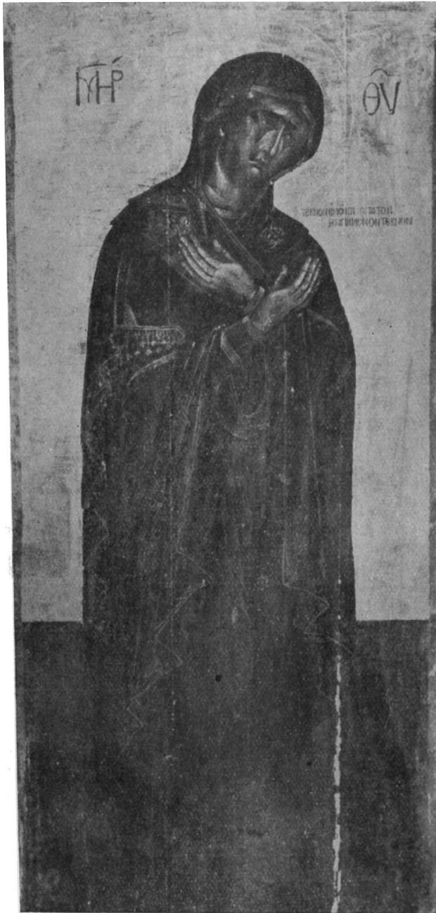
Ἡ ἐν τῷ Μητροπολιτικῷ ναῷ τῆς Μονεμβασίας ἐναποκεμένη εἰκὼν τῆς Παναγίας.