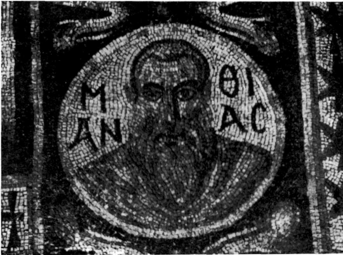
Εἰκ. 4. Μωσαϊκὸν τοῦ ναοῦ τῆς Ἁγ. Αἰκατερίνης Σινᾶ.