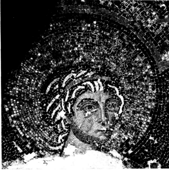
Εἰκ. 3. Κεφαλὴ ἀρχαγγέλου Μιχαήλ.