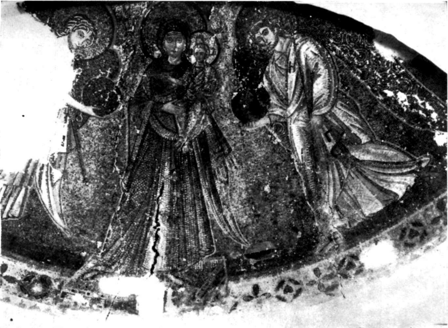
Εικ. 1. Μωσαϊκὸν τοῦ ναοῦ τῆς Ἀγγελικιτίστου Κύπρου.