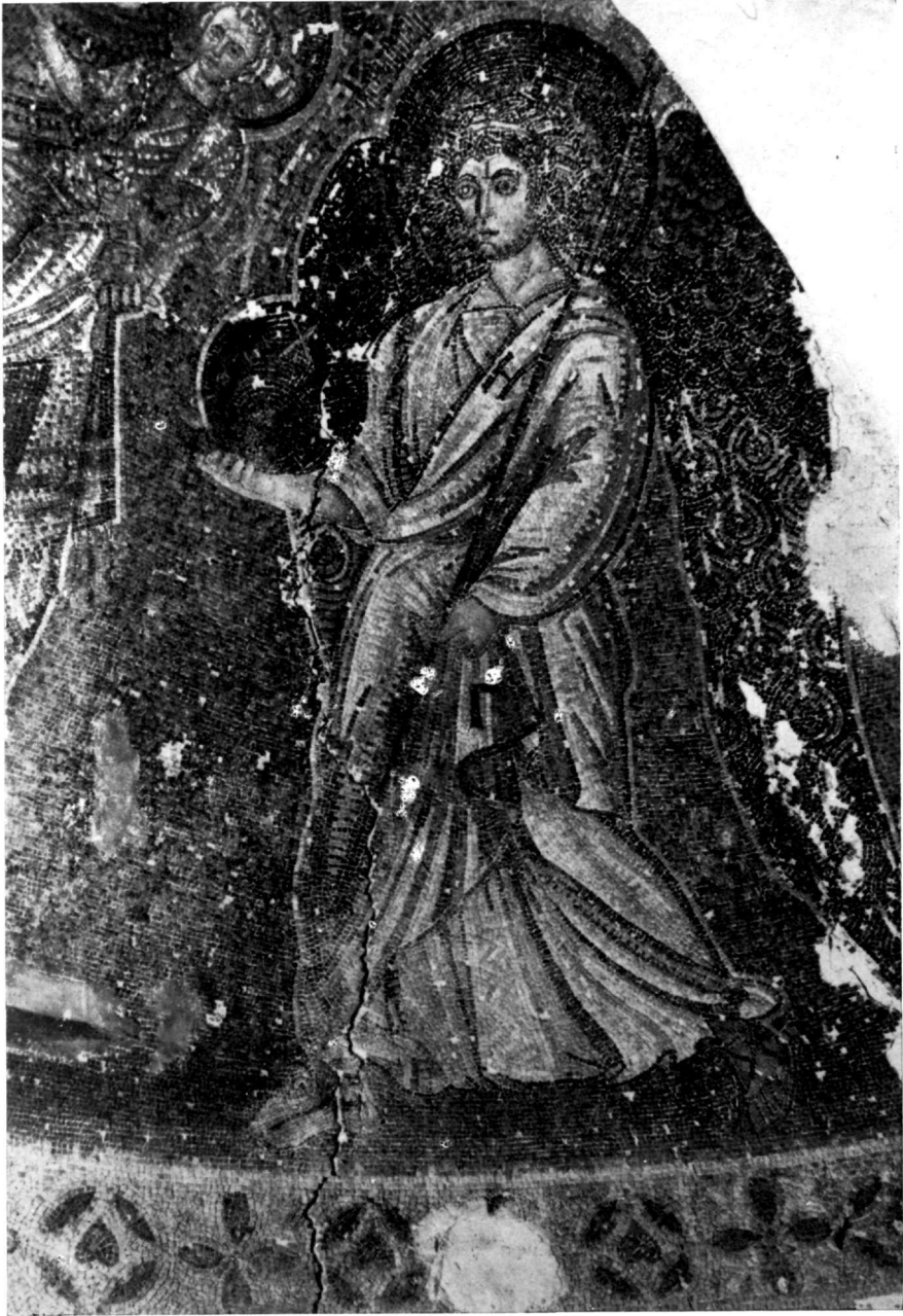
Εἰκ. 6. Ὁ ἀρχάγγελος Γαβριήλ.