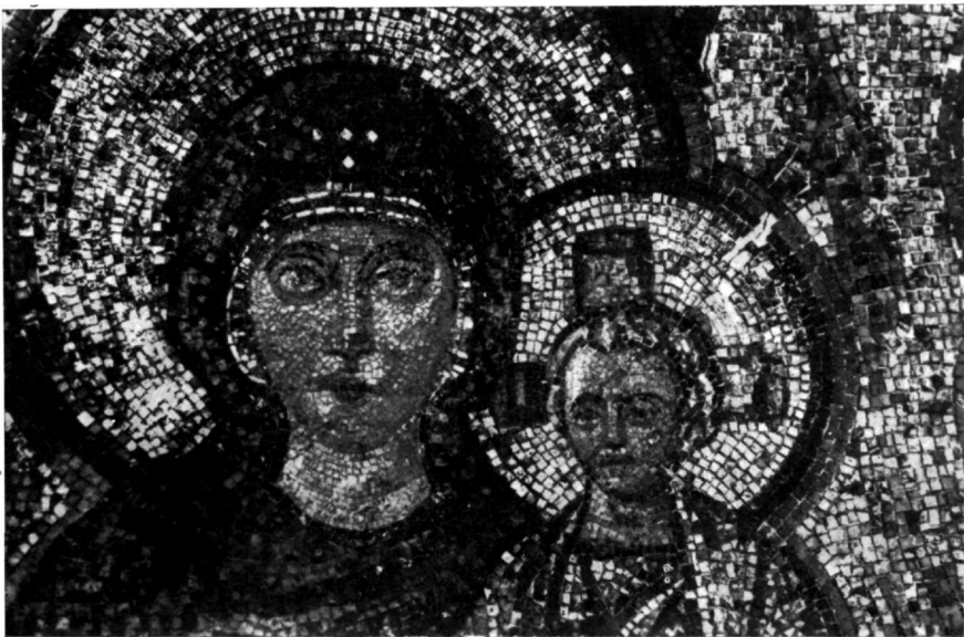
Εικ. 2. Κεφαλὴ Θεοτόκου καὶ Χριστοῦ.