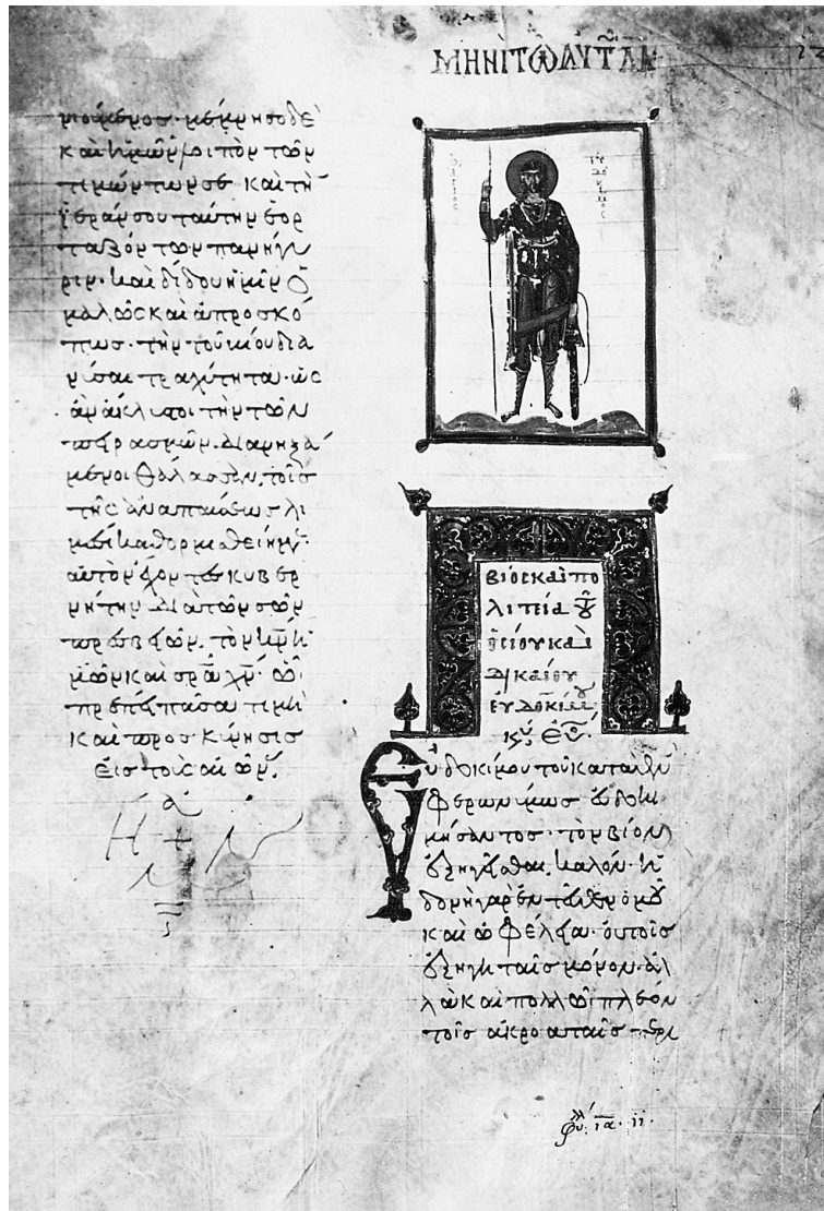
Fig. 1. Mosquensis gr. 382, fol. 125r. Saint Eudokimos an 1063 (Patterson-Ševčenko, Illustrated Manuscripts of the Metaphrastic Menologion (n. 66), 69).

d'Eudokimos déposèrent sa relique dans une église de la Vierge qu'ils ont construite à ce propos. La fondation du monastère de la Vierge Évergétis date de 1048 ou 1049. Disposant au départ de moyens restreints 61 , l'établissement augmenta par la suite son domaine foncier. Faute de renseignements suffisants il est difficile de se prononcer sur les rapports entre la fondation de l'Évergétis et l'église