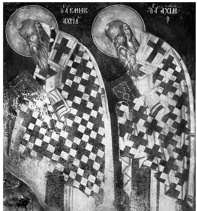
Εικ. 2. Καστοριά, ναός Αγίου Αθανασίου του Μουζάκη (1383/4). Ο άγιος Κλήμης Αχρίδας και ο άγιος Αχιλλείος.

ριακό ναό του Ευαγγελισμού της Θεοτόκου στη μονή Χιλανδαρίου Αγίου Όρους, που χρονολογείται περίπου το 1320 39 . Προφανώς πρόκειται για μια από τις παλαιότερες απεικονίσεις του αγίου στο Άγιον Όρος. Από την ύστερη περίοδο των Παλαιολόγων απεικονίσεις του αγίου γνωρίζουμε στη Βέροια, στο ναό του Αγίου Σάββα Κυριώτισσας 40 και στο ναό της Αγίας