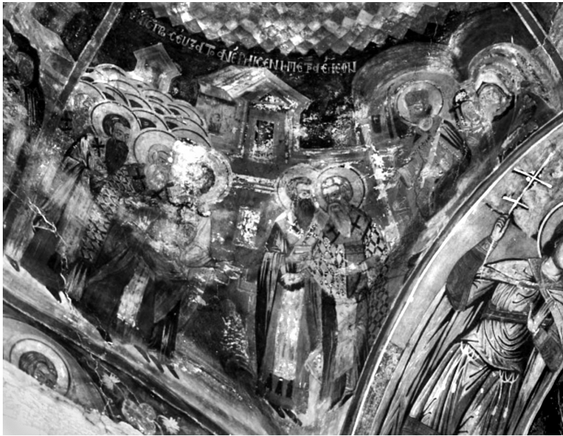
Εικ. 5. Πεντάλοφος Βοίου Κοζάνης, ναός Αγίου Αχιλλείου (1774). Ο άγιος Αχιλλείος στην Α΄ Οικουμενική Σύνοδο κατατροπώνει τον Άρειο.

επιχειρήματά του, αλλά και με το θαύμα της ανάβλυσης ελαιού από μια πέτρα (Εικ. 5). Στην άλλη παράσταση του ναού αποδίδεται η Κοίμηση του αγίου (Εικ. 6) 65 .