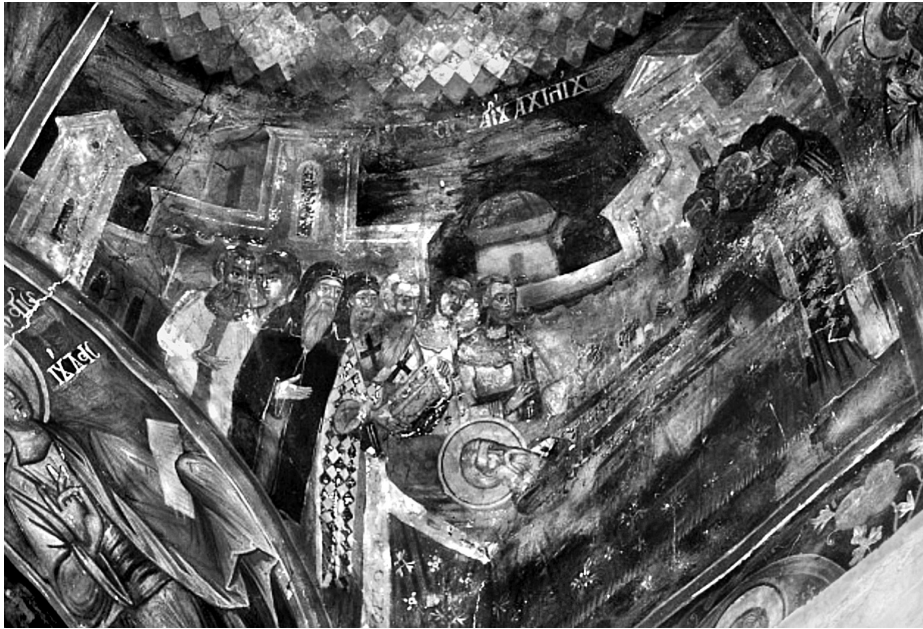
Εικ. 6. Πεντάλοφος Βοΐου Κοζάνης, ναός Αγίου Αχιλλείου (1774). Η Κοίμηση του αγίου Αχιλλείου.

αγίου Δημητρίου, στα χρόνια του αυτοκράτορα Λέοντα του Σοφού (904 μ.Χ.), η Θεσσαλονίκη είχε κατακτηθεί από Σαρακηνούς 71 . Την ίδια περίοδο χριστιανοί είχαν ξεκινήσει από την Ιταλία για να επισκεφθούν τα ιερά προσκυνηματα. Περνώντας από τα Τέμπη της Θεσσαλίας ένας γέροντας άρχισε να πορεύεται μαζί τους, ενώ, από την πλευρά της Θεσσαλονίκης καταφθάνει νεαρός καβαλάρης, ο οποίος σταμάτησε και προσφώνησε το γέροντα με σεβασμό. Ο γέροντας αντιχαιρέτισε και στην απορία του για τη θλίψη του νεαρού, αυτός του εξιστόρησε τα πάθη της πόλης του. Ο γέροντας έκλαψε μαζί του και κατόπιν εξαφανίστηκαν. Το ίδιο επεισόδιο