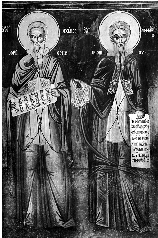
Εικ. 4. Άγιον Όρος, Τράπεζα μονής Διονυσίου ( 1602/3, αποδίδεται στο μοναχό Δανιήλ). Ο άγιος Αχιλλείος και ο άγιος Αμφιλόχιος Ικονίου.

Τέλος, αξίζει να αναφερθούμε σε έναν ακόμη ναό, ο οποίος τιμάται στο όνομα του αγίου, στον Άγιο Αχιλλείο στον Πεντάλοφο Βοΐου Κοζάνης. Στο ναό αυτό σώζονται τοιχογραφίες 60 του 1774 των Χιοναδιδών αδελφών Κωνσταντίνου και Μιχαήλ 61 . Η εργασία των ζωγράφων διακόπηκε και σύμφωνα με την παράδοση μετά από θαυματουργική επέμβαση του αγίου Αχιλλείου, οι καλλιτέχνες αναγκάστηκαν να επιστρέψουν για να ολο-