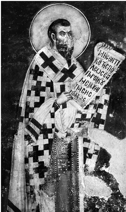
Εικ. 1. Ελασσόνα Λαρίσης, μονή Παναγίας Ολυμπιώτισσας (14ος αι.). Ο άγιος Αχιλλείος.

ριακό ναό του Ευαγγελισμού της Θεοτόκου στη μονή Χιλανδαρίου Αγίου Όρους, που χρονολογείται περίπου το 1320 39 . Προφανώς πρόκειται για μια από τις παλαιότερες απεικονίσεις του αγίου στο Άγιον Όρος. Από την ύστερη περίοδο των Παλαιολόγων απεικονίσεις του αγίου γνωρίζουμε στη Βέροια, στο ναό του Αγίου Σάββα Κυριώτισσας 40 και στο ναό της Αγίας