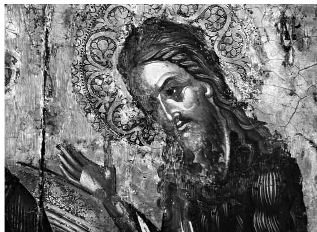
Εικ. 5. Ρόδος, Τριάντα, ναός Κοιμήσεως της Θεοτόκου. Εικόνα Δέησης, λεπτομέρεια: ο άγιος Ιωάννης ο Προδρόμος.

ΤΗ / ΔΕΞΙΑ COY 12 . Η δωρήτρια στα αριστερά του Χριστού (Εικ. 7) έχει τα δύο χέρια ενωμένα και υψωμένα μπροστά από το λαιμό της σε στάση δέησης. Φορεί λιτό μαύρο φόρεμα με στρογγυλή λαιμόκοψη και λευκή ταινιωτή απόληξη στα μανίκια, καθώς και μαύρο κεφαλόδεσμο που πέφτει δεμένος πίσω από το λαιμό της.