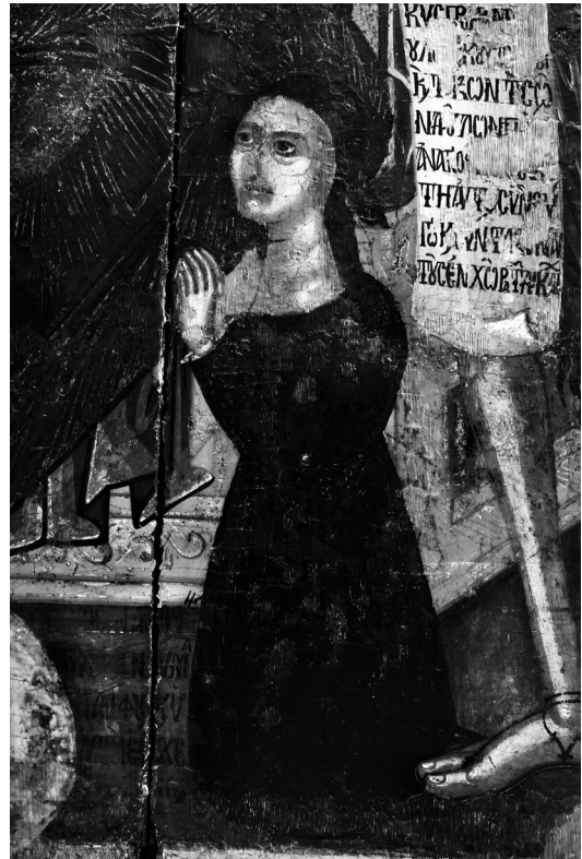
Εικ. 7. Ρόδος, Τριάντα, ναός Κοιμήσεως της Θεοτόκου. Εικόνα Δέησης, λεπτομέρεια: η αφιερώτρια.

όπου αυτός εικονίζεται κατά μόνας, όπως οι εικόνες από τον Χριστό Αντιφωνητή στην Καλογραία, το ναό του Αρχαγγέλου στη Χάρτζια ή την Παναγία Φανερωμένη στη Λευκωσία (εικόνες α' μισού 16ου αι.) 18 . Στις συνάφειες συγκαταλέγονται ο πανομοιότυπος φυσιογνωμικός τύπος του Χριστού, το χρυσό βάθος και το πράσινο του εδάφους, ομοιότητες των ανοικτών βιβλίων, εξαιρουμένων των κειμένων που αναγράφονται σε αυτά, το σχήμα και ο διάκοσμος του θρόνου, ο τύπος των μαξιλαριών και του υποποδίου, αλλά και η διάτα-