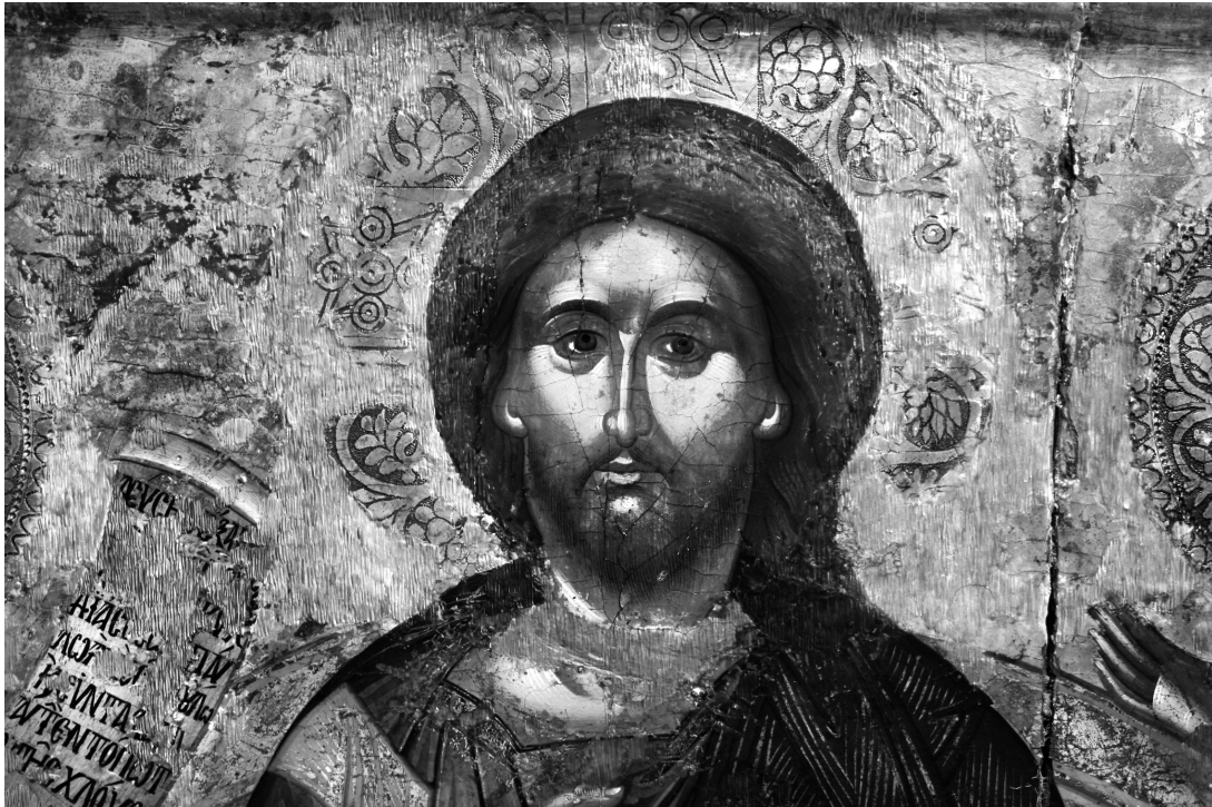
Εικ. 3. Ρόδος, Τριάντα, ναός Κοιμήσεως της Θεοτόκου. Εικόνα Δέησης, λεπτομέρεια: ο Χριστός.

ΤΗΣ ΧΛΟΥΣ 10 . Πάνω από το ειλητό σώζονται ίχνη του θεοτοκωνυμίου Μ(ΗΤΗ)Ρ Θ(ΕΟ)Υ.