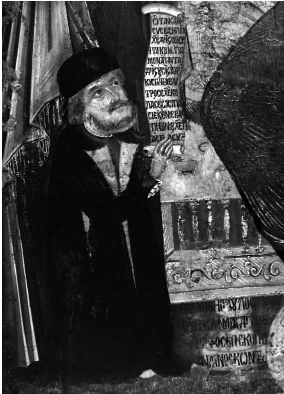
Εικ. 6. Ρόδος, Τριάντα, ναός Κοιμήσεως της Θεοτόκου. Εικόνα Δέησης, λεπτομέρεια: ο κεκοιμημένος Παύλος.