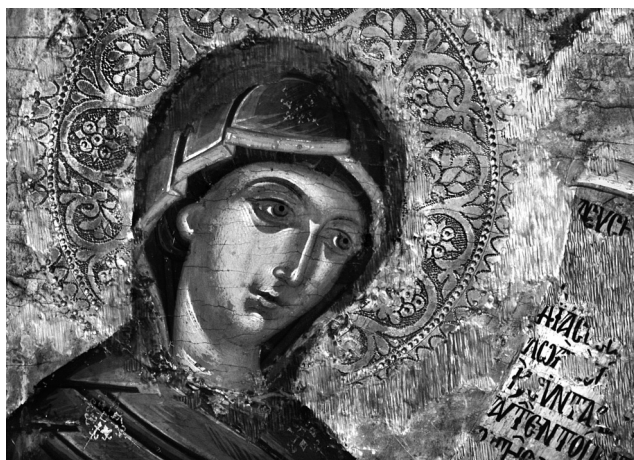
Εικ. 4. Ρόδος, Τριάντα, ναός Κοιμήσεως της Θεοτόκου. Εικόνα Δέησης, λεπτομέρεια: η Παναγία.