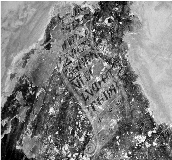
Εικ. 4. Balldren, ναός Αγίας Παρασκευής. Αψίδα ιερού, εκδιπλωμένο ειλητάριο με λατινική επιγραφή, πρώτο στρώμα (λεπτομέρεια της Εικ. 3).

ανοιχτό ειλητάριο στον Πέτρο, ενώ αντίστοιχο ειλητάριο κρατεί ο Παύλος (στο ίδιο, εικ. 375). γ. Στο κεντρικό τμήμα του πολυπύχου αριθ. 47 του Duccio (Σιένα, Pinacoteca Nazionale), όπου ο ευλογών