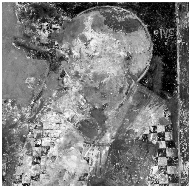
Εικ. 17. Balltren, ναός Αγίας Παρασκευής. Βόρεια πλευρά ανατολικού τοίχου, ο Άγιος Ελευθέριος (:), δεύτερο στρώμα (λεπτομέρεια της Εικ. 2).