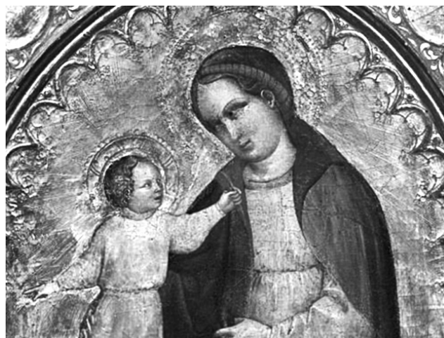
Εικ. 10. Jacobello del Fiore, Madonna del'Humilita. Ιδιωτική συλλογή.

Παρά την κακή κατάσταση του πρώτου ζωγραφικού στρώματος στο Ballgren, είναι δυνατόν να εξαχθούν με σχετική ασφάλεια ορισμένα συμπεράσματα. Βασιζόμενοι στις δύο καλύτερα σωζόμενες μορφές, συγκεκριμένα το σεραφεΐμ της βόρειας γωνίας του αετώματος του ανατολικού τοίχου (Εικ. 9) και τον έναν από τους επισκόπους του βόρειου τμήματος του ημικυλίνδρου (Εικ. 7), παρατηρούμε όμοιο τρόπο πλασίματος, με λαδοπράσινο προπλασμό και καστανή ώχρα για τα σαρκώματα και τους φωτοστεφάνους· η κόμη αποδίδεται με θερμούς καστανούς τόνους. Ο ρόλος του χρώματος είναι κυρίαρχος έναντι της γραμμής, τα περιγράμματα δεν τονίζονται ιδιαίτερα, η μετάβαση από τις σκιερές στις φωτισμένες επιφάνειες πραγματοποιείται δίχως οξύτητα. Εντούτοις, η απόδοση των λεπτομερειών του προσώπου εμφανίζεται αρκετά διαφορετική στις δύο μορφές. Στους χαρακτηριστικούς αμυγδαλόσχημους οφθαλμούς, στα σαρκώδη χείλη, στη μορφή της κόμης του αγγέλου-σεραφεΐμ συνδυάζεται ο νατουραλισμός με μια εκλέπτυνση, αισθητικό γνώρισμα που παραπέμπει στην υστερογοτθική ζωγραφική της βόρειας Ιταλίας. Ενδεικτικές είναι οι μορφές στο έργο του Βενετού ζωγράφου Jacobello del Fiore (περ. 1370-1439), όπως για παράδειγμα στον πίνακα με την Παναγία και το μικρό Ιησού, απεικόνιση γνωστή ως «Παναγία της Ταπεινότητας» ( Madonna del'Humilita )