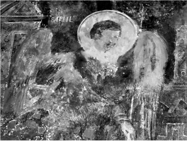
Εικ. 16. Balldren , ναός Αγίας Παρασκευής. Βόρειο τμήμα μετώπου αψίδας, ο αρχάγγελος Γαβριήλ του Ευαγγελισμού, δεύτερο στρώμα (λεπτομέρεια της Εικ. 2).

ως απολήξεις. Οι πύργοι, και στα δύο μέρη της σύνθεσης, είναι χαρακτηριστικά στραμμένοι προς το κέντρο, πλαισιώνοντας αντίστοιχα τον αρχάγγελο και τη Θεοτόκο. Δύο επάλληλες ζώνες με γραπτό διάκοσμο με πλοχμούς παρεμβάλλονται μεταξύ των δύο ιερών προσώπων, καταλαμβάνοντας το μέτωπο του θριαμβικού τόξου.