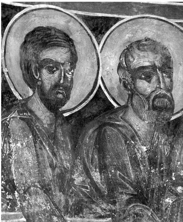
Εικ. 15. Balldren, ναός Αγίας Παρασκευής. Ημικύλινδρος αφίδαας ιερού, βόρειο τμήμα, οι απόστολοι από το Μυστικό Δείπνο, δεύτερο στρώμα (λεπτομέρεια της Εικ. 14).

εμπρόσθια πλευρά του τραπεζιού και περιτρέχει τον ημικύλινδρο 41 . Αμέσως πιο κάτω, στενή ερυθρή ταινία βαίνει παράλληλα με την απόληξη του καλύμματος του τραπεζιού. Με τον τρόπο αυτό, το τραπεζοκάλυμμα λειτουργεί ως μια οιονεί διακοσμητική ζώνη και ως κρηπίδα της σύνθεσης του Μυστικού Δείπνου, διαχωρίζοντάς