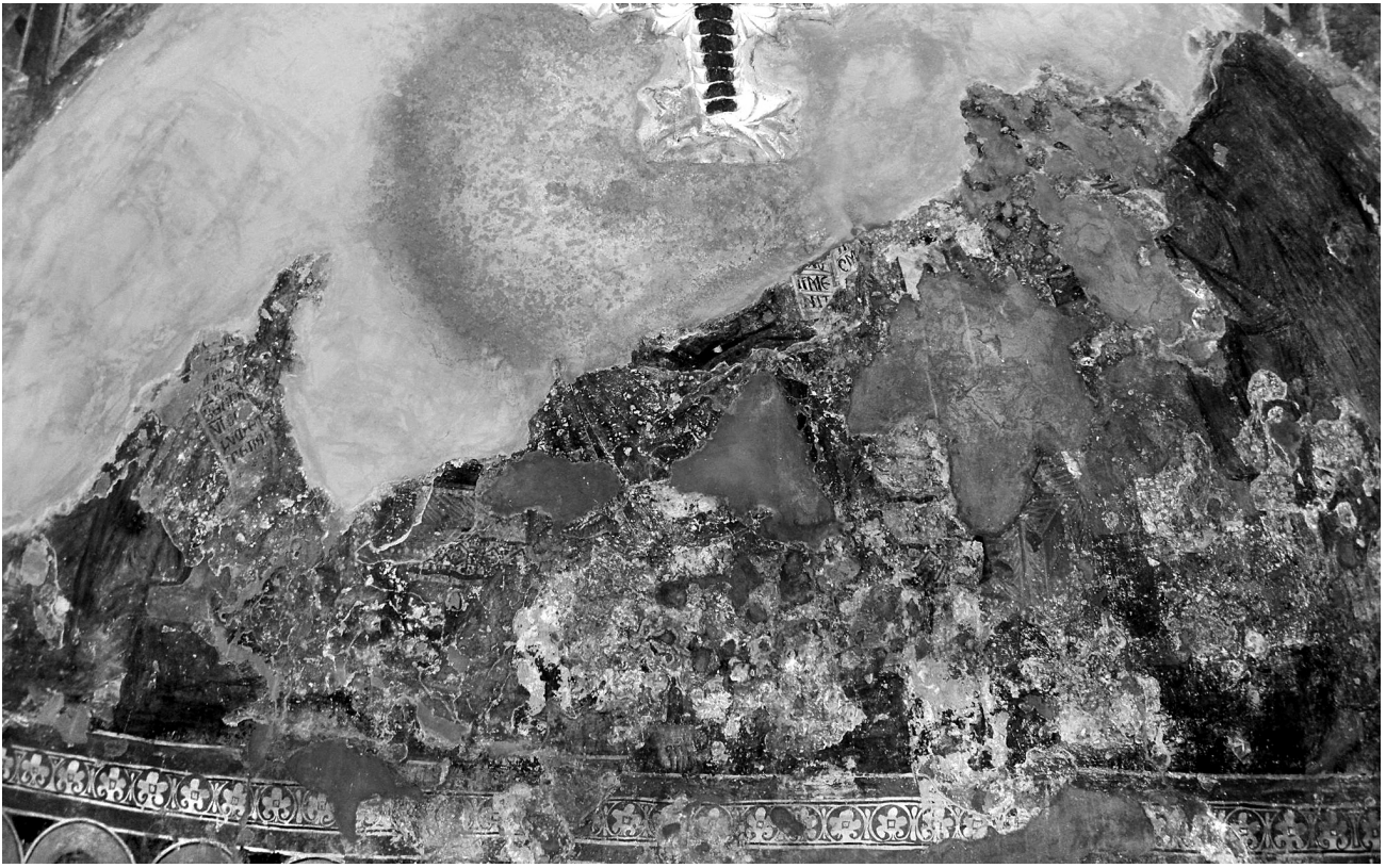
Εικ. 3. Balldren, ναός Αγίας Παρασκευής. Το τεταρτοσφαιρίο της αψίδας του ιερού με τα δύο στρώματα τοιχογραφιών.