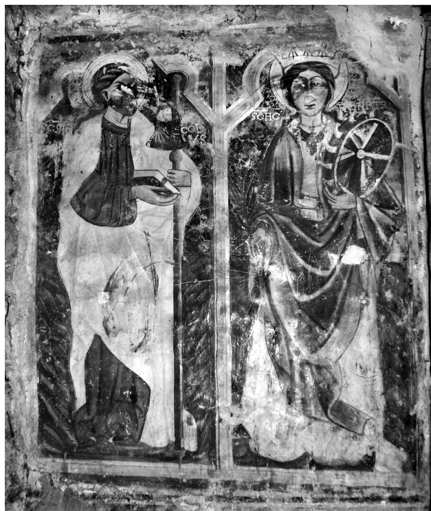
Εικ. 11. Planë, ναός Αγίας Βαρβάρας (Shën Barbulla). Δυτικός τοίχος, ο άγιος Ιάκωβος και η αγία Αικατερίνη, πρώτο στρώμα, περ. 1400.

χιο αποτελούσαν το 15ο αιώνα έδρες λατινικών αρχιεπισκοπών.