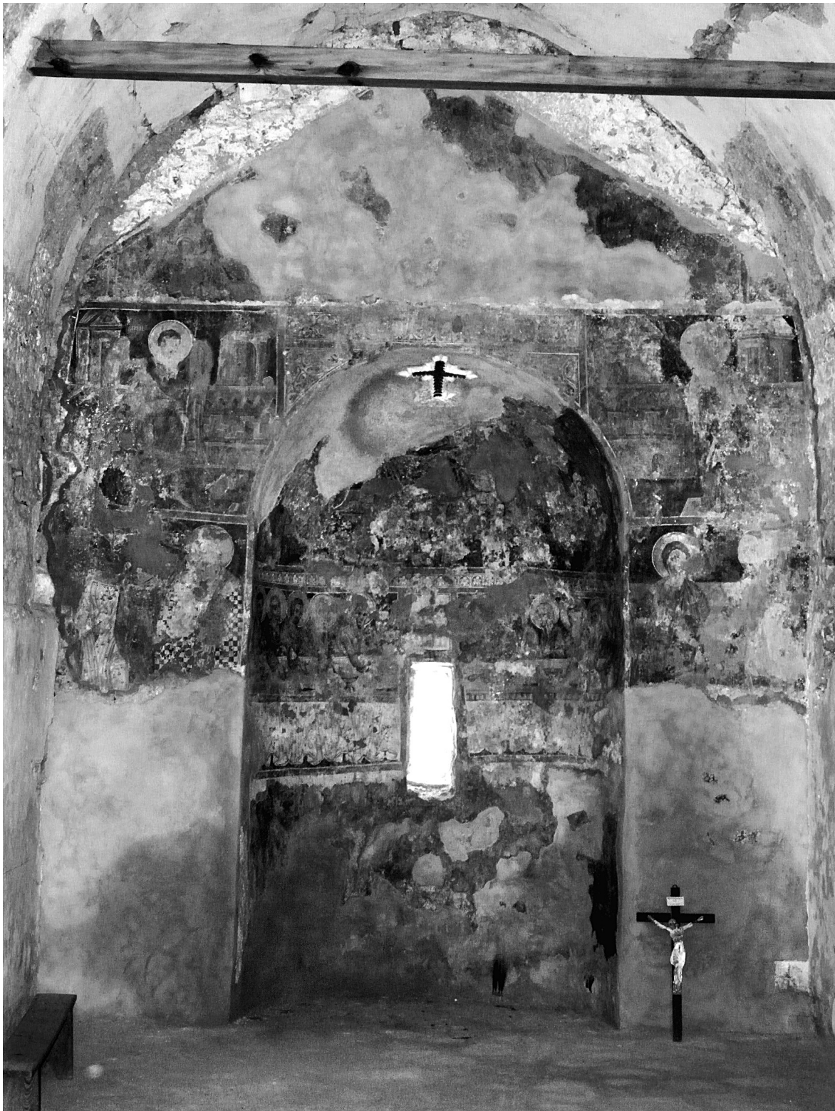
Εικ. 2. Balldren, ναός Αγίας Παρασκευής. Γενική άποψη του ανατολικού τείχους.