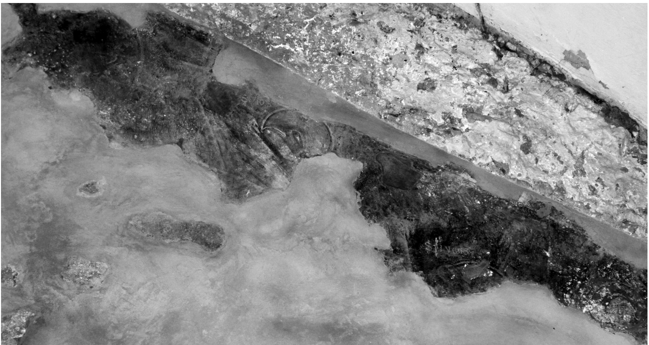
Εικ. 6. Balldren, ναός Αγίας Παρασκευής. Νότια πλευρά της αετωματικής απόληξης του μετώπου της αψίδας, αποκαλυπτικός Χριστός εν δόξη ( Majestas Domini ) με τα σύμβολα των ευαγγελιστών Ιωάννη και Λουκά και απεικόνιση εξαπτέρυγου, πρώτο στρώμα.