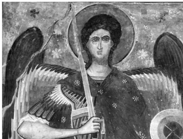
Εικ. 19. Planë, ναός Αγίας Βαρθάρας. Δυτικός εξωτερικός τοίχος, Αρχάγγελος Μιχαήλ, δεύτερο στρώμα (λεπτομέρεια).

στο Balltren, όπως τουλάχιστον μπορούμε να συμπεράνουμε από τις καλά σωζόμενες μορφές στο Μυστικό Δείτνο (Εικ. 15), βρίσκουμε σημαίνουσες αναλογίες με τοιχογραφίες από το χώρο της μεζονος Μακεδονίας. Ενδεικτικά αναφέρουμε τη ζωγραφική της πρόσοψης του ναού του Αγίου Νικολάου του Πτωχοκομείου (Bolnicki) στην Αχρίδα (1480/1) 48 , καθώς και την πρώτη φάση του διακόσμου του Αγίου Νικολάου της Γούρνας και του Αγίου Παταπίου στη Βέροια, τοιχογραφίες που χρονολογούνται από τον Θ. Παπαζώτο στις αρχές του 16ου αιώνα και αποδίδονται στο ίδιο εργαστήρι 49 . Η απουσία προχωρημένης σχηματοποίησης στο διάκοσμο του αλβανικού μνημείου μάς κάνει επιφυλακτικούς ως προς μια όψιμη χρονολόγησή του, δηλαδή στον ύστερο 16ο αιώνα. Με τα δεδομένα αυτά και λαμβάνοντας, επίσης, υπόψη την εξαιρετικά τεταμένη κατάσταση που επικρατεί στη βόρεια και κεντρική Αλβανία στα τέλη του 15ου αιώνα, θεωρούμε ως πιθανότατη τη χρονολόγηση