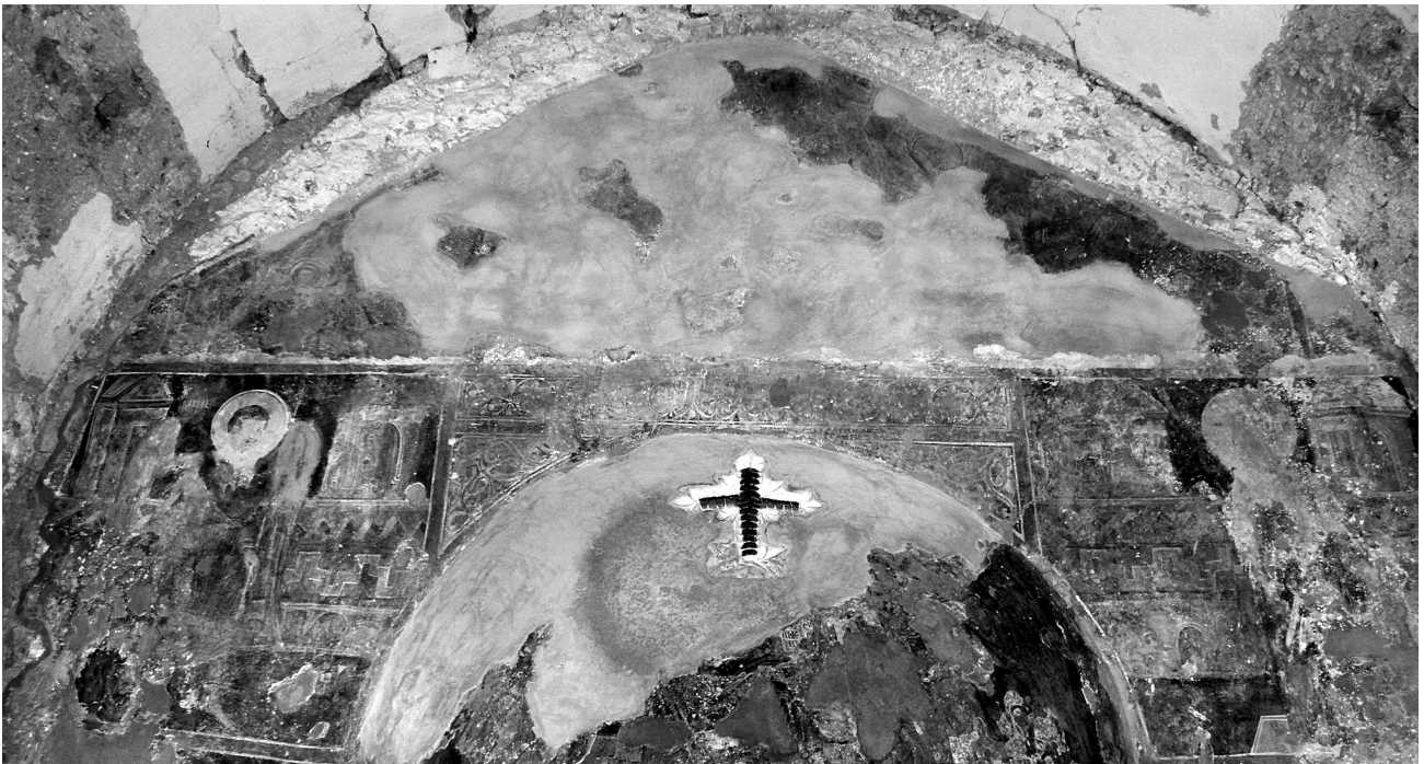
Εικ. 5. Balldren, ναός Αγίας Παρασκευής. Μέτωπο της αψίδας.