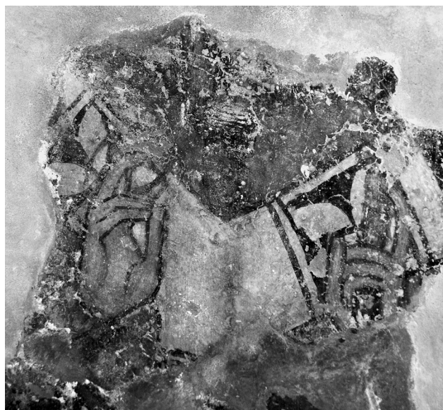
Εικ. 8. Balldren, ναός Αγίας Παρασκευής. Αψίδα ιερού, τμήμα ιεράρχη με λατινική λειτουργική αμφίεση, πρώτο στρώμα-δεύτερη φάση.

Στο βόρειο ήμισυ του ημικυλίνδρου της αψίδας απεικονίζονται κατά μέτωπο δύο επίσκοποι με φωτοστέφανο, από τους οποίους ο καλύτερα σωζόμενος είναι αυτός στα δεξιά (Εικ. 7). Έχει καστανή κόμη και γενειάδα, φέρει άμφια και λατινική μίτρα και ευλογεί με το δεξί χέρι, ενώ με το αριστερό προφανώς κρατούσε, λατινικού επίσης τύπου, ποιμαντορική ράβδο, όπως κρατεί ο ιεράρχης στα αριστερά του. Σταυρός σε μορφή τετράφυλλου ρόδακα κοσμεί το ωμοφόριό του. Απεικονίζεις μετωπικών επισκόπων με ανάλογη λατινική ιερατική αμφίεση συναντούμε και στο ναό του Σωτήρος (Shëlbluemi) στο Ρουμπίκ (Rubik) της Μιρδιτίας (Mirdita), όχι πολύ μακριά από το Balldren 25 . Στην ίδια φάση εντάσσεται, κατά πάσα πιθανότητα, αταύτιστη μορφή κάτω από το παράθυρο της κόγχης, εντός διαχώρου