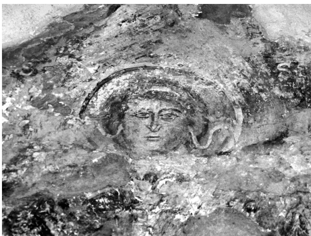
Εικ. 9. Ballgren, ναός Αγίας Παρασκευής. Βόρεια απόληξη της αετωματικής απόληξης του μετώπου της αψίδας, εξαπτέρυγο, πρώτο στρώμα.