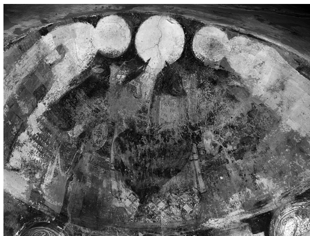
Εικ. 13. Rubik, ναός Σωτήρος (Shëlbluemi). Αφίδα ιερού, η Δέηση, πρώτο στρώμα, περ. 1160-1170.

Η επιλογή της Δέησης για την αφίδα έχει παλαιοχριστιανική καταγωγή και απαντάται σταθερά, αν και όχι πολύ συχνά, σε όλη τη βυζαντινή περίοδο, σχετιζόμενη