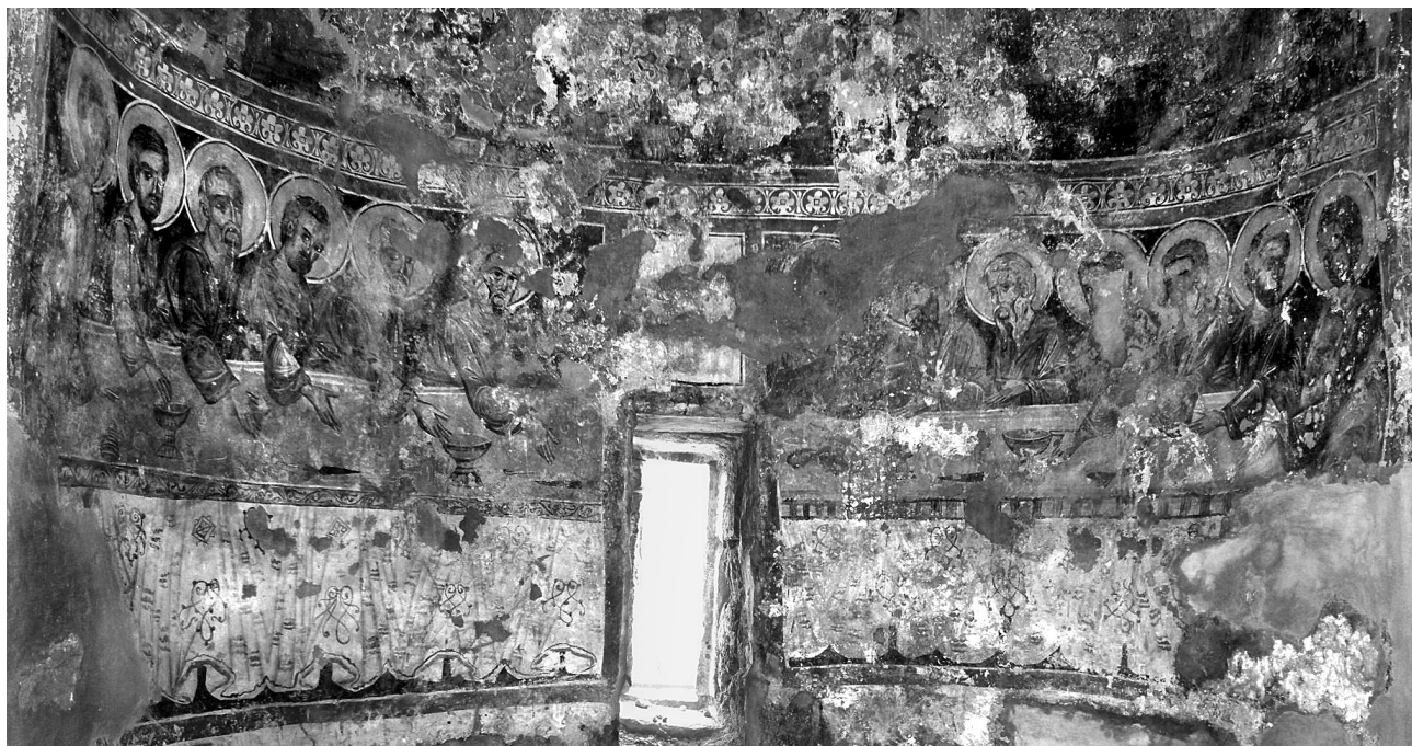
Εικ. 14. Ballren , ναός Αγίας Παρασκευής. Ημικύλινδρος αψίδας ιερού, ο Μυστικός Δείπνος, δεύτερο στρώμα.

Απόκρρω (Ματθ. 25,31-46). Το παραπάνω απόσπασμα συνοδεύει και την τοιχογραφία της Δέησης του παλαιού καθολικού του Μεγάλου Μετεώρου (1483) 38 . Ας σημειωθεί, πάντως, ότι στις μεταβυζαντινές απεικονίσεις της τριμορφης Δέησης αναγράφεται συνήθως στο ανοιχτό Ευαγγέλιο ο στίχος η΄, 12 από το κατά Ιωάννην (έγω είμι τὸ φῶς τοῦ κόσμου...) 39 .