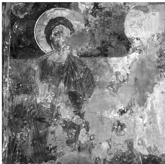
Εικ. 18. Balltren, ναός Αγίας Παρασκευής. Νότια πλευρά ανατολικού τοίχου, ο Χριστός και αδιάγνωστος άγιος, δεύτερο στρώμα (λεπτομέρεια της Εικ. 2).

στο Balltren, όπως τουλάχιστον μπορούμε να συμπεράνουμε από τις καλά σωζόμενες μορφές στο Μυστικό Δείτνο (Εικ. 15), βρίσκουμε σημαίνουσες αναλογίες με τοιχογραφίες από το χώρο της μεζονος Μακεδονίας. Ενδεικτικά αναφέρουμε τη ζωγραφική της πρόσοψης του ναού του Αγίου Νικολάου του Πτωχοκομείου (Bolnicki) στην Αχρίδα (1480/1) 48 , καθώς και την πρώτη φάση του διακόσμου του Αγίου Νικολάου της Γούρνας και του Αγίου Παταπίου στη Βέροια, τοιχογραφίες που χρονολογούνται από τον Θ. Παπαζώτο στις αρχές του 16ου αιώνα και αποδίδονται στο ίδιο εργαστήρι 49 . Η απουσία προχωρημένης σχηματοποίησης στο διάκοσμο του αλβανικού μνημείου μάς κάνει επιφυλακτικούς ως προς μια όψιμη χρονολόγησή του, δηλαδή στον ύστερο 16ο αιώνα. Με τα δεδομένα αυτά και λαμβάνοντας, επίσης, υπόψη την εξαιρετικά τεταμένη κατάσταση που επικρατεί στη βόρεια και κεντρική Αλβανία στα τέλη του 15ου αιώνα, θεωρούμε ως πιθανότατη τη χρονολόγηση