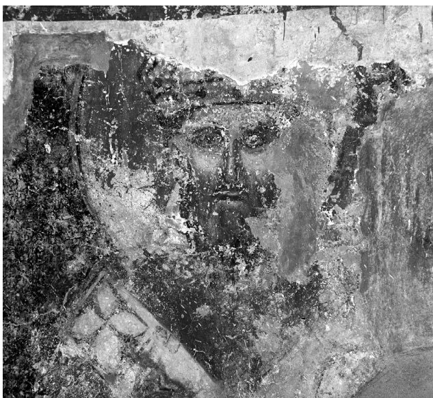
Εικ. 7. Balldren, ναός Αγίας Παρασκευής. Αψίδα ιερού, ιεράρχης με λατινική λειτουργική αμφίεση, πρώτο στρώμα.

στην παράσταση του αποκαλυπτικού Χριστού στο χειρόγραφο από το Darmstadt, στον πίνακα της Στουτγάρδης, καθώς και στην εικόνα της Βενετίας – ίσως και στα κερκυραϊκά μνημεία, όπου όμως δεν σώζεται ο αετός –, και είναι η πλέον συνήθης.