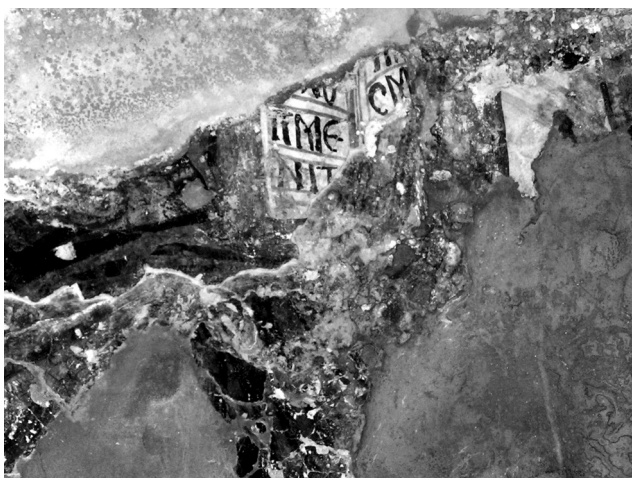
Εικ. 12. Balldren, ναός Αγίας Παρασκευής. Τεταρτοσφάιριο αφίδας ιερού, σπάραγμα από απεικόνιση έnthρονου Χριστού με ανοιχτό ευαγγέλιο με ελληνική επιγραφή, δεύτερο στρώμα (λεπτομέρεια της Εικ. 3).

[...ΕΥΛ]Ο/ΓΙΜΕ/ΝΙ Τ/[ΟΥ ΠΑΤΡΟ]/C Μ[ΟΥ] 33 (Εικ. 12). Διακρίνονται, επίσης, σπαράγματα από τον καστανέρυθρου χρώματος μαργαριτοκόσμητο θρόνο. Στην ίδια σύνθεση, αριστερά, σώζεται το κάτω μέρος ενδύματος – βαθύς κυανός χιτώνας και ερυθρωπό μάτιο – από γυναικεία μορφή, που προφανώς ταυτίζεται με τη Θεοτόκο δεομένη δεν διακρίνεται, πάντως, αν κρατούσε ειλητάριο, άρα αν ακολουθούσε τον τύπο της Παράκλησης 34 . Δεξιά, σώζεται σπάραγμα βαθυκάστανου ματιού και καστανέρυθρου χιτώνα από ανδρική μορφή, επίσης σε στάση τριών τετάρτων η τελευταία ταυτίζεται με ασφάλεια με τον Πρόδρομο 35 .