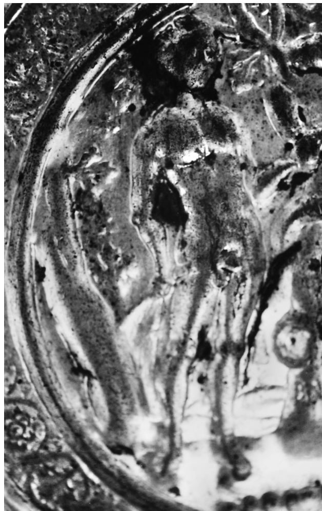
Fig. 4. Plat à offrande inédit du monastère de Docheiariou, au Mont Athos. La Tentation, Adam (détail).

fut de représenter les primi parentes du même côté de l'arbre, Ève étant toujours plus proche de celui-ci. La composition la plus répandue plaçait l'arbre entre Adam et Ève, comme on l'avait déjà fait, dès la fin du IIIe siècle ou le début du IVe siècle 8 . Il serait réducteur de penser que cette position de part et d'autre de l'arbre, répondait simplement au désir de symétrie de l'art roman 9 , car la forme est