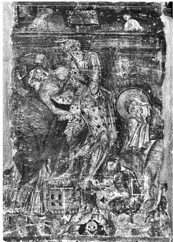
Εικ. 4. Βέροια, ναός Μεγάλου Θεολόγου. Η Αποκαθήλωσις.