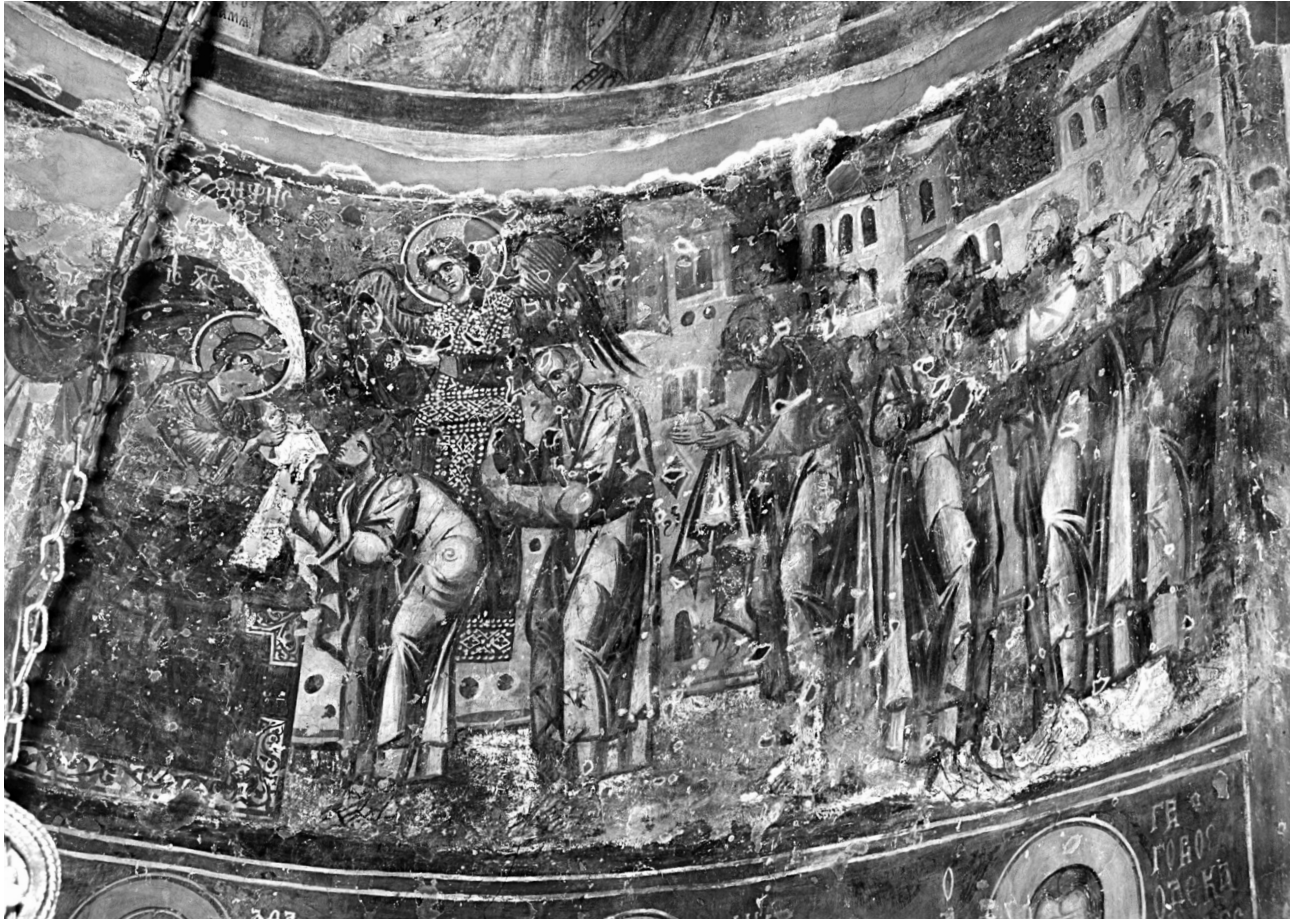
Εικ. 6. Αχρίδα, Κανέο, ναός Αγίου Ιωάννη Θεολόγου. Η Κοινωνία των αποστόλων.

Στην Ανάληψη οι άγγελοι αποδίδονται με μεγάλους μανδύες που πλαισιώνονται με μαργαριτάρια, ενώ οι χιτώνες έχουν διακοσμημένες παρυφές. Με την ενδυμασία αυτή ο ζωγράφος προσδίδει όγκο στις μορφές 36 .