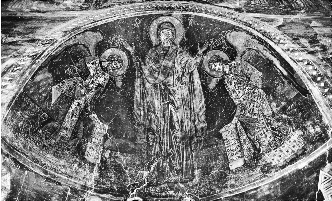
Εικ. 2. Βέροια, ναός Μεγάλου Θεολόγου. Η Θεοτόκος εν μέσω των αγγέλων.