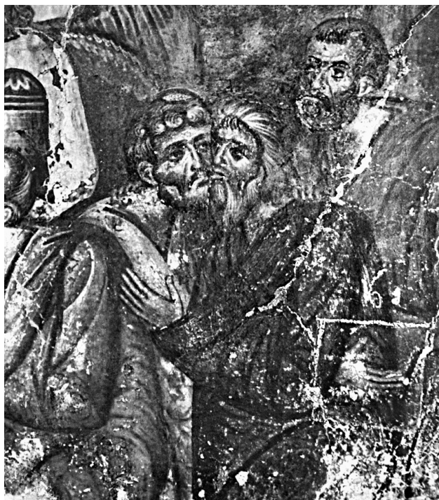
Εικ. 10. Ασπασμός δύο αποστόλων (λεπτομέρεια της Εικ. 5).

Πνεύματος, το οποίο εξέρχεται από ημικυκλική πηγή φωτός, δηλαδή τον Θεό Πατέρα και κατευθύνεται στην κεφαλή του κτήτορα Καλλινίκου, με την παρουσία του Χριστού. Ο ίδιος ερευνητής συνδέει την παράσταση με το δόγμα της τριαδικότητας που βρισκόταν στο επίκεντρο των θεολογικών διαμαχών μετά τις ενωτικές προσπάθειες του αυτοκράτορα Μιχαήλ Η΄ Παλαιολόγου, καθώς και με τις θεολογικές συζητήσεις «περί ησυχασμού και θείου φωτός» 60 . Στην πρώτη φάση της ζωγραφικής στο ασκηταριό των Αγίων σώζεται η παράσταση του Ασπασμού των αποστόλων Πέτρου και Παύλου (Εικ. 9). Η σκηνή αποτελεί μια από τις πρωιμότερες σωζόμενες παραστάσεις του συγκεκριμένου θέματος στη μνημειακή ζωγραφική, δεδομένου ότι το θέμα γνωρίζει ευρύτερη διάδοση από το 14ο αιώνα 61 . Η παράσταση του Ασπασμού χρονολογείται αποκλειστικά βάσει των τεχνοτροπικών χαρακτηριστικών στις αρχές του 13ου αιώνα. Ωστόσο, παρατηρούνται και πολλά στοιχεία που εκφράζουν μνημειακή αντίληψη απεικονίσεων από το δεύτερο μισό του 13ου αιώνα 62 που αφήνει ανοικτή την πιθανότητα για ελαφρά μεταγενέστερη χρονολόγηση των εξωτερι-