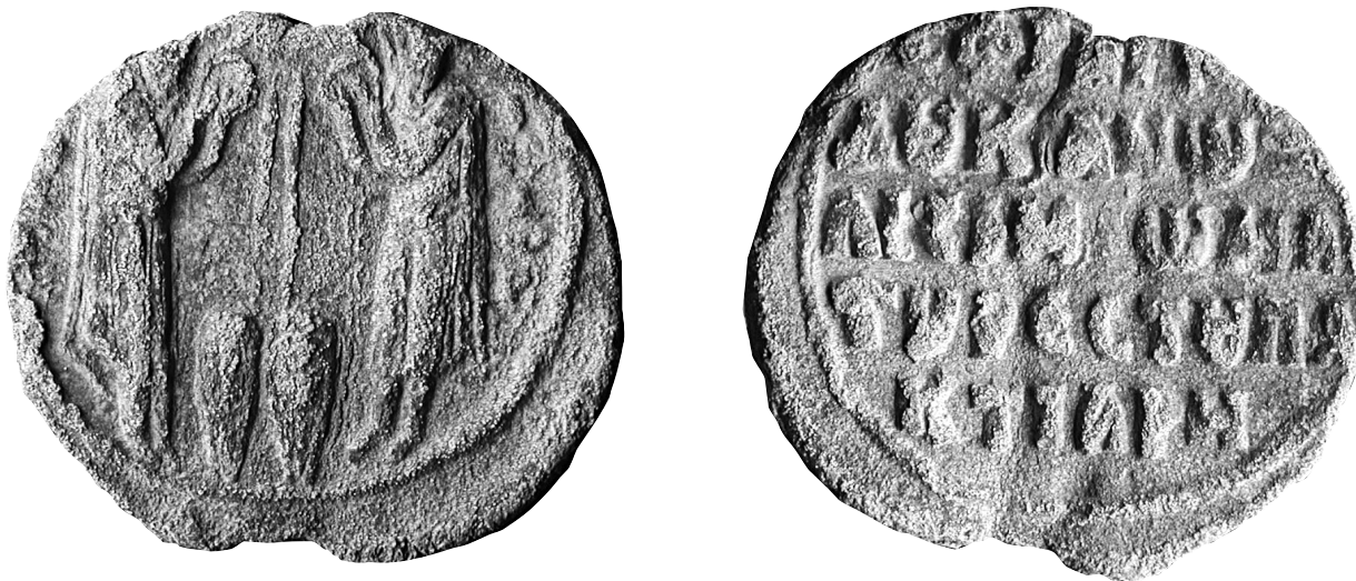
Fig. 12. Paris, BnF, département des Monnaies, Médailles et Antiques, no. d'inv. 821. Sceau de Jean Paktiarès, protonobellissime et duc. Ancienne collection Henri Seyrig.

de la société. Son culte était particulièrement populaire auprès des officiers de l'armée d'Orient 69 . Au sein de cette aristocratie militaire, il y a peut-être eu un besoin d'identification à un saint militaire de plus haut rang qu'une simple recrue ( Τήρων ). Théodore Stratèlatès introduit donc l'idée de prestige social. Sur les sceaux, les saints militaires sont habituellement figurés de face. Le type qui montre les deux saints Théodore se faisant face de profil avec les mains levées en prière est plus rare. On le trouve, par exemple, sur un sceau de la fin du XIe-début du XIIe siècle ayant appartenu à un certain Jean Paktiarès, protonobéllissime et duc. La dignité de protonobéllissime constituait alors l'échelon le plus élevé auquel pouvait prétendre un fonctionnaire lorsqu'il n'était pas apparenté à la famille impériale 70 (Fig. 12). Le même type est attesté sur un sceau du début du XIIe siècle de Jean Doukas, beau-frère de l'empereur Alexis Comnène, qui a joué un rôle important à la tête des armées byzantines en Anatolie 71 . Un autre sceau du XIIe siècle, qui porte le même type iconographique a été retrouvé dans la forteresse médiévale de Braničevo sur le Danube. Seul le saint de gauche est conservé et l'inscription le désigne comme, ὁ Στρατηλάτης, «le Stratèlatès». Le titre du détenteur n'est pas lisible mais on peut imaginer qu'il s'agissait d'un militaire 72 . Ce type iconographique se retrouve sur un sceau daté entre 1150 et 1180 émis cette fois-ci en raison de