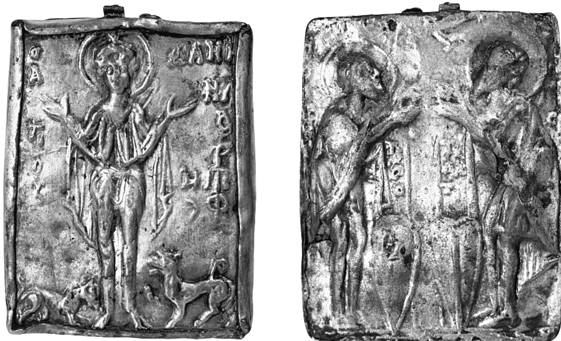
Fig. 1. Musées archéologiques d'Istanbul, no. d'inv. 95.278 (M). Enkolpion de Belgratkapı avec Daniel dans la fosse aux lions et les deux saints Théodore.

Le contexte de la trouvaille montre que le détenteur de ces objets, un individu de statut élevé, leur accordait une valeur particulière. Dans son étude préliminaire du trésor (1992), Monsieur Turan Gökyıldırım, alors directeur du Cabinet numismatique du Musée archéologique d'Istanbul, a suggéré de définir ce petit lot comme des instruments de médecine 1 . L'enfouisseur du trésor aurait alors été médecin. L'enkolpion et le lot de cinq objets avaient été présentés au Musée archéologique d'Istanbul en 2002 à l'occasion d'une exposition qui accompagnait un colloque international sur l'histoire de la médecine 2 , avant de figurer dans l'exposition Life is Short, Art Long: the Art of Healing in Byzantium , organisée au Pera Museum à Istanbul (2015) 3 . Le trésor monétaire qui accompagnait l'enkolpion inclut 2 280 monnaies d'argent (dont 1 257 byzantines, 331 bulgares, vénitiennes, ottomanes et autres). Il apporte un éclairage important à notre connaissance sur les dénominations et la chronologie des monnaies byzantines après la réforme de Jean V Paléologue (1376) et illustre la présence des espèces étrangères dans la capitale impériale. Son enfouissement fut associé aux événements liés à la reprise de Constantinople par Jean V et son plus jeune fils Manuel (le futur Manuel II) en juillet 1379. Ce terminus ante quem nous