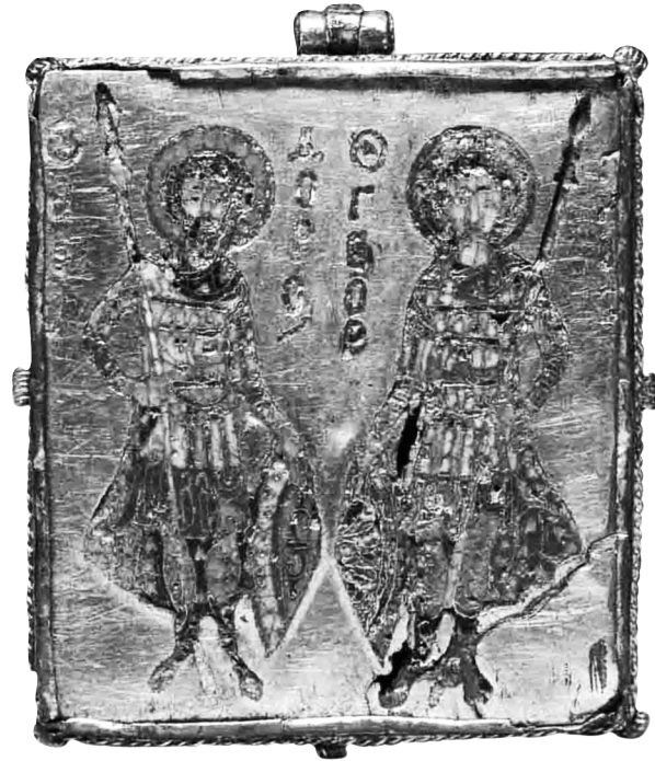
Fig. 4. Cleveland, Cleveland Museum of Art, no. d'inv. 72.94. Enkolpion avec les saints Théodore et Georges.

dernier quart du XII e siècle 19 . Les boucliers de Monreale offrent aussi les antécédents de l' adarga , bouclier en cuir des cavaliers maures dans l'art espagnol du XIII e siècle 20 . L'artiste qui a confectionné l' enkolpion de Belgratkapi, ou plutôt la matrice qui est à l'origine de cet objet, semble avoir introduit une innovation artistique qui manifeste une ouverture au réseau d'influences occidentales.