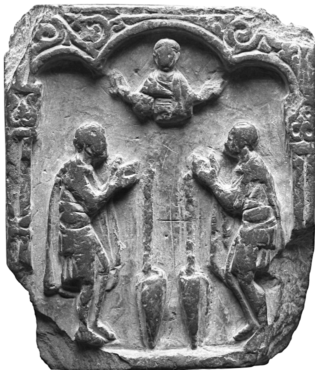
Fig. 9. Paris, Musée de Cluny-Musée national du Moyen Âge, no. d'inv. Cl.21602. Plaque en schiste avec deux saints militaires en prière sous le buste du Christ.