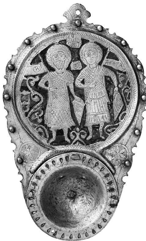
Fig. 10. Athènes, Musée Bénaki, no. d'inv. 11469. Katzion avec les saints Théodore et Démétrios.

Quant à l'image de Daniel dans la fosse aux lions, elle est déjà attestée sur les intailles de l'Antiquité tardive où néanmoins il est figuré nu ou vêtu d'une longue tunique 53 . Le message de salut qui caractérise cette scène est à l'origine de sa popularité sur des phylactères de la période médiévale. La combinaison de l'image de Daniel dans la fosse aux lions avec celle de saint Georges cavalier terrassant le dragon sur les deux faces d'un médaillon en argent retrouvé dans une forteresse du haut Moyen Âge près du village de Tsar Assen, dans la région de Silistra en Bulgarie, reflète la connotation apotropaïque de ce type iconographique 54 . Le médaillon a été daté du milieu du Xe siècle au deuxième quart du XIe siècle, date de destruction de la forteresse. Ensuite, au XIIe siècle, l'image de Daniel dans la fosse aux lions devient le trait caractéristique d'une production de camées de haute qualité artistique issus d'ateliers constantinopolitains. Sur ces camées, la figure élancée du prophète en prière est flanquée de deux lions dans une attitude