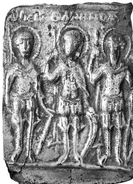
Fig. 8. Belgrade, Musée national, no. d'inv. 317. Fragment d'un enkolpion en argent découvert Markova Varoš, près de Prilep en Serbie.

À ces enkolpia d'orfèvrerie en forme de boîtier, qui sont parfois erronément qualifiés de reliquaires, s'associe une production de petits enkolpia plats coulés en plomb datés du XIII e -XIV e siècle, de forme circulaire ou rectangulaire. Cer-