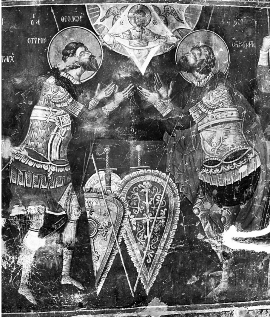
Fig. 13. Hagios Athanasios tou Mouzaki à Kastoria. Mur sud. Panneau peint des deux saints Théodore couronnés par le Christ.

était essentiellement centré sur ses reliques, qui étaient conservées dans une crypte du sanctuaire de saint Romanos, près de la Porte de Romanos sur les murailles terrestres de Constantinople 93 . Le poème de Manuel Philès (vers 1275-1345) consacré au sarcophage en marbre rouge du prophète Daniel témoigne de la vivacité de son culte à cette époque. En s'exclamant devant les anges qui semblent dormir comme des enfants au-dessus du sarcophage et les deux lions qui le supportent, le poète rend compte des sensations que pouvait expérimenter le fidèle devant un tel monument. Mais surtout, sa description permet de constater une influence occidentale