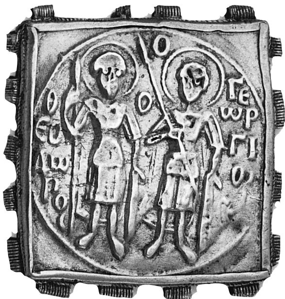
Fig. 7. Mont Athos, Monastère de Vatopédi. Enkolpion en argent avec les saints Georges et Théodore.