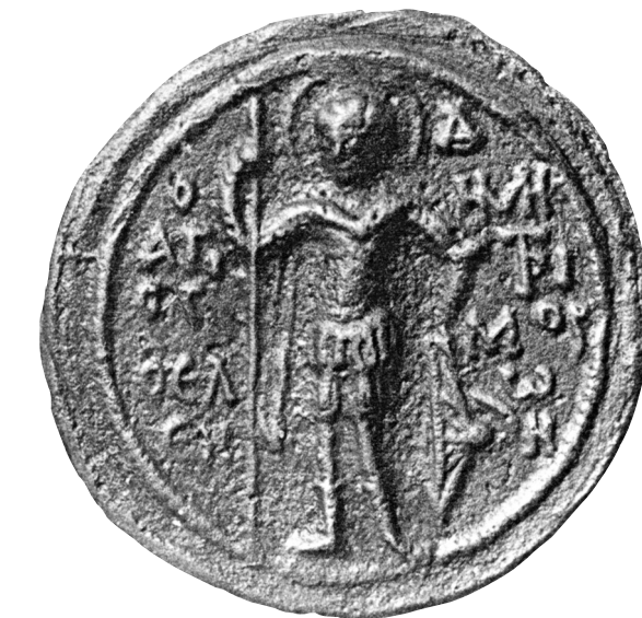
Fig. 5. Athènes, Collection Konstantinos Notaras. Matrice en bronze avec les saints Théodore Tirôn et Théodore Stratêlatès.