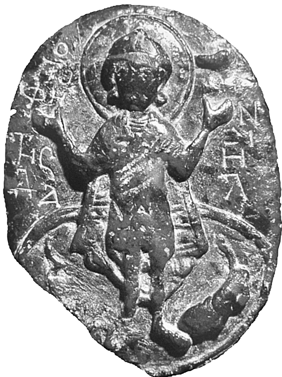
Fig. 11. Athènes, Musée Bénaki, no. d'inv. 13520. Jaspe rouge avec Daniel dans la fosse aux lions.

plongeante qui s'insèrent sous la lisière inférieure du manteau. La production se maintient au XIII e siècle mais se distingue des prototypes antérieurs par les proportions plus trapues des figures 55 . Un médaillon en or de la collection de Dumbarton Oaks montre, par ailleurs, qu'au XIII e siècle, Daniel dans la fosse aux lions était un motif populaire de l'orfèvrerie précieuse 56 . Il nous semble intéressant de signaler un médaillon très similaire à celui de Dumbarton Oaks, qui occupe le centre d'un enkolpion rectangulaire en argent conservé à Chersonèse, et qui aurait été découvert dans l'une des églises médiévales de Sébastopol en Crimée. Les quatre trous perforés aux extrémités de l'objet, tels qu'on peut les voir sur le cliché publié, témoignent néanmoins d'un remaniement singulier, difficile à interpréter 57 . Manuel Philès, poète prolifique de l'époque paléologue, décrit deux camées portant l'image de Daniel dans la fosse aux lions, dont un en jaspe avec des veines rouges et vertes et un autre ayant appartenu à un certain Manuel Mélissène 58 . Celui en jaspe rouge pourrait ressembler à celui du Musée Bénaki d'Athènes, également attribué à un atelier constanti-