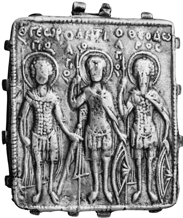
Fig. 3. Mont Athos, Monastère de Vatopédi. Enkolpion avec les saints Georges, Dèmètrios et Théodore.