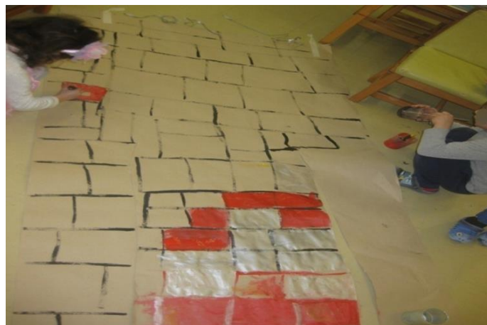
Εικόνα 12 Διακόσμηση με τούβλα