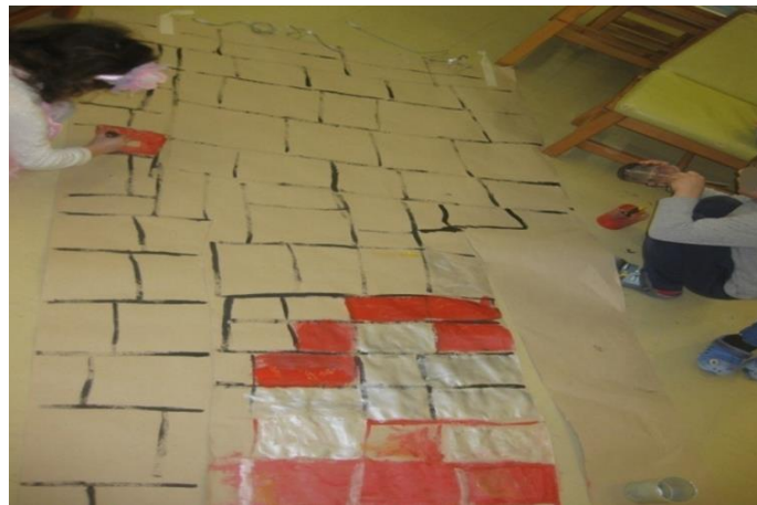
Εικόνα 12 Διακόσμηση με τούβλα