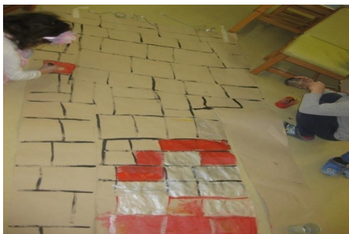
Εικόνα 12 Διακόσμηση με τούβλα