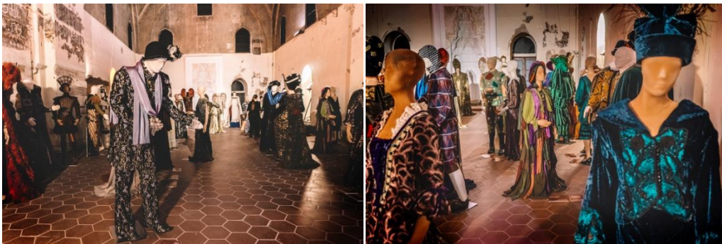
Εικόνες 1, 2