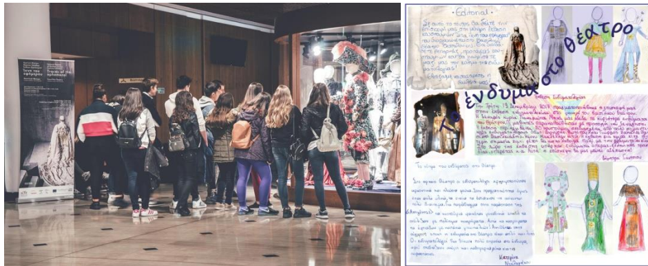
Εικόνα 9, 10

Η έκθεση συνοδεύεται από ξεναγήσεις για ενήλικες και σχολικές ή προσχολικές ομάδες παιδιών, άλλες παράλληλες εκδηλώσεις και εκπαιδευτικά προγράμματα ανάλογα με το επίπεδο εκπαίδευσης. Από το 2016 το Κ.Θ.Β.Ε. διοργανώνει την περίοδο των καλοκαιρινών σχολικών διακοπών ολοήμερο θερινό καλλιτεχνικό εργαστήρι για παιδιά «Αυτό το Καλοκαίρι πάμε Διακοπές στο... Θέατρο!». Τα τελευταία δυο χρόνια πάνω από 1500 παιδιά συμμετείχαν στο πρόγραμμα και αξιοποίησαν με τη βοήθεια των εκπαιδευτών την έκθεση Ίχνη του εφήμερου .