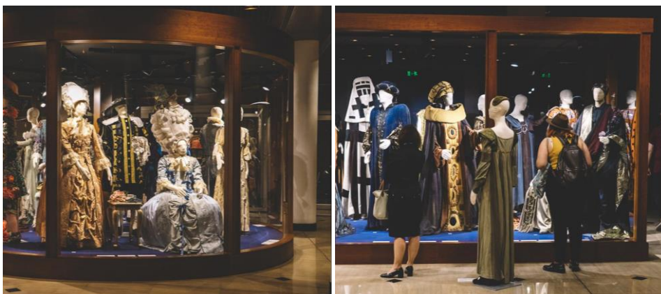
Εικόνα 7, 8

Τα επιλεγμένα κοστούμια φιλοξενούνται σε εκθεσιακές προθήκες στα φουαγιέ του Βασιλικού Θεάτρου, στο ισόγειο και στον πρώτο όροφο. Οι προθήκες έχουν στόχο να προστατέψουν τα εκτιθέμενα κοστούμια από τη διέλευση του κοινού και συγχρόνως να προσφέρουν ένα κατάλληλο πλαίσιο το οποίο βοηθά τον επισκέπτη στην κατανόηση και στην απόλαυση των εκθεμάτων. Οι ειδικά μελετημένες εκθεσιακές κατασκευές από ξύλο και γυαλί είναι λιτές, εναρμονίζονται με την αισθητική της αρχιτεκτονικής των φουαγιέ του Βασιλικού Θεάτρου, και έτσι γίνονται όσο το δυνατόν αθέατες ώστε να αναδείξουν τα κοστούμια που περιέχουν. Οι συνθέσεις των θεατρικών κοστούμιών περιλαμβάνουν και κάποια φροντιστηριακά αντικείμενα (όπως έπιπλα, διακοσμητικά, κ.ά.) (Εικ. 7) και μαζί με τον ειδικό φωτισμό λειτουργούν ως μικρές σκηνογραφίες. Μέσα στις προθήκες υπάρχουν όλα τα στοιχεία τεκμηρίωσης των κοστούμιών και επιπρόσθετα στους χώρους των δύο φουαγιέ τοποθετήθηκαν ενημερωτικά πάνελ με πληροφορίες σχετικά με το σκεπτικό της έκθεσης. Τέλος, προβάλλεται ένα βίντεο με οπτικά ντοκουμέντα από τις παραστάσεις στις οποίες φορέθηκαν τα κοστούμια της έκθεσης. Για να εντείνουμε την εμπειρία του επισκέπτη κάποια κοστούμια εκτίθενται εκτός των προθηκών, κοντά σε αυτές παίρνοντας τη θέση του θεατή (Εικ. 8).