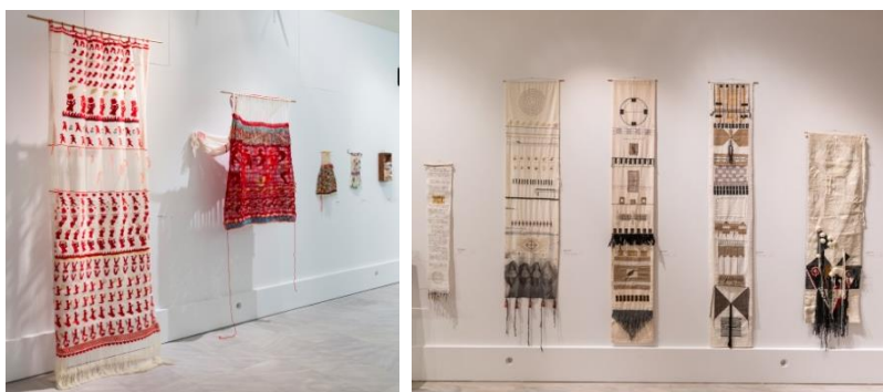
Εικόνες 10, 11