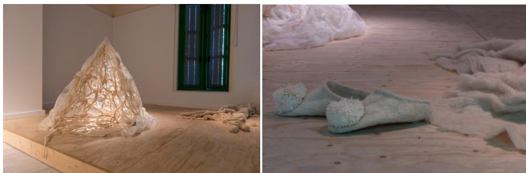
Εικόνες 4, 5

Σαρακατσάνων αλλά για να ζωντανεύσει όλα όσα παραμένουν ανεπηρέαστα από το πέρασμα του χρόνου: τη βασική ανάγκη για στέγαση και ένδυση των ανθρώπων.