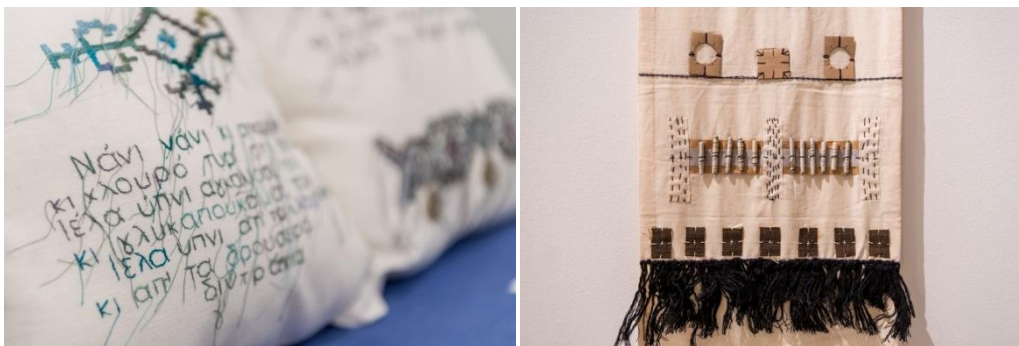
Εικόνες 8, 9

Τα διακοσμητικά σχέδια των Σαρακατσάνων είναι κατεξοχήν γεωμετρικά, έχουν άμεση σχέση με το περιβάλλον και τις δοξασίες τους αλλά και με το υλικό των προς διακόσμηση αντικειμένων όπως το μάλλινο και βαμβακερό υφαντό. Τα σχήματα που κοσμούν την ποδιά, τα φεγγάρια, οι σταυροί και οι κουδέλες έχουν συμβολικό χαρακτήρα με σκοπό να προφυλάξουν τη γυναίκα με μαγικό τρόπο. Η Ιφιγένεια Σδούκου ξεκινώντας από τα χρώματα και τα γεωμετρικά σύμβολα, τα χαρακτηριστικά στοιχεία της σαρακατσάνικης τέχνης τα μεταφέρει είτε κεντώντας πανό και μαξιλάρια, είτε δημιουργώντας συμβολικά έργα μικτής τεχνικής. (εικ. 8, 9)