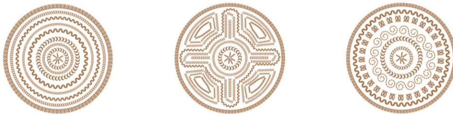
Εικόνα 3 Τα «φεγγάρια»

πολύ σημαντικά στη ζωή των Σαρακατσάνων γυναικών, «συνομιλούν» με τη σαρακατσάνικη τέχνη και δημιουργούν σύγχρονα έργα, ερμηνεύοντας με εντελώς προσωπικό τρόπο τον απόηχο μιας μακρόχρονης διαδρομής. Στόχος της έκθεσης ήταν να ανιχνεύσει και να «επανερμηνεύσει» τα χαρακτηριστικά στοιχεία της σαρακατσάνικης τέχνης, με έναν σύγχρονο εικαστικό τρόπο, δίνοντας έμφαση στις αδρές γραμμές, στα χρώματα και στα γεωμετρικά της σύμβολα. Αποφασίστηκε στον νοηματικό σχεδιασμό η έκθεση να μην έχει αντικείμενα από τις συλλογές του Λ.Ε.Μ.Μ.-Θ. αλλά και ο χωρικός σχεδιασμός να ακολουθεί μια εκθεσιακή παρουσίαση έργων σύγχρονης τέχνης, αποστασιοποιημένη από την καθημερινή ζωή που συνήθως δείχνουν τα λαογραφικά μουσεία. Τα ερμηνευτικά κείμενα, βαλμένα στην είσοδο του εκθεσιακού χώρου, συνέδεαν τα έργα εννοιολογικά με τη Σαρακατσάνικη παράδοση, ώστε οι επισκέπτες να ανακαλύψουν τα μηνύματα των εκτιθέμενων αντικειμένων ο καθένας με τον τρόπο του. Για κάθε μια καλλιτέχνη σχεδιάστηκε ένα αφαιρετικό «φεγγάρι» (εικ. 3), το χαρακτηριστικό γεωμετρικό μοτίβο της ποδιάς της Σαρακατσάνας, από το οποίο πήρε και τον τίτλο της η έκθεση, και τα οποία τοποθετήθηκαν στην είσοδο της έκθεσης αντί ονομάτων, στα βιογραφικά των καλλιτεχνών και στις λεζάντες των έργων. Η επιλογή του λευκού χρώματος στον εκθεσιακό χώρο, αναδείκνυε τα εκθέματα, τόνιζε τη λιτή αισθητική της έκθεσης και ενίσχυε τη θέση της σύγχρονης τέχνης ως αυτόνομης ολότητας.