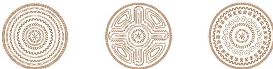
Εικόνα 3 Τα «φεγγάρια»

πολύ σημαντικά στη ζωή των Σαρακατσάνων γυναικών, «συνομιλούν» με τη σαρακατσάνικη τέχνη και δημιουργούν σύγχρονα έργα, ερμηνεύοντας με εντελώς προσωπικό τρόπο τον απόηχο μιας μακρόχρονης διαδρομής. Στόχος της έκθεσης ήταν να ανιχνεύσει και να «επανερμηνεύσει» τα χαρακτηριστικά στοιχεία της σαρακατσάνικης τέχνης, με έναν σύγχρονο εικαστικό τρόπο, δίνοντας έμφαση στις αδρές γραμμές, στα χρώματα και στα γεωμετρικά της σύμβολα. Αποφασίστηκε στον νοηματικό σχεδιασμό η έκθεση να μην έχει αντικείμενα από τις συλλογές του Λ.Ε.Μ.Μ.-Θ. αλλά και ο χωρικός σχεδιασμός να ακολουθεί μια εκθεσιακή παρουσίαση έργων σύγχρονης τέχνης, αποστασιοποιημένη από την καθημερινή ζωή που συνήθως δείχνουν τα λαογραφικά μουσεία. Τα ερμηνευτικά κείμενα, βαλμένα στην είσοδο του εκθεσιακού χώρου, συνέδεαν τα έργα εννοιολογικά με τη Σαρακατσάνικη παράδοση, ώστε οι επισκέπτες να ανακαλύψουν τα μηνύματα των εκτιθέμενων αντικειμένων ο καθένας με τον τρόπο του. Για κάθε μια καλλιτέχνη σχεδιάστηκε ένα αφαιρετικό «φεγγάρι» (εικ. 3), το χαρακτηριστικό γεωμετρικό μοτίβο της ποδιάς της Σαρακατσάνας, από το οποίο πήρε και τον τίτλο της η έκθεση, και τα οποία τοποθετήθηκαν στην είσοδο της έκθεσης αντί ονομάτων, στα βιογραφικά των καλλιτεχνών και στις λεζάντες των έργων. Η επιλογή του λευκού χρώματος στον εκθεσιακό χώρο, αναδείκνυε τα εκθέματα, τόνιζε τη λιτή αισθητική της έκθεσης και ενίσχυε τη θέση της σύγχρονης τέχνης ως αυτόνομης ολότητας.