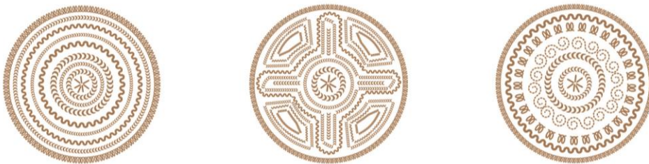
Εικόνα 3 Τα «φεγγάρια»

πολύ σημαντικά στη ζωή των Σαρακατσάνων γυναικών, «συνομιλούν» με τη σαρακατσάνικη τέχνη και δημιουργούν σύγχρονα έργα, ερμηνεύοντας με εντελώς προσωπικό τρόπο τον απόηχο μιας μακρόχρονης διαδρομής. Στόχος της έκθεσης ήταν να ανιχνεύσει και να «επανερμηνεύσει» τα χαρακτηριστικά στοιχεία της σαρακατσάνικης τέχνης, με έναν σύγχρονο εικαστικό τρόπο, δίνοντας έμφαση στις αδρές γραμμές, στα χρώματα και στα γεωμετρικά της σύμβολα. Αποφασίστηκε στον νοηματικό σχεδιασμό η έκθεση να μην έχει αντικείμενα από τις συλλογές του Λ.Ε.Μ.Μ.-Θ. αλλά και ο χωρικός σχεδιασμός να ακολουθεί μια εκθεσιακή παρουσίαση έργων σύγχρονης τέχνης, αποστασιοποιημένη από την καθημερινή ζωή που συνήθως δείχνουν τα λαογραφικά μουσεία. Τα ερμηνευτικά κείμενα, βαλμένα στην είσοδο του εκθεσιακού χώρου, συνέδεαν τα έργα εννοιολογικά με τη Σαρακατσάνικη παράδοση, ώστε οι επισκέπτες να ανακαλύψουν τα μηνύματα των εκτιθέμενων αντικειμένων ο καθένας με τον τρόπο του. Για κάθε μια καλλιτέχνη σχεδιάστηκε ένα αφαιρετικό «φεγγάρι» (εικ. 3), το χαρακτηριστικό γεωμετρικό μοτίβο της ποδιάς της Σαρακατσάνας, από το οποίο πήρε και τον τίτλο της η έκθεση, και τα οποία τοποθετήθηκαν στην είσοδο της έκθεσης αντί ονομάτων, στα βιογραφικά των καλλιτεχνών και στις λεζάντες των έργων. Η επιλογή του λευκού χρώματος στον εκθεσιακό χώρο, αναδείκνυε τα εκθέματα, τόνιζε τη λιτή αισθητική της έκθεσης και ενίσχυε τη θέση της σύγχρονης τέχνης ως αυτόνομης ολότητας.