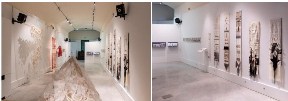
Εικόνες 1, 2

Το Λ.Ε.Μ.Μ.-Θ είναι ένα λαογραφικό μουσείο που δεν αντιμετωπίζει το θέμα της παράδοσης στατικά, αλλά ως μια δημιουργική διαδικασία που μπορεί να ενώσει το παρελθόν, το παρόν και το μέλλον έχοντας έναν ρόλο πραγματικά κοινωνικό. Από την ίδρυσή του, υιοθέτησε μια πολιτική προσανατολισμένη στα παιδιά προσχολικής και σχολικής ηλικίας τα οποία αποτελούν σήμερα το 80 - 85% των επισκεπτών του. Καθώς εστιάζει στα παιδιά, τα βοηθά να γνωρίσουν τη λαϊκή πολιτιστική κληρονομιά, να ψυχαγωγηθούν και να αισθανθούν το μουσείο ως δικό τους χώρο. Συγχρόνως τα τελευταία χρόνια διοργανώνει εκθέσεις τέχνης προσκαλώντας σύγχρονους εικαστικούς καλλιτέχνες, στους οποίους δίνει τη δυνατότητα να έχουν το μουσείο ως χώρο δημιουργίας, συνάντησης και ανάδειξης του έργου τους. Πρόσφατα παραδείγματα ήταν η έκθεση «Αναστοχασμοί της παράδοσης» (1-15/9/2019) στο πλαίσιο του Balkan Art Festival όπου εννοιολογική αφετηρία της έκθεσης ήταν οι παραδοσιακές τέχνες, οι οποίες από κοινός τόπος των διαφορετικών πολιτισμών των Βαλκανίων γίνονται αντικείμενο διερεύνησης και προβληματισμού στην σύγχρονη τέχνη. Άλλη μια τέτοια περίπτωση ήταν η έκθεση «Συνομιλώντας με τα Σαρακατσανέικα φεγγάρια» (18/5-9/6/2019).