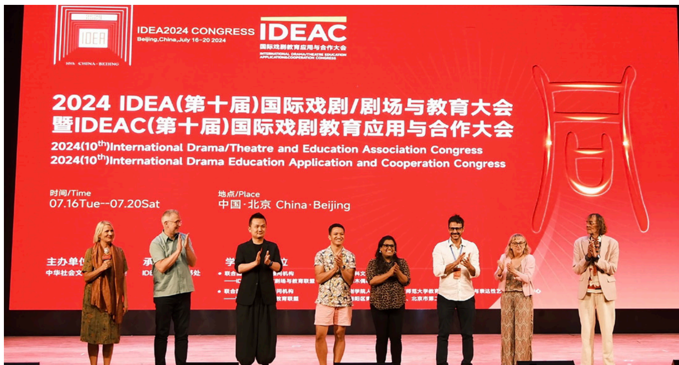
IDEA 2024 Congress.