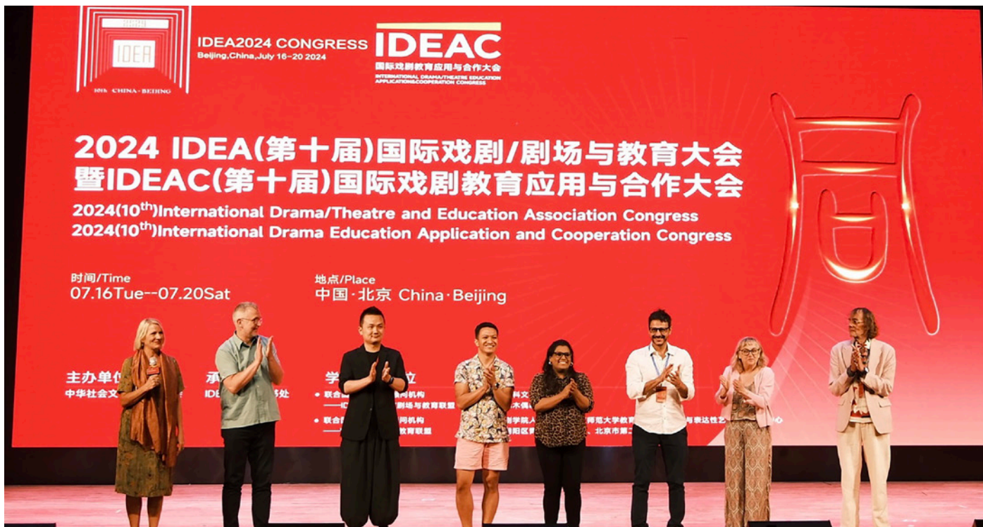
IDEA 2024 Congress.