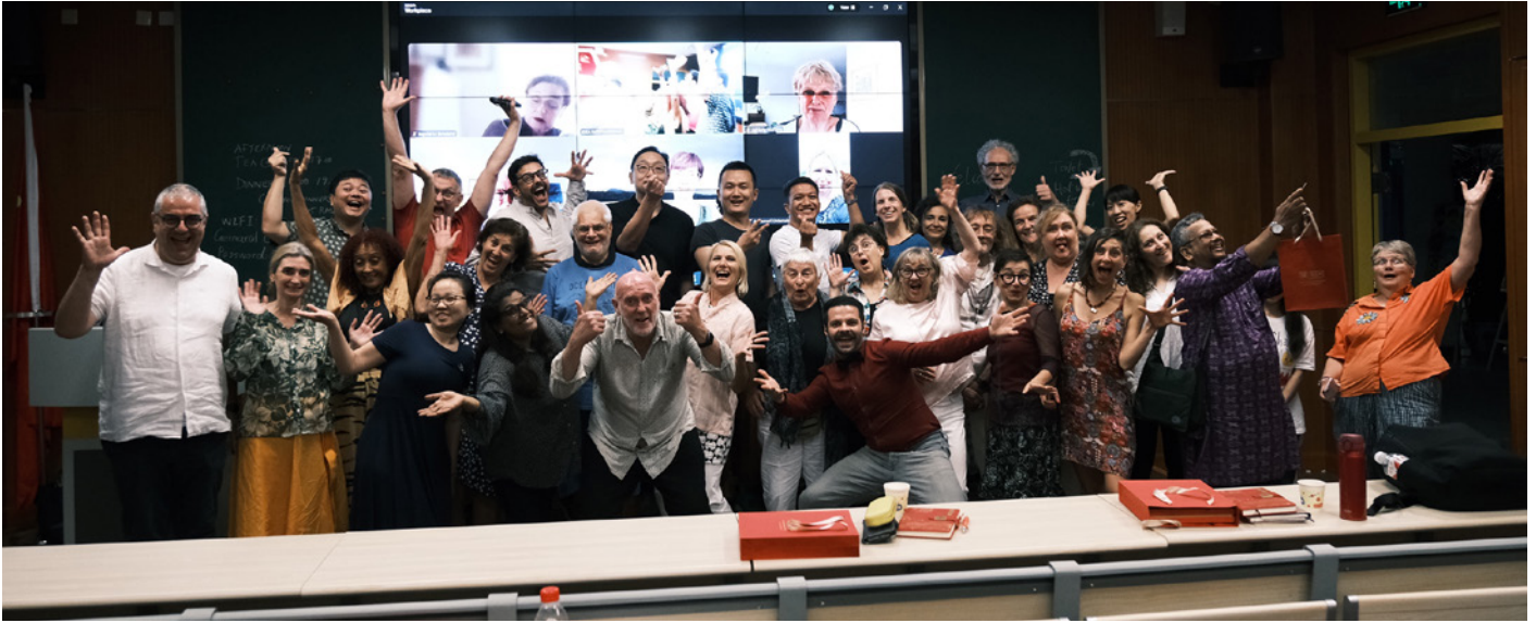
IDEA 2024 Congress.

τους οποίους ήταν δάσκαλοι σε σχολεία από όλη την Κίνα. Οι δάσκαλοι ανυπομονούσαν να συναντήσουν τους εκπαιδευτικούς θεάτρου από άλλες χώρες, για να αποσαφηνίσουν ζητήματα και να μάθουν περισσότερες μεθόδους. Στη διάρκεια 5 ημερών, το συνέδριο περιελάμβανε 6 βασικές ομιλίες, 5 σύντομες θεατρικές παραστάσεις, 5 SIG (ομάδα ειδικού ενδιαφέροντος), 3 συζητήσεις στρογγυλής τραπέζης, 48 προφορικές ανακοινώσεις, 41 εργαστήρια και 1 πρόγραμμα διεθνούς συνεργασίας του Young IDEA με παράσταση. Κατά τη διάρκεια του συνεδρίου, πραγματοποιήθηκε η Γενική Συνέλευση του IDEA και έγιναν εκλογές για το νέο Διοικητικό Συμβούλιο και τις Επιτροπές του IDEA.