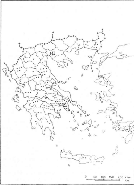
ΧΑΡΤΗΣ 3. Σύγχρονοι χοιροτροφικαὶ μονάδες (1973)