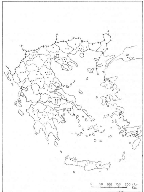
ΧΑΡΤΗΣ 4. Ὅμαδικαὶ γεωργικαὶ ἐκμεταλλεύσεις ἐγκριθεῖσαι μέχρι Δεκ. 1973

Βάσει τῶν ἀνωτέρω, εἶναι δυνατόν γενικῶς νὰ λεχθῆ ὅτι κατὰ τὴν θέσπισιν κινήτρων διὰ τὴν ἀνάπτυξιν τῆς ἡ γεωργία πρέπει νὰ τυχάνῃ τῆς αὐτῆς μὲ τοὺς ἄλλους τομεῖς μεταχειρίσεως καὶ ὅτι, ἐὰν τὰ κίνητρα διὰ τὴν γεωργίαν δὲν εἶναι περιφερειακῶς διαφοροποιημένα, οἱ στόχοι περιφερειακῆς ἀναπτύ-