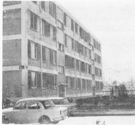
Τυπικὴ πρόσοψις πολυκατοικίας τοῦ νέου οἰκισμοῦ μετὰ τὴν δευροσφύτυσιν