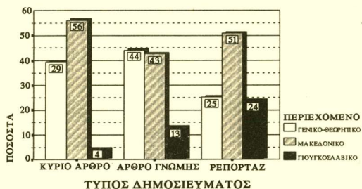
ΔΙΑΓΡΑΜΜΑ 8: Είδος δημοσιευμάτων ανά τύπο δημοσίευματος