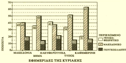
ΔΙΑΓΡΑΜΜΑ 5: Είδος δημοσιευμάτων ανά εφημερίδα