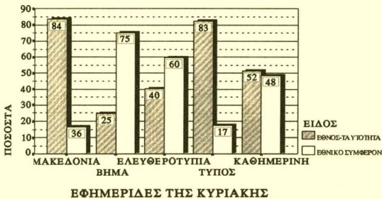
ΔΙΑΓΡΑΜΜΑ 6: Κατηγορία δημοσιευμάτων ανά εφημερίδα