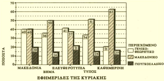
ΔΙΑΓΡΑΜΜΑ 5: Είδος δημοσιευμάτων ανά εφημερίδα