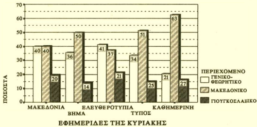
ΔΙΑΓΡΑΜΜΑ 5: Είδος δημοσιευμάτων ανά εφημερίδα