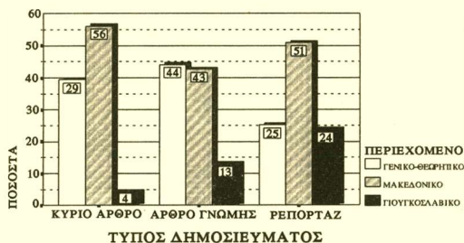
ΔΙΑΓΡΑΜΜΑ 8: Είδος δημοσιευμάτων ανά τύπο δημοσίευματος