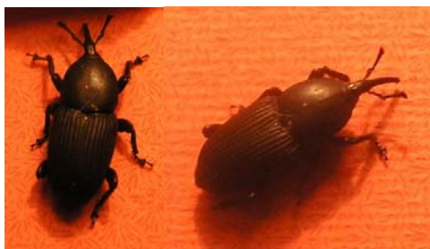
FIG. 1. Adults of Scyphophorus acupunctatus .

Adults of S. acupunctatus are small black weevils, 9-15 mm long (Fig. 1). The larval stage completes its development within 5 instars. The fully developed larva is about 18 mm long, creamy white and legless (Fig. 2). Pupation takes place within a cocoon maiden by plant fibres. The total life cycle lasts 50-90 days. In cases of severe attacks, plants may die mainly from the feeding activity of the larvae which bore galleries into the infested plants, whereas adult damage consists of feeding punctures on young leaves.