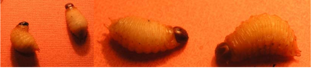
FIG. 2. Fully developed larvae of Scyphophorus acupunctatus .