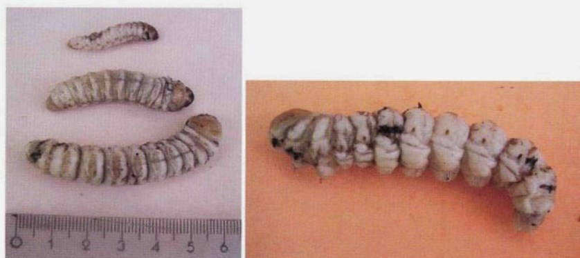
FIG. 2. Larvae of Paysandisia archon.

Livistona chinensis , L. decipiens , L. saribus , Phoenix canariensis , P. dactylifera , P. reclinata , Sabal sp., Trachycarpus fortunei , Trithrinax campestris and Washingtonia spp. It is originated from South America (Argentina, Brazil, Paraguay and Uruguay). In Europe it has been already found in France, Italy, Spain and United Kingdom (Reynaud et al. 2002, Espinosa et al. 2003, Riolo et al. 2004, Montagud et al. 2004, Colazza et al. 2005, EPPO Reporting Services, 2002-2006, Kontodimas 2006).