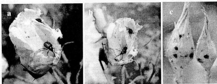
FIG. 1. Homalorhynchites hungaricus adults infesting ornamental roses and infestation in young blooms.

key (Acatay, 1970) causing serious damages on oil-bearing roses ( Rosa damascena Mill. var. kazanlika and Rosa damascena Mill. var. tringipetala respectively). In Turkey the subspecies H. hungaricus (Herbst) subsp. marginicollis Schilsky seems to be more important.