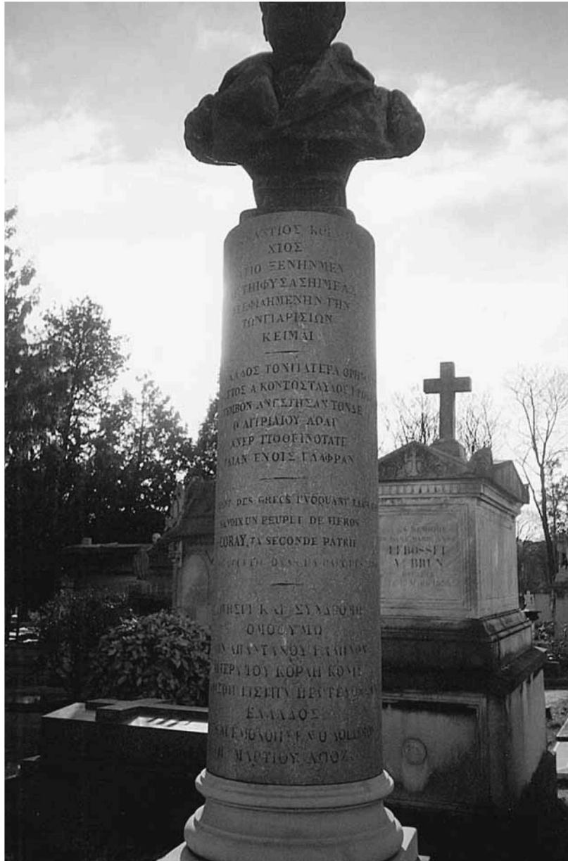
Το ταφικό μνημείο του Κοραή στο Παρίσι