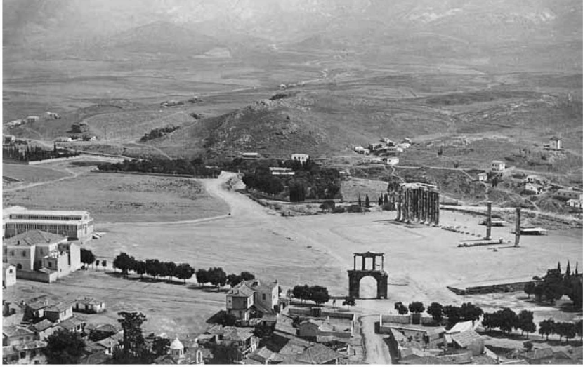
Ἄριστερά, ἡ οἰκία Ρώτα. Νοτιοδυτικὴ ὄψη. Φωτογραφία τοῦ Π. Μωραΐτη, περίπου 1870 (φωτογραφικὸ ἀρχεῖο Μουσείου Μπενάκη)