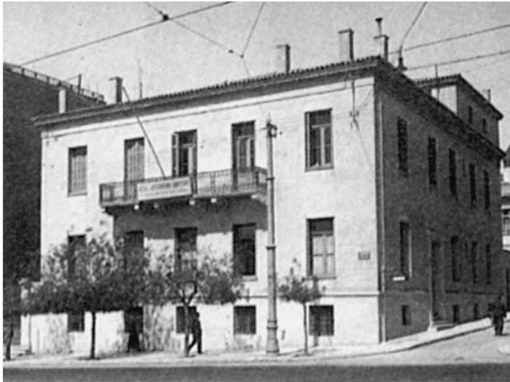
Οἰκία Ρώτα, πρωθυπουργικὴ κατοικία τοῦ Ἰω. Κολέττη (1844-1847), πρὶν ἀπὸ τὴν κατεδάφισή της