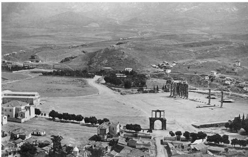
Ἄριστερά, ἡ οἰκία Ρώτα. Νοτιοδυτικὴ ὄψη. περίπου 1870