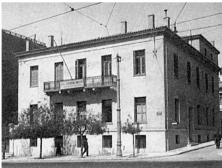
Οἰκία Ρώτα, πρωθυπουργικὴ κατοικία τοῦ Ἰω. Κολέττη (1844-1847), πρὶν ἀπὸ τὴν κατεδάφισή της (Κώστας Η. Μπίρης, Αἱ Ἀθήναι... , ἔ.π., σ. 99)