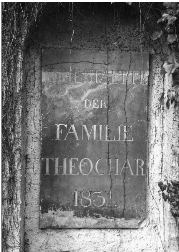
Ἡ ἐντοιχισμένη ἐνεπίγραφη πλάκα ἀπὸ τὸν οἰκογενειακὸ τάφο τοῦ Θεοχάρη Leipzig, Alter Johannisfriedhof, Fünfte Abteilung

Ἐπίσης καὶ ἓνας ἄλλος ἱστορικὸς τῶν νεκροταφείων τῆς πόλης τῆς Λειψίας, ὁ Paul Benndorf, ἀναφέρθηκε τὸ 1922 στὸν ἐν λόγω τάφο μὲ κάποιες ἐπιπλέον πληροφορίες. 13 Συγκεκριμένα ἀνέφερε πάλι τὴ θέση ἐντα-