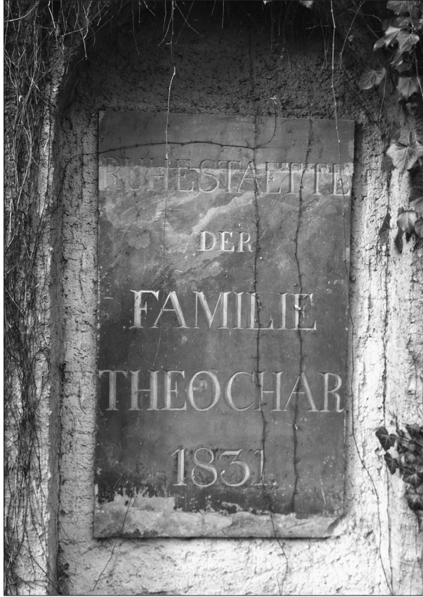
Ἡ ἐντοιχισμένη ἐνεπίγραφη πλάκα ἀπὸ τὸν οἰκογενειακὸ τάφο τοῦ Θεοχάρη Leipzig, Alter Johannisfriedhof, Fünfte Abteilung

Ἐπίσης καὶ ἓνας ἄλλος ἱστορικὸς τῶν νεκροταφείων τῆς πόλης τῆς Λειψίας, ὁ Paul Benndorf, ἀναφέρθηκε τὸ 1922 στὸν ἐν λόγῳ τάφο μὲ κάποιες ἐπιπλέον πληροφορίες. 13 Συγκεκριμένα ἀνέφερε πάλι τὴ θέση ἐντα-