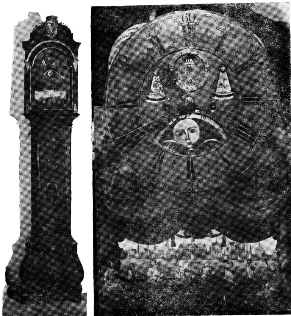
Τὸ ἐγκρεμὸς τοῦ Σταμάτη Πέτρου, μὲ τὴν παράσταση τοῦ λιμνιοῦ τοῦ "Αμστερνταμ (βλ. σ. 164)