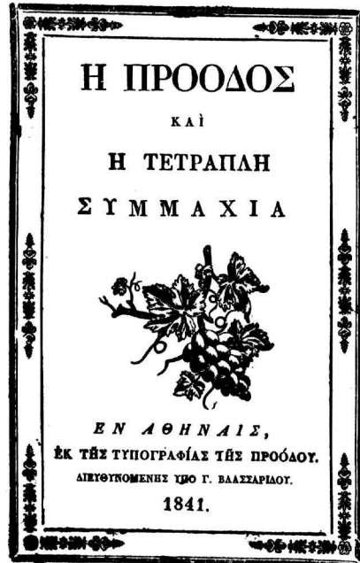
Ἐξώφυλλα τῆς Προόδου