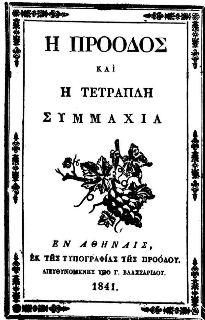
Ἐξώφυλλα τῆς Προόδου