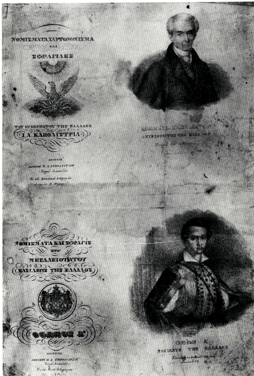
Πίν. 3. Τὸ λιθόγραφο φύλλο ἀπὸ τὸ ἀθησαύριστο ἐντυπο τοῦ Π. Δ. Στεφανίτη