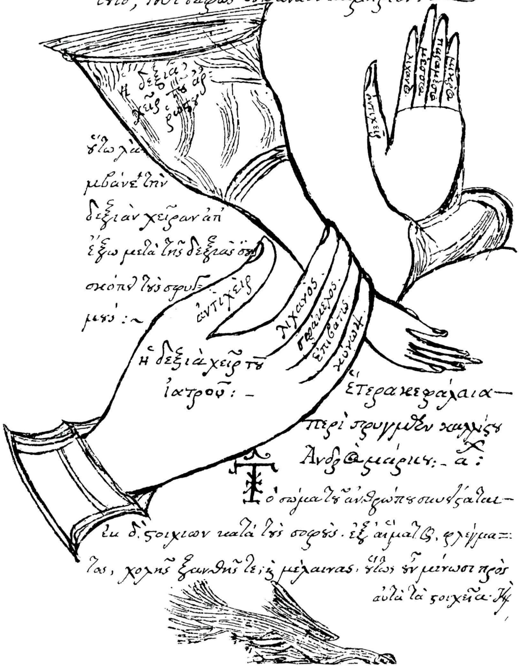
Πίν. 1. Σκαρίφημα τρόπου λήψεως σφυγμού (σελ. πγ')

Δανάε β' :- Πάιν εν μεν ουδ' υδης τον σφυγμαον μωρηνη μ'οντα η αταλωσ φερόμενον η οιοντι ζομοντα τ'ηλο, ι'ηδι σφωσ εν Δανάε λευμηριον: ~