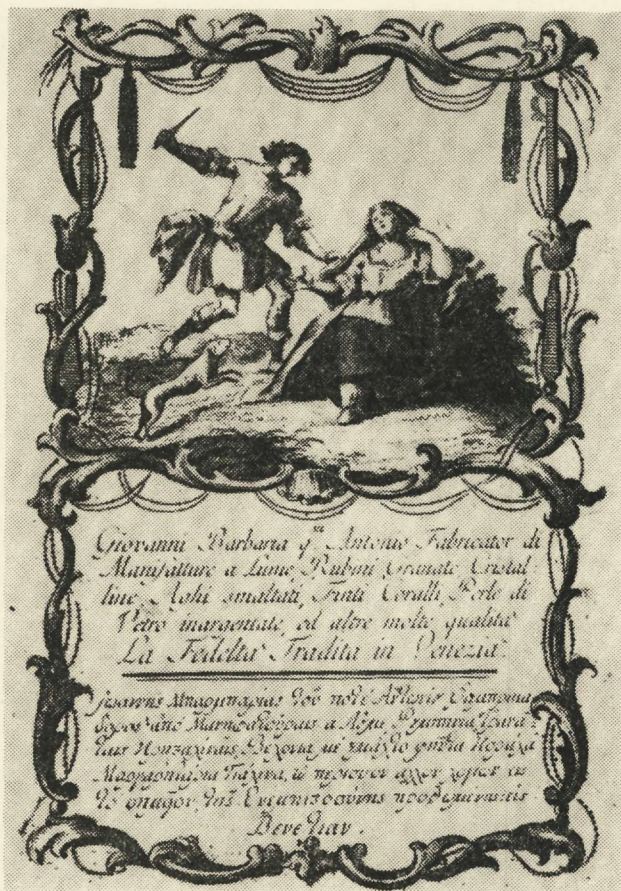
4. Archivio di Stato - Venezia. Censori, busta 47