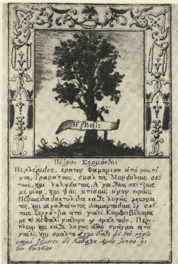
6. Archivio di Stato - Venezia. Censori, busta 47

σκέταις. Σεργούτζια από γιάλι. Καρφοβέλονα με τὸ κεφάλι γιάλινο και σμαλτάδο, Περιπλέον και κατέ λογής άλλο πράγμα από γιάλι και σμάλτο. Ἄλλα βήτε εἰς τὴν κόρτε ὀνομαζόμενοι δὲ Καβάλη Ἁγία Ἰουστίνια εἰς τὴν Βενετιάν.