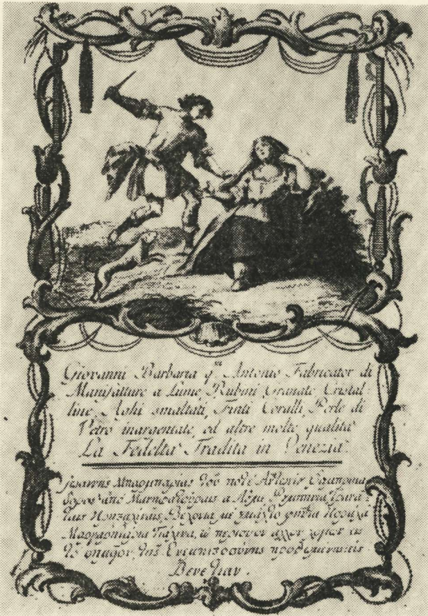
4. Archivio di Stato - Venezia. Censori, busta 47

4. Giovanni Barbaria quondam Antonio Fabricator di Manifatture a Lume, Rubini, Granate, Cristalline, Aghi smaltati, Finti Coralli, Perle di Vetro inargentate ed altre molte qualità. La Fedeltà Tradita in Venezia.