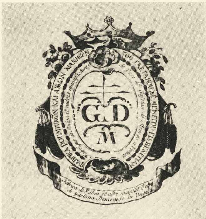
7. Archivio di Stato - Venezia. Censori, busta 47