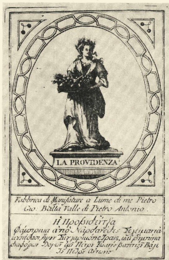
5. Archivio di Stato - Venezia. Censori, busta 47

6. Πέτρος Σερμόντης. Περλέριδες, κρατοῦν Φάμπρικα ἀπὸ ρομπί- νια, Γρανάταις, σμάλτος, Μάνδολαις σιέταις καὶ λουλουδάταις, Ἄγα- θαις σχίτζαις μὲ μίαν καὶ τρεῖς μπίσαις ἤγουν σιραῖς, Πέτραις διὰ δα- κτυλίδια κάθε λογῆς χρώματος καὶ μεγαλλιότητος διαμαντάδαις καὶ