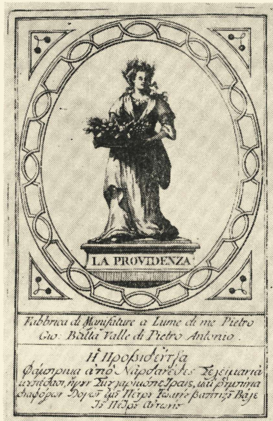
5. Archivio di Stato - Venezia. Censori, busta 47

6. Πέτρος Σερμόντης. Περλέριδες, κρατοῦν Φάμπρικα ἀπὸ ρομπί- νια, Γρανάταις, σμάλτος, Μάνδολαις σιέταις καὶ λουλουδάταις, Ἄγα- θαις σχίτζαις μὲ μίαν καὶ τρεῖς μπίσαις ἤγουν σιραῖς, Πέτραις διὰ δα- κτυλίδια κάθε λογῆς χρώματος καὶ μεγαλλιότητος διαμαντάδαις καὶ