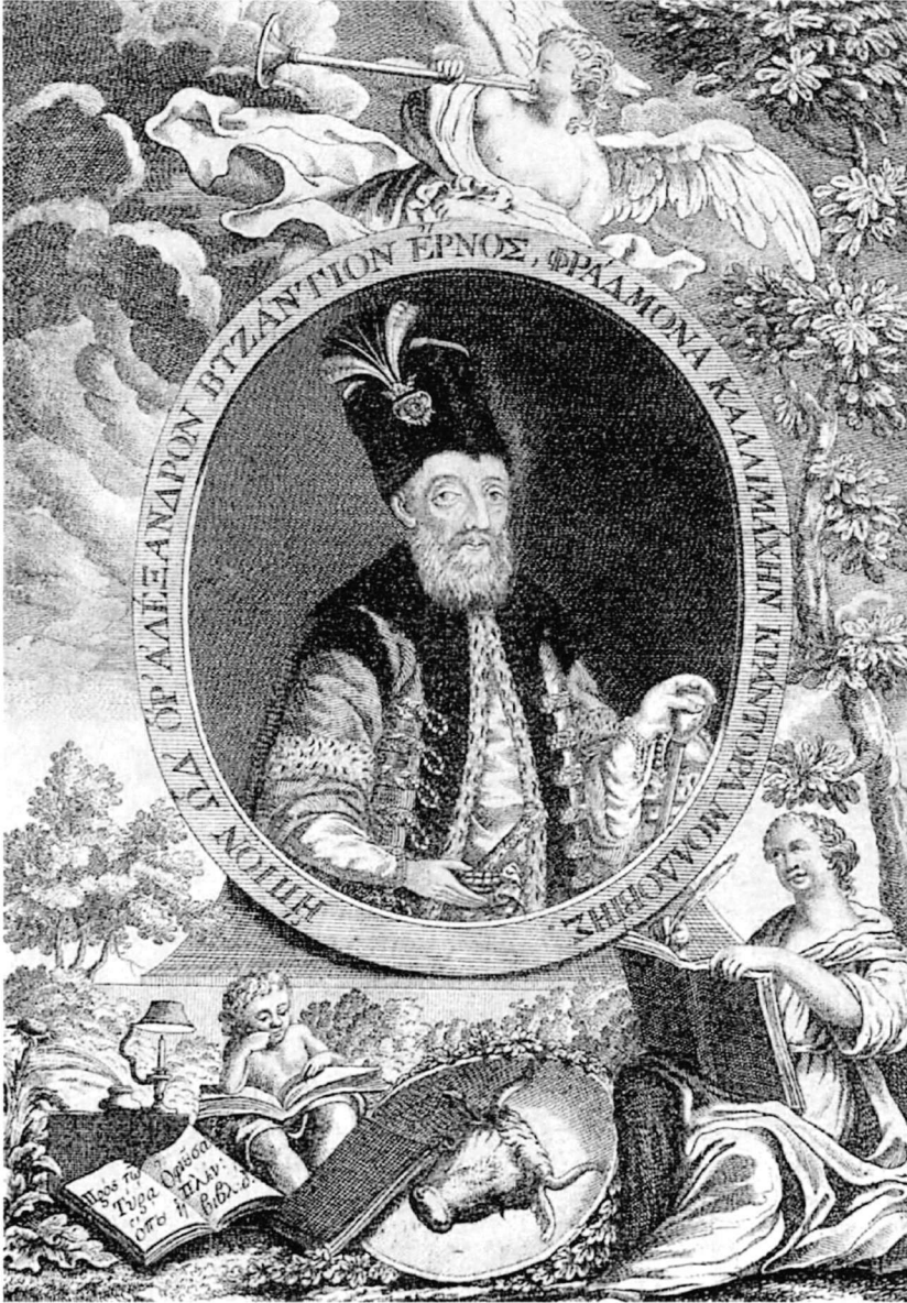
Η παράσταση στο δεξιό άνω μέρος του χάρτη της Μολδαβίας, Βιέννη 1797, με τη μορφή του ηγεμόνα Αλέξανδρου Καλλιμάχη και το ανοιχτό βιβλίο με το κείμενο «πρὸς τῷ Τύρα ὅπου ἡ Ὀφιοῦσα, Πλίν. βιβλ. δ.»