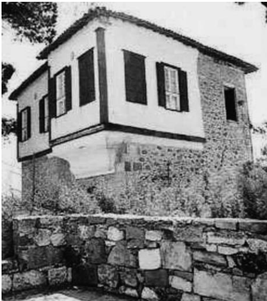
Εικ. 18: Ο πύργος του Αλαμανέλλι στη Θεομή Μυτιλήνης.