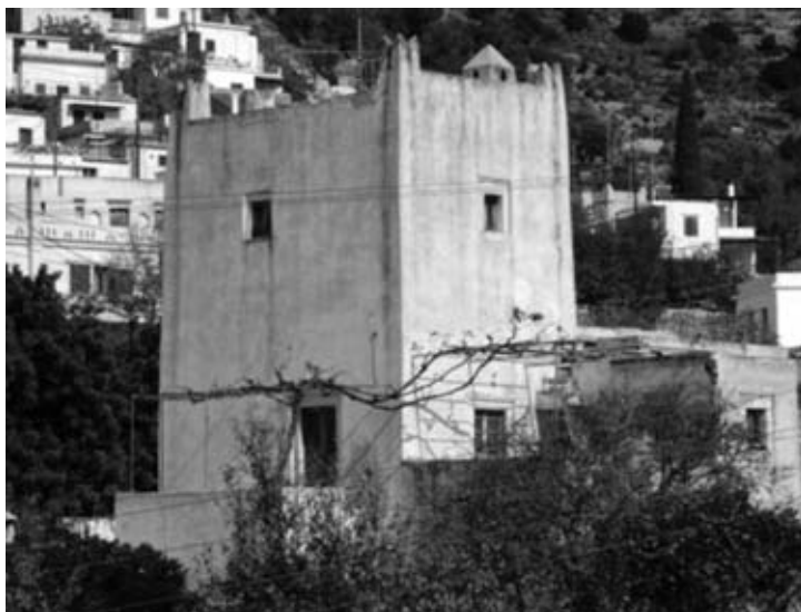
Εικ. 9: Ο πύργος των Barozzi στο Φιλώτι Νάξου (17ος αι.).