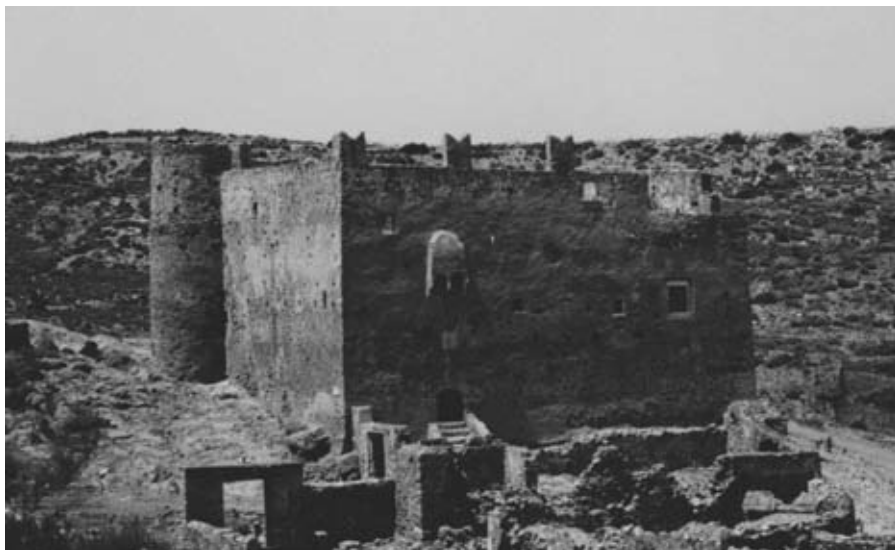
Εικ. 14: Η μονή Υψηλοτέρας (πύργος Υψηλής) στην περιοχή Εγκαρών Νάξου (17ος αι.).