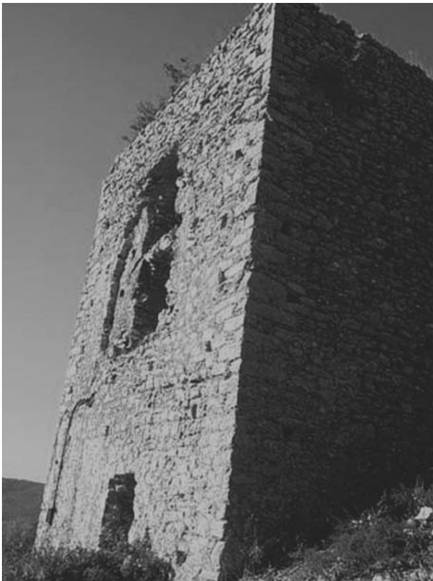
Εικ. 29: Ο πύργος της Καρύταινας (15ος αι.).