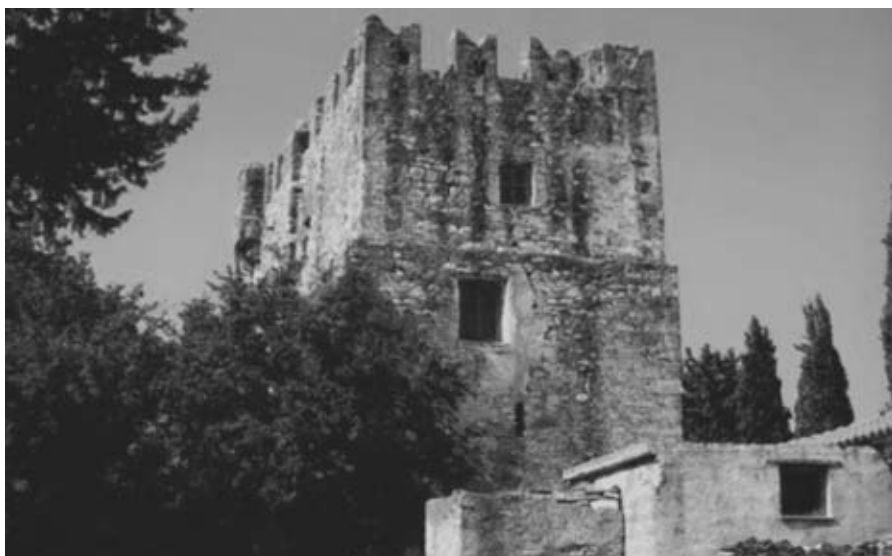
Εικ. 25: Ο πύργος Σαρακίνη στη Σάμο (1577).