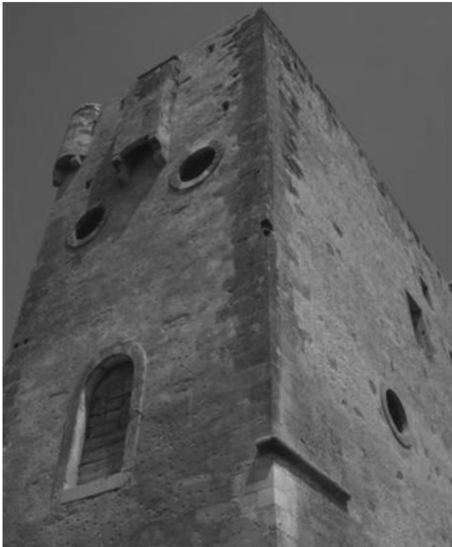
Εικ. 23: Ο Πύργος του Μαρουλά στην περιοχή Ρεθύμνης.