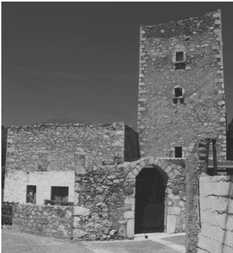
Εικ. 28: Πύργος στη μεσσηνιακή Μάνη.