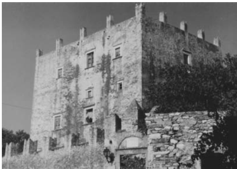
Εικ. 7: Ο πύργος του Barozzi στο Χαλκί Νάξου (τέλη 17ου-α' μισό 18ου αι.).