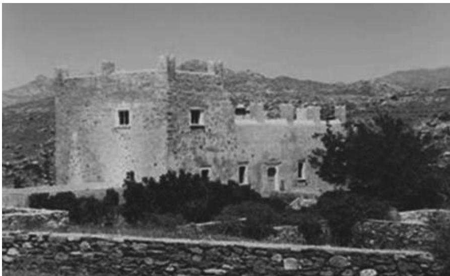
Εικ. 6: Ο πύργος του Παλαιολόγου στο Σαγκρί Νάξου (17ος αι.).