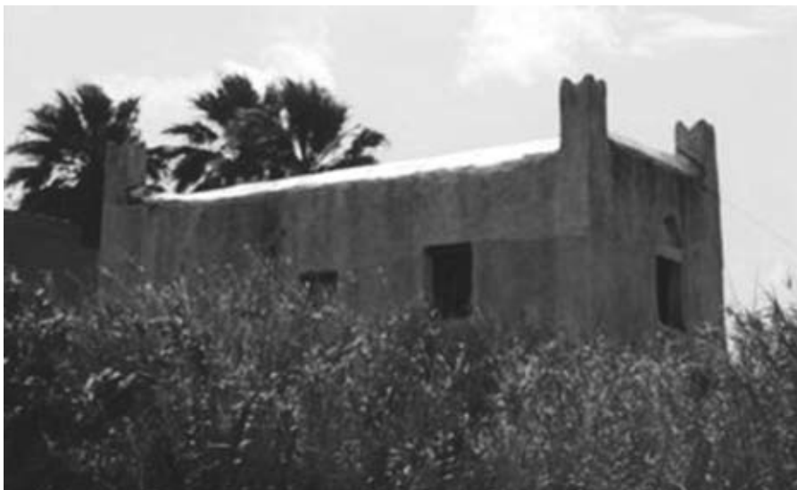
Εικ. 2: Ο πύργος του Παρατρέχου, κοντά στ' Αγγίδια Νάξου, πάλαι ποτέ δουκικό θέρετρο.