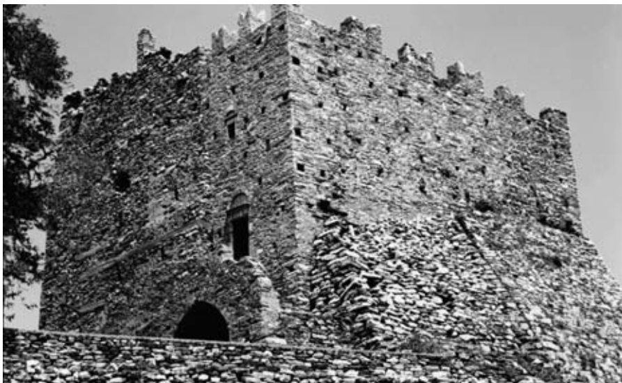
Εικ. 13: Το ορθόδοξο πυργομονάστηρο του Φωτοδότη στον Δανακό Νάξου, πριν από την πρόσφατη αναστήλωσή του.