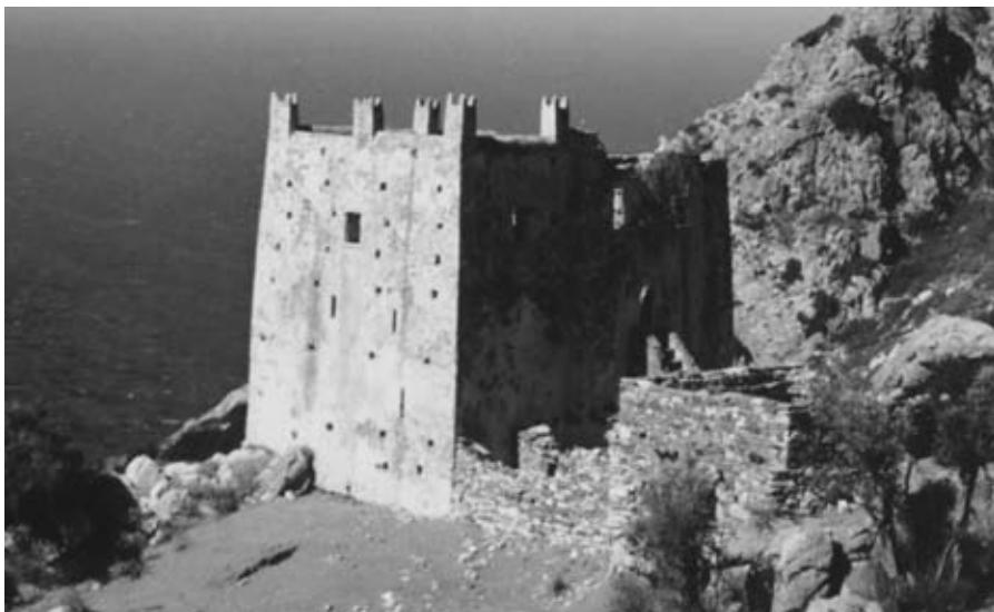
Εικ. 12: Ο πύργος της Αγιάς (17ος αι.).