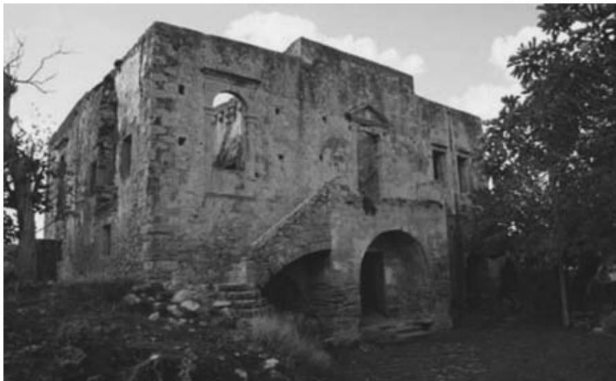
Εικ. 24: Η Villa Trevisan στον Δραπανιά Χανίων.