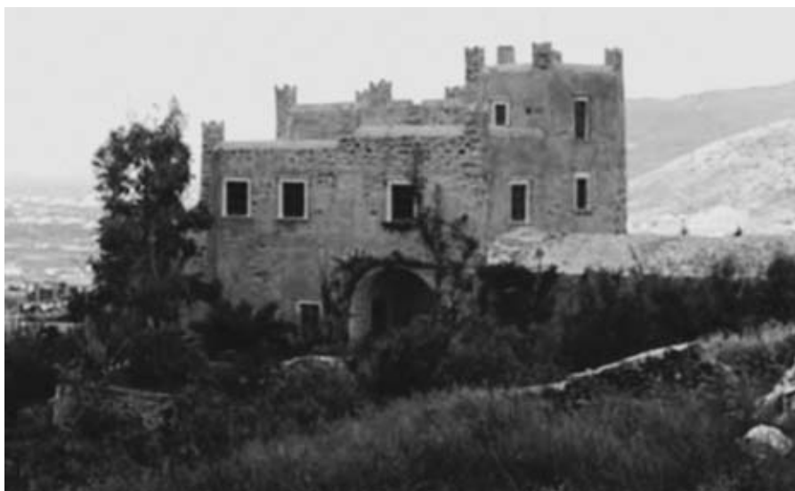
Εικ. 3: Ο πύργος του Μπελώνια (Belogna) κοντά στο Γαλανάδο Νάξου (πρω του 1610).