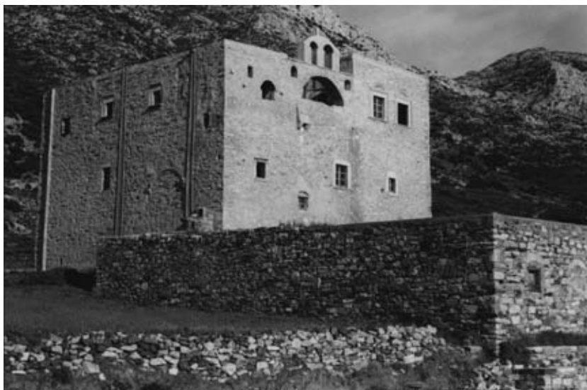
Εικ. 15: Η μονή Τιμίου Σταυρού στο Σαγκρί, γνωστή σήμερα και ως «πύργος Μπαζαίου».