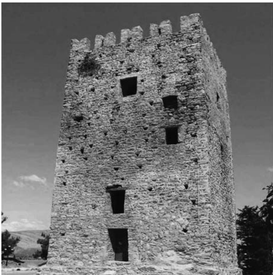
Εικ. 22: Μεσαιωνικός πύργος στο Αυλωνάρι Ευβοίας.