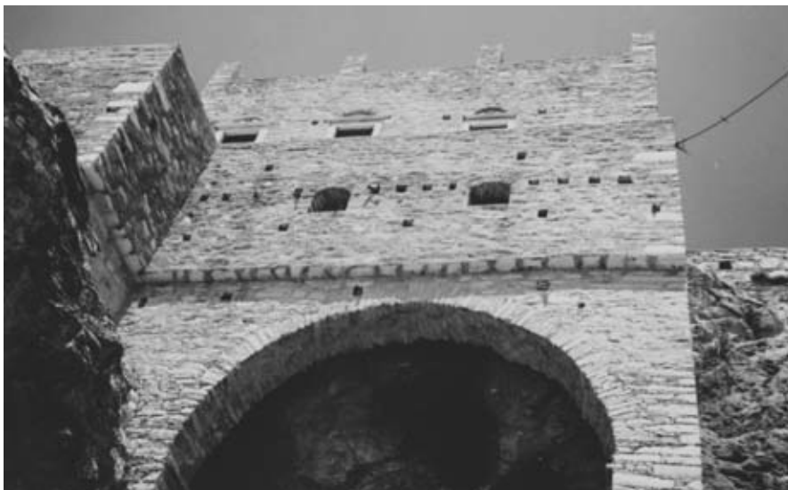
Εικ. 11: Ο πύργος του Ζευγώλη στην Απείρανθο Νάξου (17ος αι.).