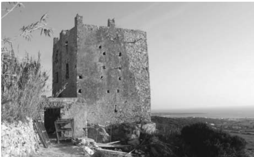
Εικ. 4: Ο πύργος του Όσκελου στη νοτιοδυτική Νάξο (17ος αι.).