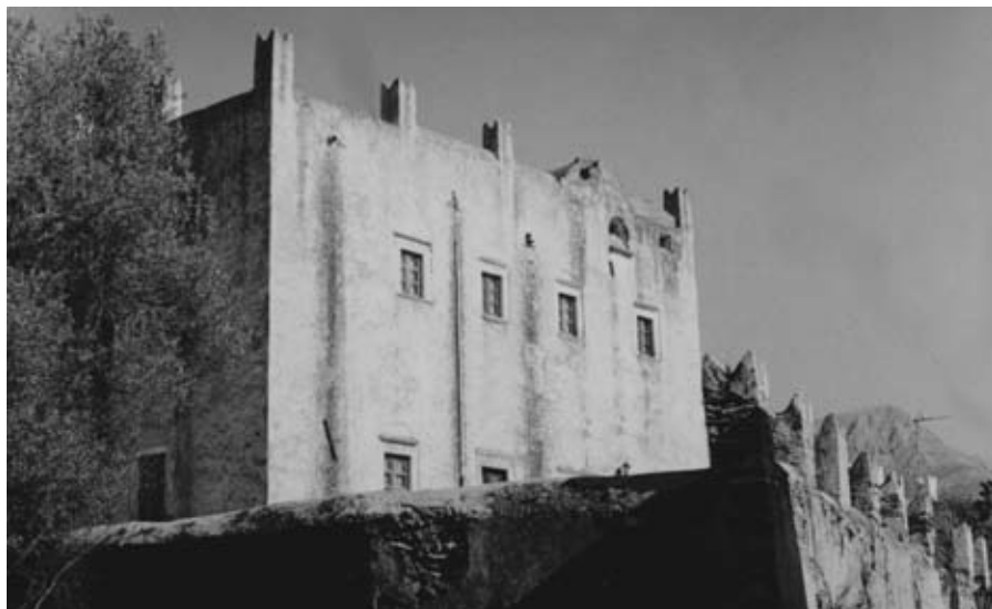
Εικ. 8: Ο πύργος του Μαροπολίτη (Παπαδάκη) στους Ακαδήμους Νάξου (18ος αι.).