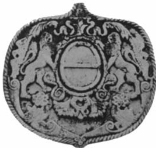
Εικ. 10: Το οικόσημο των Barozzi στο υπέρθυρο της εισόδου του ομώνυμου πύργου τους στο Φιλώτι Νάξου με χρονολογία 1718.