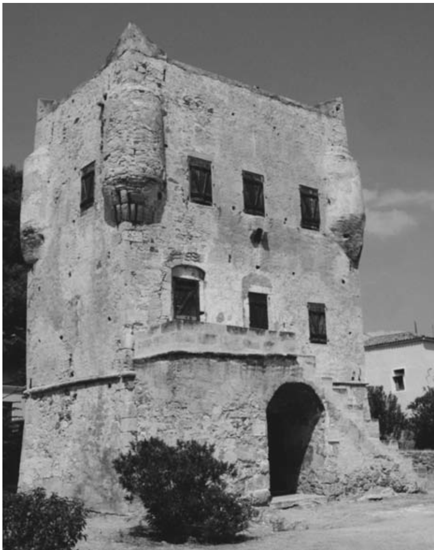
Εικ. 26: Ο πύργος του Μαργέλλου στην Αίγινα.