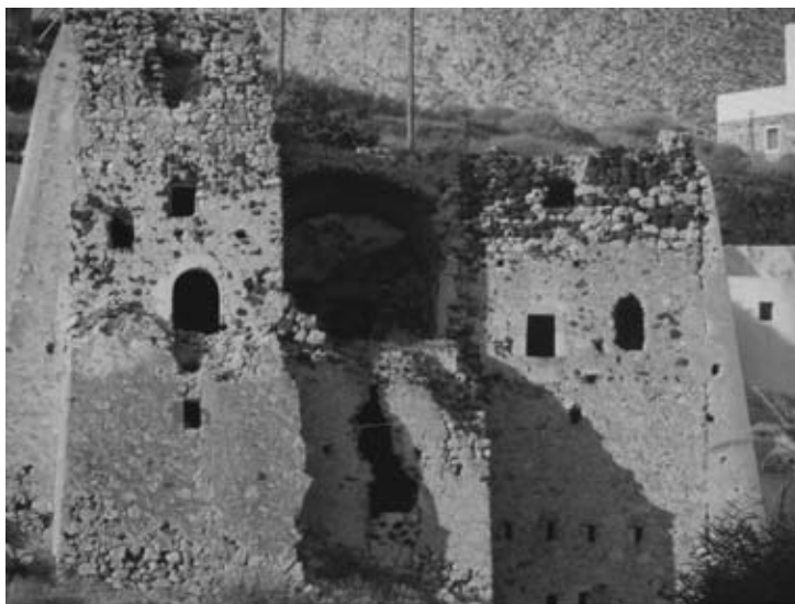
Εικ. 20: Ο γουλάς του Νημπορειού στη Σαντορίνη (17ος αι.;).