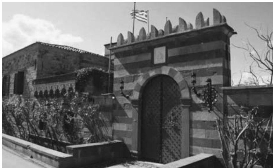
Εικ. 17: Χαρακτηριστικό πυργόσπιτο στον Κάμπο της Χίου.