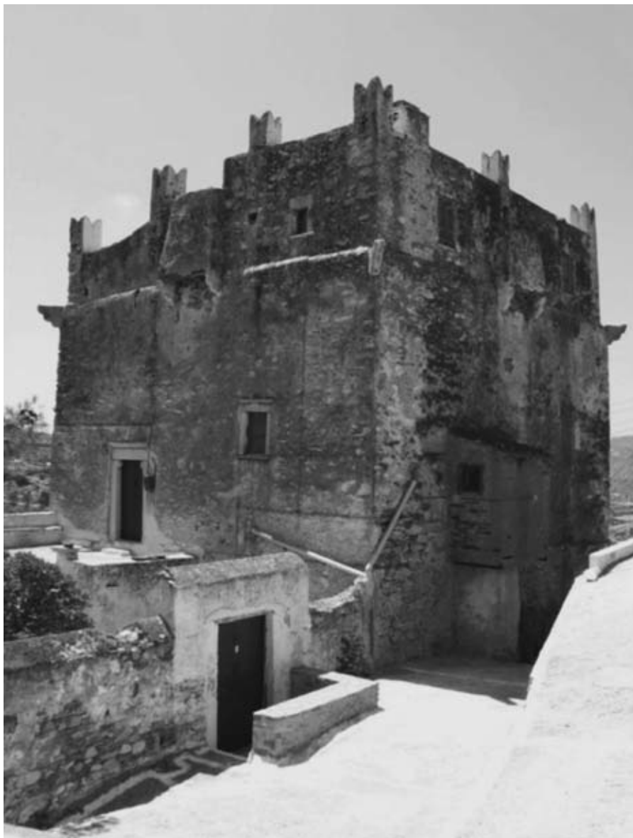
Εικ. 1: Ο πύργος του Δελλαρόγκα στο Κουρουνοχώρι Νάξου, πιθανώς ο παλαιότερος του νησιού.