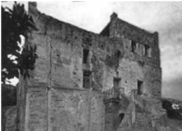
Εικ. 19: Ο πύργος του Μπίστη στην Άνδρο (17ος αι.;).