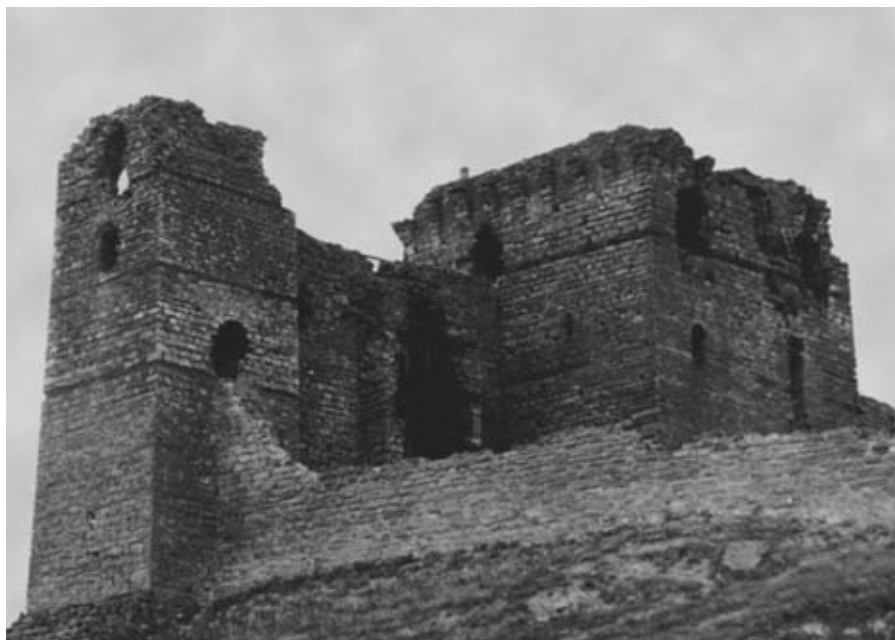
Εικ. 30: Το Κάστρο του Πυθίου στον Έβρο, κατοικία του Ιωάννου Στ' Καντακουζηνού (14ος αι.).