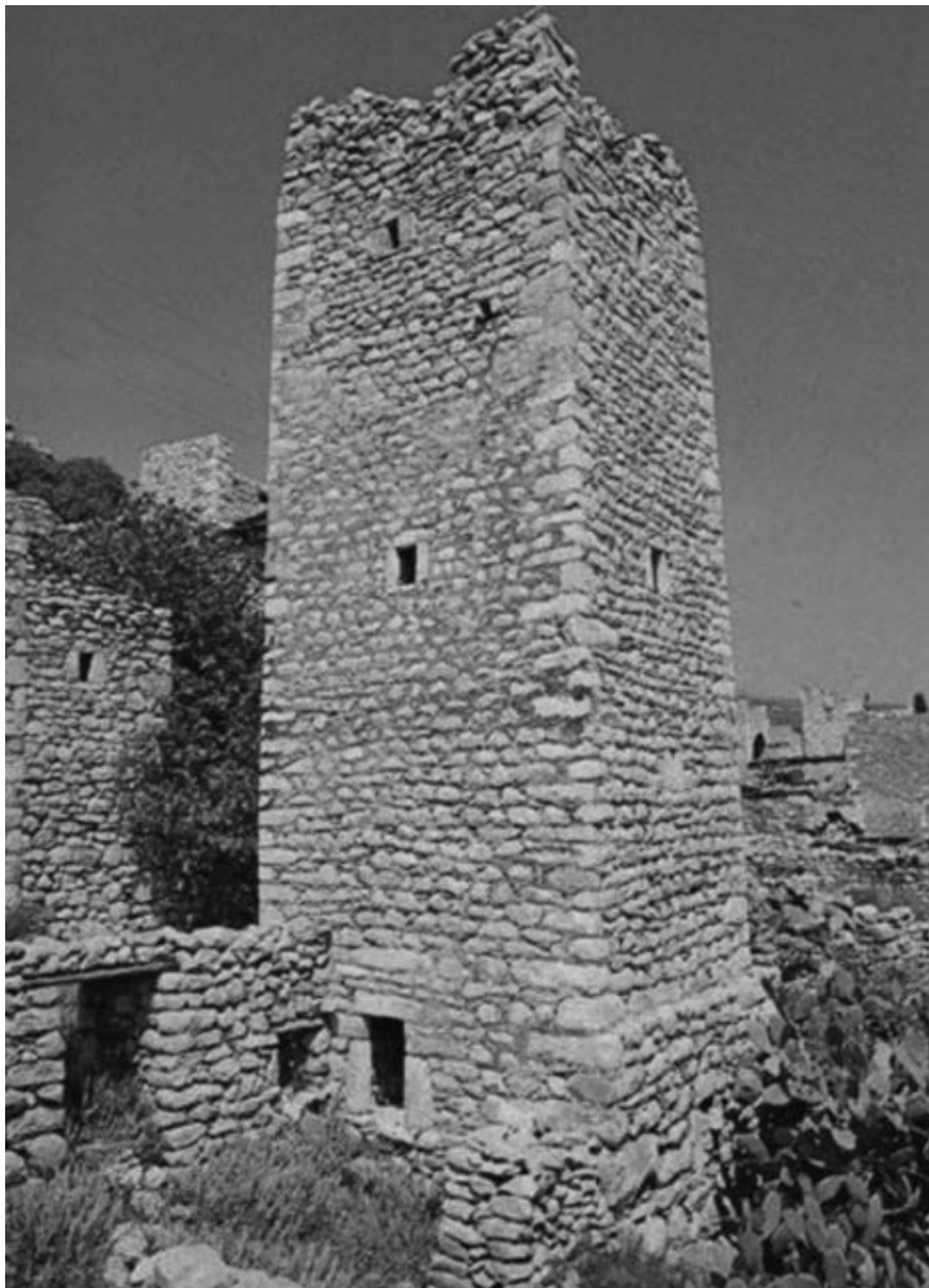
Εικ. 27: Πολεμόπυργος στη λακωνική Μάνη.