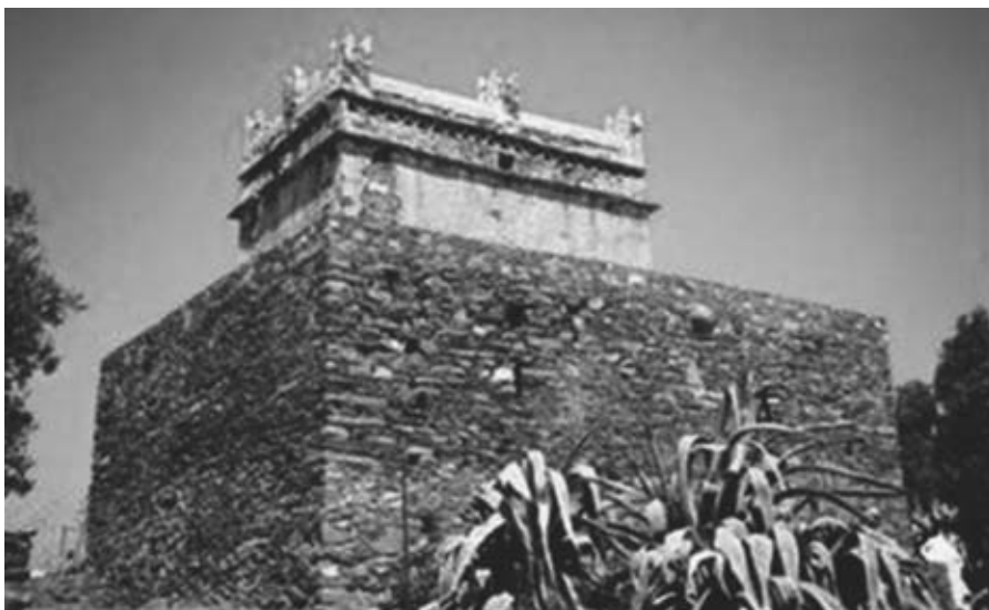
Εικ. 5: Ο πύργος - περιστερεώνας των Δελλαρόγκα στο Σαγκοί.