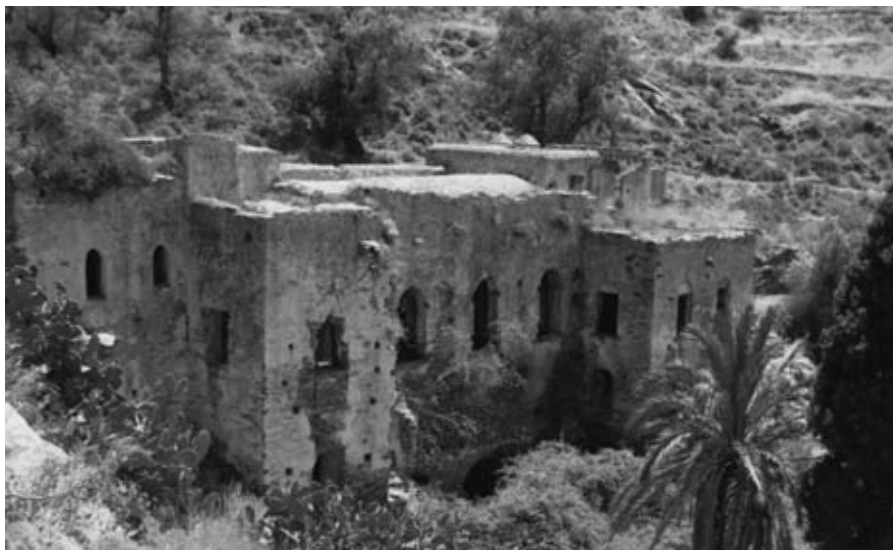
Εικ. 16: Το θέρετρο των Ιησουιτών στα Καλαμίτσια Μελάνων Νάξου (τέλη 17ου αι.).