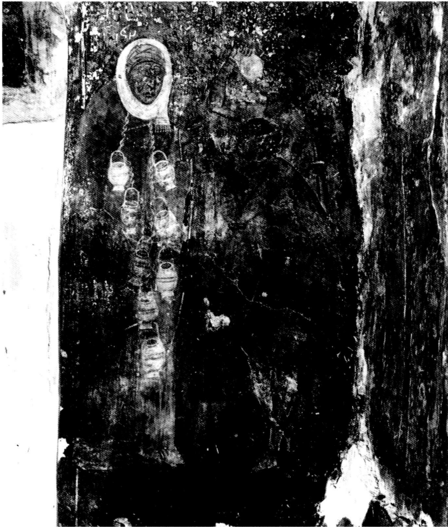
Παράσταση γριάς πού πωλεί κάποιο υγρό σέ δοχεῖα (Μονή Βλαχέρνας Ἀθῶνας) (Τῆ φωτογραφία παραχώρησε ἡ ἐπίτιμος ἔφορος Κυρία Μυρτάλη Ἀχεμιμάστου-Ποταμιάνου).