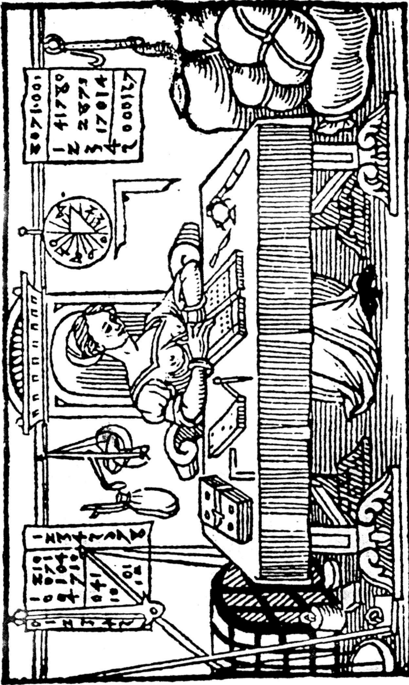
Παρόσταση γυναικάς έμπόρου (Δυτική Ευρώπη – ύστερος Μεσαίωνας) (βλ. Edith Emmen, Frauen im Mittelalter)