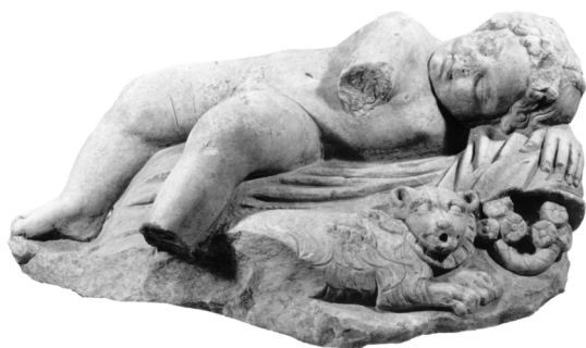
Εικ. 3. ΕΑΜ 5753