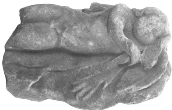
Εικ. 1. ΕΑΜ 7647