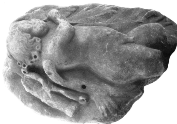
Εικ. 2. ΕΑΜ 7647