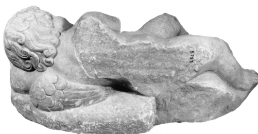
Εικ. 4. ΕΑΜ 5753