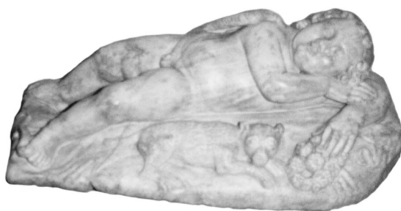
Εικ. 5. Αρ. 15 Αρχ. Μουσ. Βενετίας