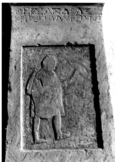
Stele of Thersagoras, a Cretan from Polyrrhenia

A number of grave stelai found during excavations of the Hellenistic fort at Demetrias show Cretan mercenaries. One is named Thersagoras from the Cretan city of Polyrrhenia. The stele had intended to be executed in low relief, but it was never finished off and the figure remains roughly blocked out. Careless, seemingly hurried work of this type is unusual for the Hellenistic period. The inscription has been crudely executed too. The pi is curious, seemingly cut back to front, with the left leg much shorter than the right. The lapicide has once cut a nu and then corrected it to gamma , and an epsilon and then corrected it to eta : thus Guarducci. 1 A number of other letters are badly cut too. This is surely a large number of slips for a three-word inscription. The text is rendered as: Θερσα(γ)όρας Κρης Πολυρ(ή)νιος .