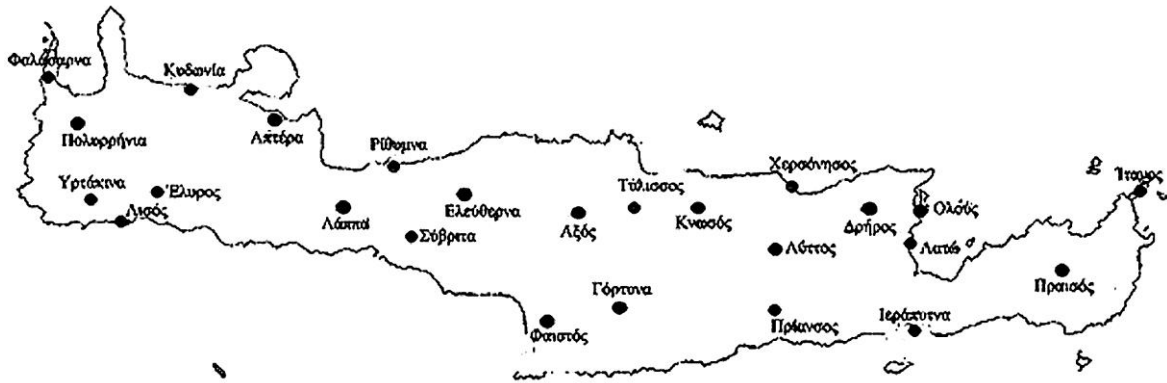
Χάρτης αρχαίας Κρήτης