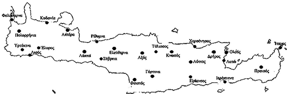
Χάρτης αρχαίας Κρήτης