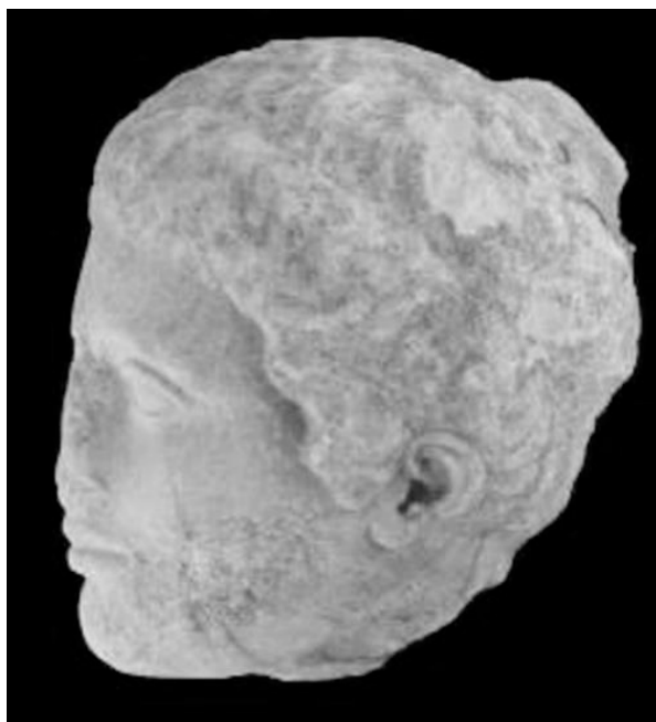
Εικ. 2. Το γλυπτό (ΦΑ 681) μετά τον καθαρισμό