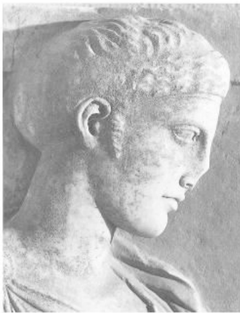
Εικ. 7. Επιτύμβια στήλη από την Γλυφάδα στο Αρχαιολογικό Μουσείο Πειραιά (2555).