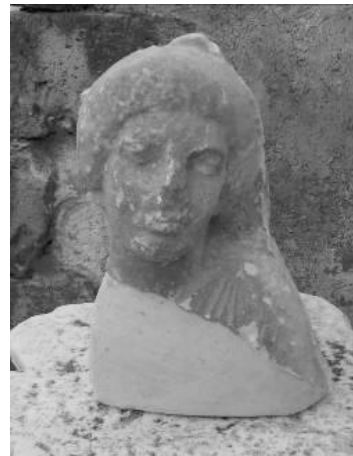
Εικ. 9. Η μαρμάρινη κεφαλή θερααινίδας στο Αρχαιολογικό Μουσείο Χανίων (Λ 98).