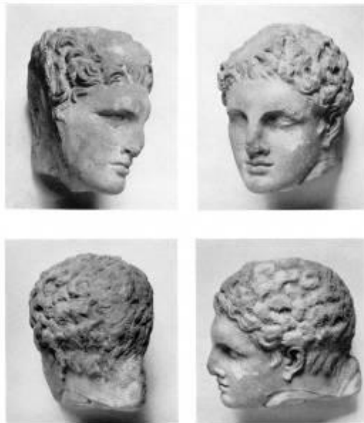
Εικ. 5. Επιτύμβια ανδρική κεφαλή στο Metropolitan Museum.