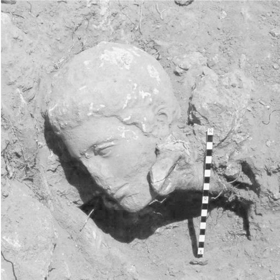
Εικ. 1. Το γλυπτό της Φαλάσαρνας κατά την ανεύρεση του το 2008

Ιωάννης Φραγκάκης Αρχαιολόγος – Ερευνητής Ρώμη