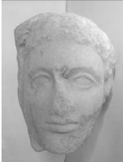
Εικ. 6. Το γλυπτό της Φαλάσαρνας (ΦΑ 681) κατ' ενώπιον.