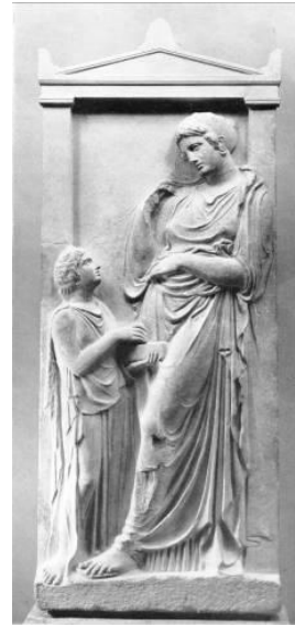
Εικ. 8. Επιτύμβια στήλη από το Κορωπί Αττικής στο Metropolitan Museum (36,11,1).