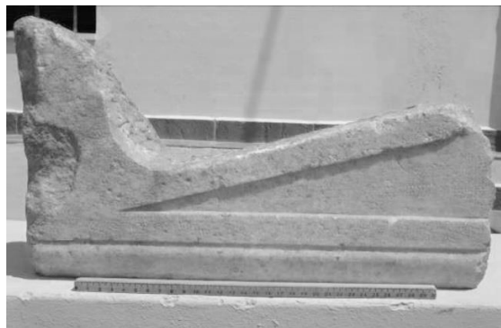
Εικ. 10. Τμήμα ανάγλυφου μαρμάρινου αετώματος από την ανασκαφή του Πύργου 4 της Φαλάσαρνας το 2016 (Αρχαιολογικό Μουσείο Κισιάμου).