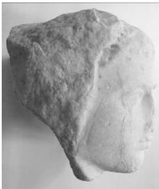
Εικ. 3. Η δεξιά παρειά του γλυπτού (ΦΑ 681)