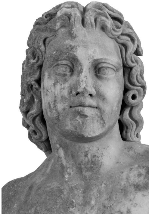
Εικόνα 5. Αγαλμάτιο Μουσείου Πειραιώς αρ. ευρ. 1212. Το πρόσωπο της μορφής.