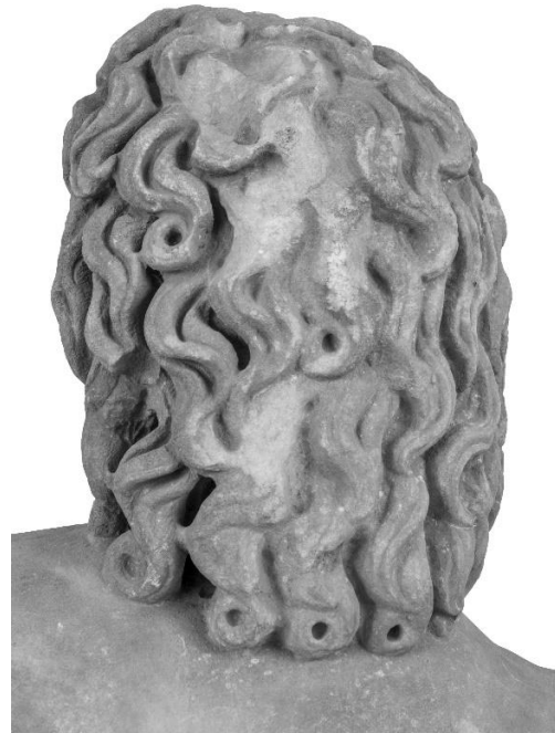
Εικόνα 6. Αγαλμάτιο Μουσείου Πειραιώς αρ. ευρ. 1212. Πίσω πλευρά κεφαλής.