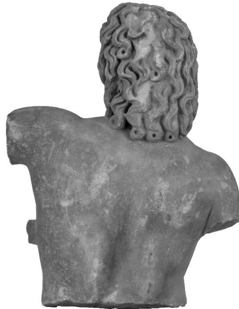
Εικόνα 2. Αγαλμάτιο Μουσείου Πειραιώς αρ. ευρ. 1212. Πίσω πλευρά.