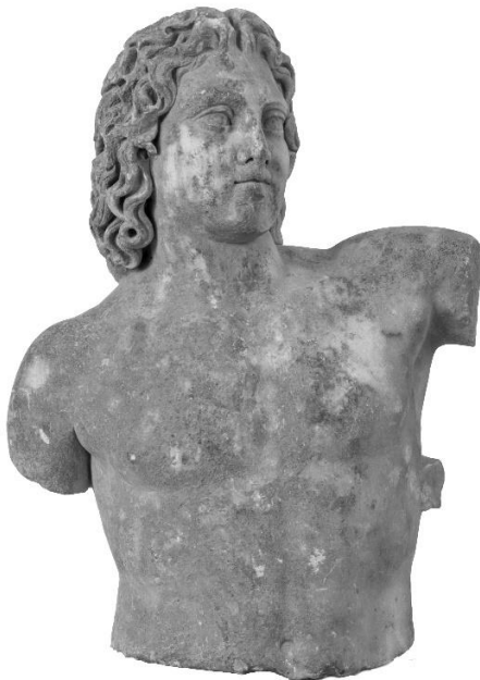
Εικόνα 1. Αγαλμάτιο Μουσείου Πειραιώς αρ. ευρ. 1212. Πρόσθια όψη.