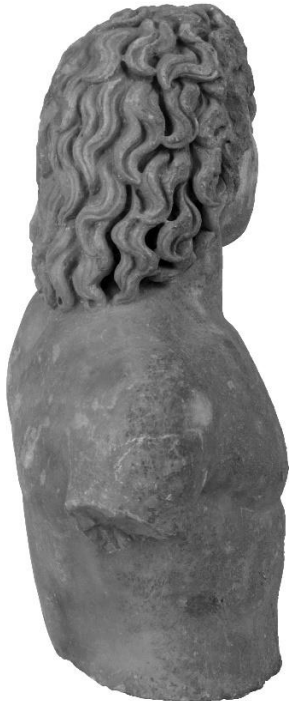
Εικόνα 3. Αγαλμάτιο Μουσείου Πειραιώς αρ. ευρ. 1212. Δεξιά πλευρά.