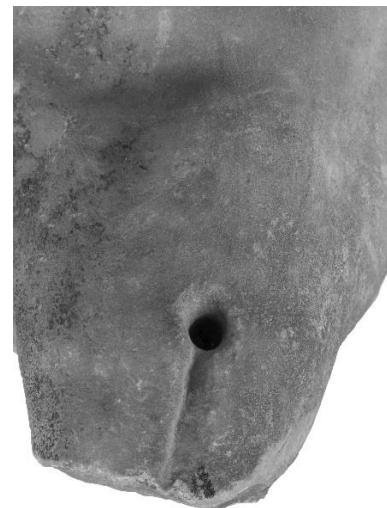
Εικόνα 9. Αγαλμάτιο Μουσείου Πειραιώς αρ. ευρ. 1212. Ο τώρμος και η ρηχή αύλακα επάνω στον αριστερό ώμο.