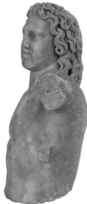
Εικόνα 4. Αγαλμάτιο Μουσείου Πειραιώς αρ. ευρ. 1212. Αριστερή πλευρά.