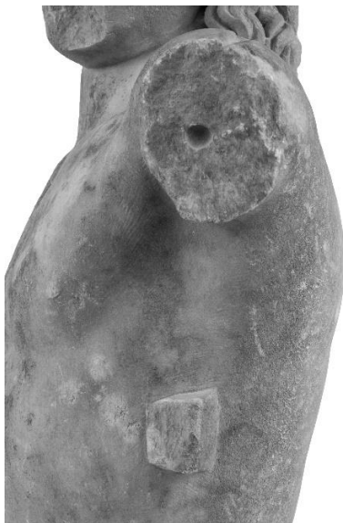
Εικόνα 7. Αγαλμάτιο Μουσείου Πειραιώς αρ. ευρ. 1212. Μερική άποψη αριστερής πλευράς. Ο τώρμος γόμφωσης στον βραχίονα και το κατάλοιπο στηρίγματος στον κορμό.