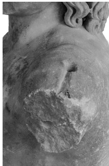
Εικόνα 8. Αγαλμάτιο Μουσείου Πειραιώς αρ. ευρ. 1212. Οι δύο τώρμοι, επάνω στον αριστερό ώμο και στον αριστερό βραχίονα.