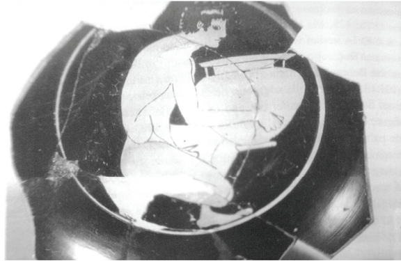
Εικ. 8 Κέλιξ στην τεχνοτροπία του Ζωγράφου του Νικοσθένους, Μουσείο Ερμιτάζ Β 75.192: Πιγίνα 2001, 164, εικ. 5.