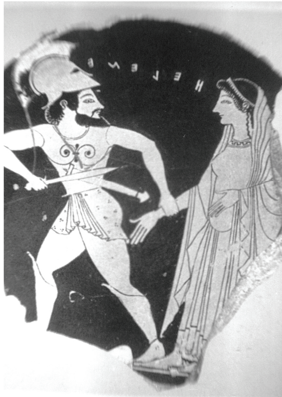
Εικ 4 Αποσπασματικό πινάκιο Όλτου, Μουσείο Οδησσού: 21972: LIMC, IV, πίν. 346, Helene, 310.