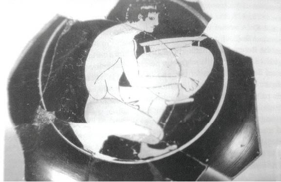
Εικ. 8 Κύλιξ στην τεχνοτροπία του Ζωγράφου του Νικοσθένους, Μουσείο Ερμιτάζ Β 75.192: Πιγίνα 2001, 164, εικ. 5.