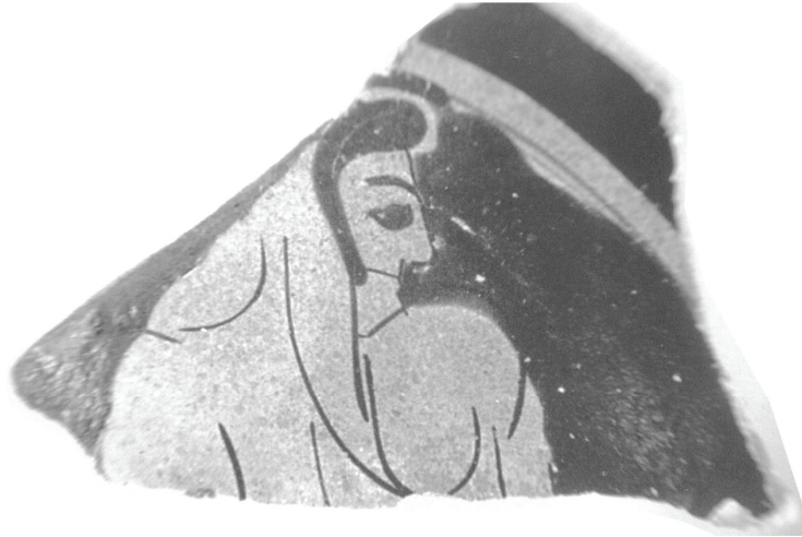
Εικ. 9 Θραύσμα κύλικας του Ζωγράφου του Πίθου, Μόσχα, Μουσείο Πούσκιν: CVA Moscow 4, πίν. 47.5.