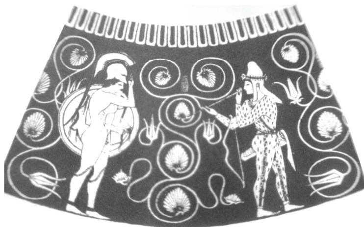
Εικ. 2 Αλάβαστρο του Ψίακος, Μουσείο Οδησσού 26002: Pfuhl 1923, εικ. 344.