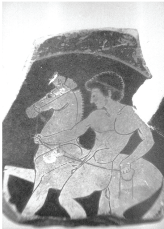
Εικ. 6 Θραύσμα κύλικας κοραλλί εδάφους, με την υπογραφή του κεραμέα Καχυλιώνα, Μουσείο Ερμιτάζ, NB 6484: Peredolskaya 1967, πίν. CLVIII.2.