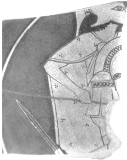
Εικ. 1 Κύλιξ του Ψίακος, Μουσείο Ερμιτάζ 98β: Peredolskaya 1967, πίν. CLVIII.1.