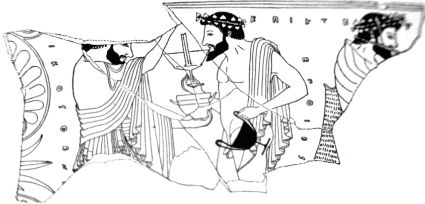
Εικ. 3 Αποσπασματικός κώνθαρος Επικτήτου, Μουσείο Οδησσού 26338: Horpin 1919, 321.