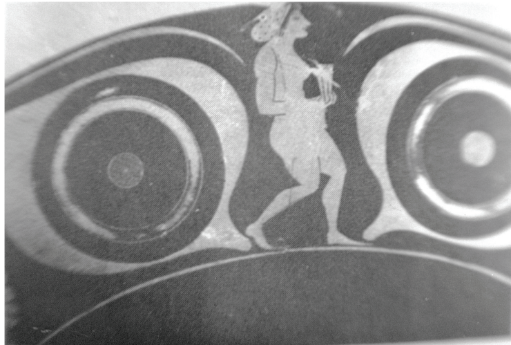
Εικ. 5 Δίγλωσση οφθαλμωτή κύλικα Όλτου, Αγία Πετρούπολη, Αρχαιολογικό Ινστιτούτο, 5572: Wissenschaftliche Zeitschrift der Universität Rostock 19, 1970, πίν.12.1.