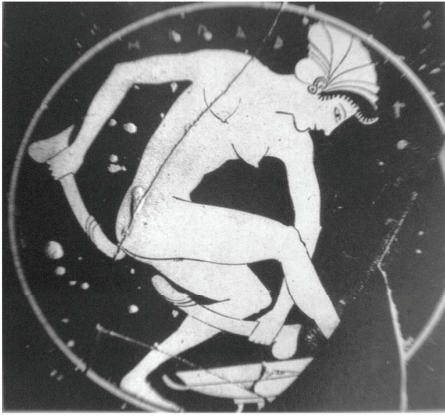
Εικ. 7 Κύλιξ του Επικτήτου, Μουσείο Ερμιτάζ 14611