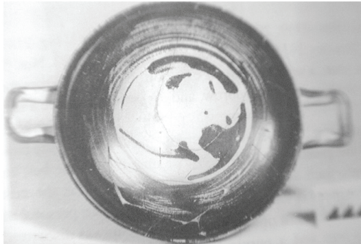
Εικ. 10 Κύλικα του Ζωγράφου του Πίθου, Μουσείο Ερμιτάζ: Πιγίνα 2001, 165, εικ. 7.