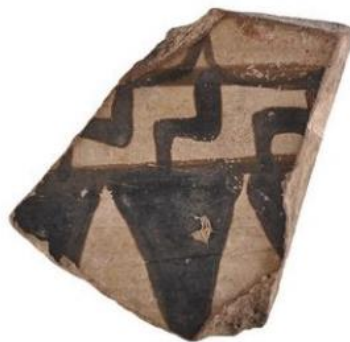
Fig. 3. Brussels, Musée du Cinquantenaire, A1783. Preserved width 3,1 cm. Orientation uncertain.