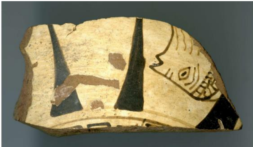
Fig. 2. London, British Museum 1924,1201.1141. Preserved width 7,5 cm.