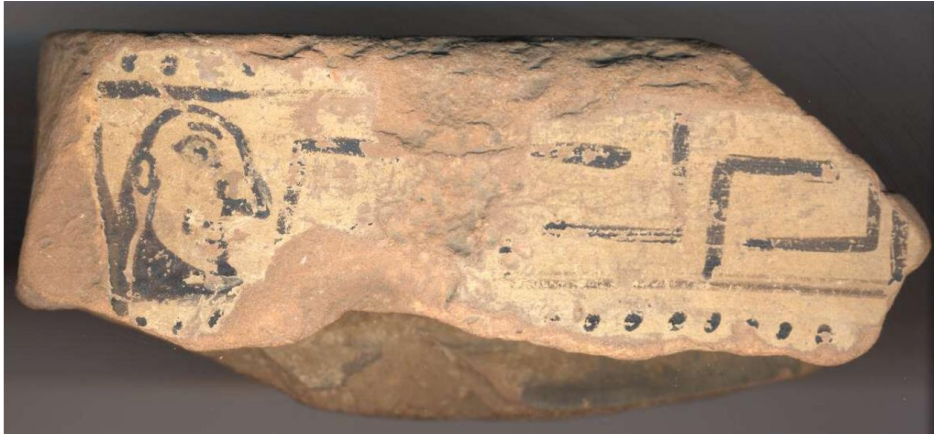
Fig. 1. Oxford, Ashmolean Museum, AN1896-1908-G.119.51. Preserved width 9,7 cm.