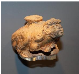
Εικόνα 3β. Λύχνος σε σχήμα καθιστής μορφής, με προσώπειο δούλου στεφανηφόρου, 2ος/1ος αι. π.Χ. (φωτογραφικό αρχείο Εφ.Α. Δωδεκανήσου).