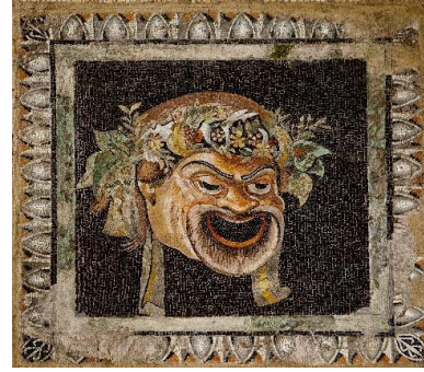
Εικόνα 2α. Έμβλημα ψηφιδωτού δαπέδου με παράσταση προσώπειου της Νέας Κωμωδίας «Θεράπων ηγεμών», Μέσης Ελληνιστικής περιόδου.