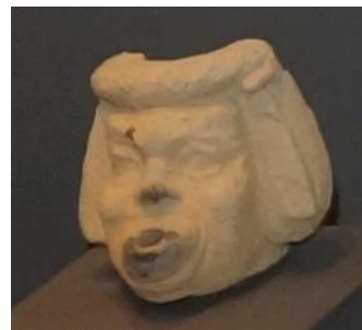
Εικόνα 3γ. Λύχνος σε μορφή προσώπειου της Νέας Κωμωδίας: ο «πάγχρηστος νεανίσκος». 2ος/1ος αι. π.Χ..