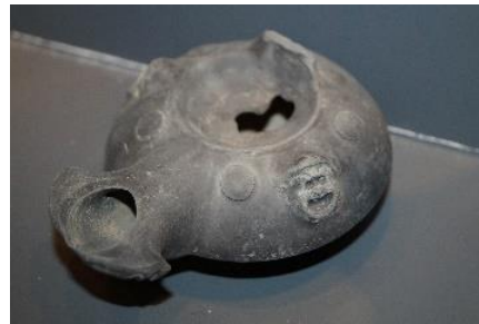
Εικόνα 3α. Λύχνος με ανάγλυφο κωμικό προσώπειο δούλου, 2ος αι. π.Χ. (φωτογραφικό αρχείο Εφ.Α. Δωδεκανήσου).