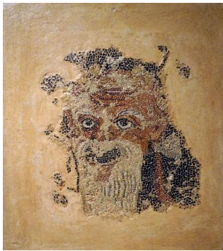
Εικόνα 2β. Έμβλημα ψηφιδωτού δαπέδου με παράσταση προσώπειου της Νέας Κωμωδίας «Πάππος πρότος», ρωμαϊκής περιόδου (φωτογραφικό αρχείο Εφ.Α. Δωδεκανήσου).