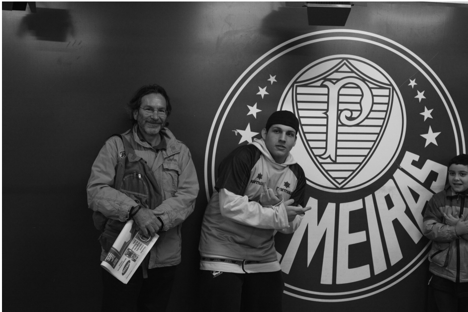
2009. Σάο Πάολο. Συνέδριο της RC21 της Διεθνούς Κοινωνιολογικής Εταιρείας (ISA). Βγαίνοντας από το γήπεδο μετά από ποδοσφαιρικό αγώνα Palmeiras-Internacional.