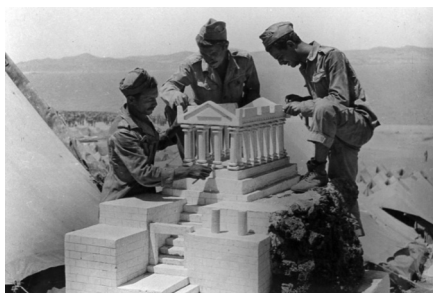
Εγκλειστοί προς «αναμόρφωση» στη Μακρόνησο. Εικόνα από το ντοκιμαντέρ «Ο νέος Παρθενώνας» (1975), σενάριο-σκηνοθεσία Θ. Σκρουμπέλος, Κ. Χρονόπουλος, Γ. Χρυσοβιτσάνος, Σ. Ζάχος

πολλών επιστημόνων και μελετητών, συμβάλλοντας στη μετατόπιση δεδομένων, εννοιών, στόχων, εργαλείων και μελετητικών πρακτικών – στη μετατόπιση δηλαδή του αντικειμένου του σχεδιασμού της πόλης.