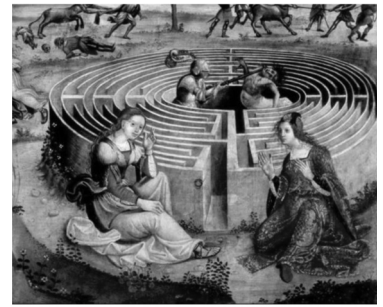
Απόσπασμα του πίνακα «Ο Θησέας και ο Μινώταυρος» (Maestro di Tavarnelle, 16ος αι., Musée du Petit Palais, Αβινιόν)

Ο λαβύρινθος αυτός συγκροτείται από ένα ιδιαίτερα περίπλοκο δίκτυο δράντων διακυβέρνησης , ανθρώπων, ομάδων, εταιρειών, οργανισμών, που απαρτίζεται (ενδεικτικά) από: τον επενδυτή με στελέχη σε διάφορες βαθμίδες· τις ανώνυμες εταιρείες του δημοσίου (ΤΑΙΠΕΔ, Ελληνικό ΑΕ) με αντίστοιχα στελέχη· ένα πολυπληθές δίκτυο συμβούλων που απασχολούνται τακτικά ή περιστασιακά –νομικών, πανεπιστημιακών καθηγητών, οικονομολόγων, χωροτακτών, πολεοδόμων, αρχιτεκτόνων, συγκοινωνιολόγων, περιβαλλοντολόγων κ.ά.– και μια σειρά από μελετητικά γραφεία διαφορετικών ειδικοτήτων. Για την «επίλυση» των κρίσιμων ζητημάτων που προκύπτουν καθίστανται αναγκαίες πολλαπλές διεπαφές των παραπάνω δράντων, σε όλα τα επίπεδα ιεραρχίας, με την εκάστοτε πολιτική ηγεσία και τη δημόσια διοίκηση, την τοπική αυτοδιοίκηση, τη δικαιοσύνη, επαγγελματικούς και επιστημονικούς συλλόγους και, για ένα διάστημα τουλάχιστον, με τους «θεσμούς» οι οποίοι υπό το καθεστώς μνημονίων επιτηρούσαν την πρόοδο του έργου. Παράλληλα, ο (καταρχήν) επενδυτής συμβάλλεται με άλλους (πιθανούς) επενδυτές, κατασκευαστικές εταιρείες και ομίλους, ενώ αναζητά στηρίγματα σε κομμάτια της ελληνικής κοινωνίας που δυνητικά θα κληθούν να υποστηρίξουν το έργο ως ιδιοκτήτες και καταναλωτές. Θα μπορούσαμε να υποθέσουμε ότι γύρω από το «Ελληνικό» συγκροτείται –ή επιδιώκεται να συγκροτηθεί– ένα πεδίο σύγκλισης οικονομικών, πολιτικών και τεχνικών ελίτ. Αλλά και ένα πεδίο σύγκλισης