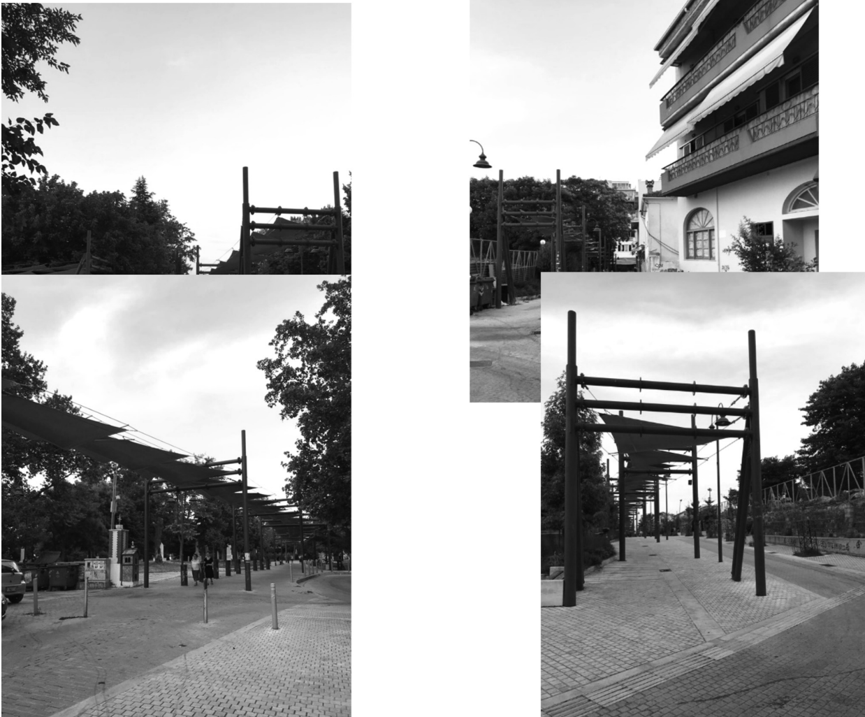
Εδώ Εικόνες 2-5: Απόψεις του δικτύου σκιάστρων που αποτέλεσε τη βάση άσκησης αρνητικής κριτικής του έργου.

στην περιοχή του φρουρίου θεωρώντας ότι κακοποιούν βάνουσα τον ιστορικό αυτό τόπο» (Σύλλογος Αρχιτεκτόνων Λάρισας, 2015). Παρ' όλα αυτά, το έργο της βιοκλιματικής ανάπλασης τμήματος Ιστορικού Κέντρου της Λάρισας υλοποιήθηκε και ο Δήμος Λαρισαίων απέσπασε το βραβείο περιβαλλοντικής ευαισθησίας «Οικόπολις 2017», στην κατηγορία «Τοπική Αυτοδιοίκηση – Αστική Ανάπλαση».