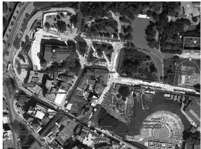
Εικόνα 1 – Πολεοδομικές ενότητες Λάρισας και εντοπισμός περιοχής μελέτης

Μέρος αυτής της νέας ταυτότητας, και ειδικά το δίκτυο σκιάστρων, συνάντησε πληθώρα αντιδράσεων από σημαντικό μέρος της τοπικής κοινότητας. Πιο συγκεκριμένα, το έργο σε διάφορα έντυπα και ηλεκτρονικά δημοσιεύματα χαρακτηρίστηκε αρνητικά καθώς αντιμετωπίστηκε ως «δραστική παρέμβαση στον ευρύτερο ελεύθερο δημόσιο χώρο με γιγάντιες μεταλλικές κατασκευές» (Σαμαράς, 2015) και το δίκτυο σκιάστρων ως «σίδερα της ντροπής» στο Φρούριο». Το ίδιο διάστημα πραγματοποιήθηκαν συγκεντρώσεις με στόχο τη διακοπή του έργου (EPT, 2015). Παράλληλα, ο Σύλλογος Αρχιτεκτόνων Λάρισας «...εξέφρασε δημόσια την πλήρη αντίθεσή του για τις μεταλλικές κατασκευές